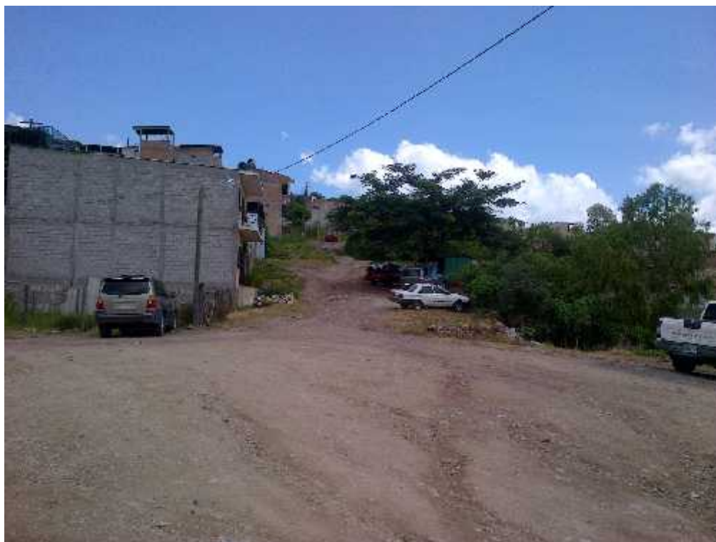
FINAL DE CALLE A PAVIMENTAR