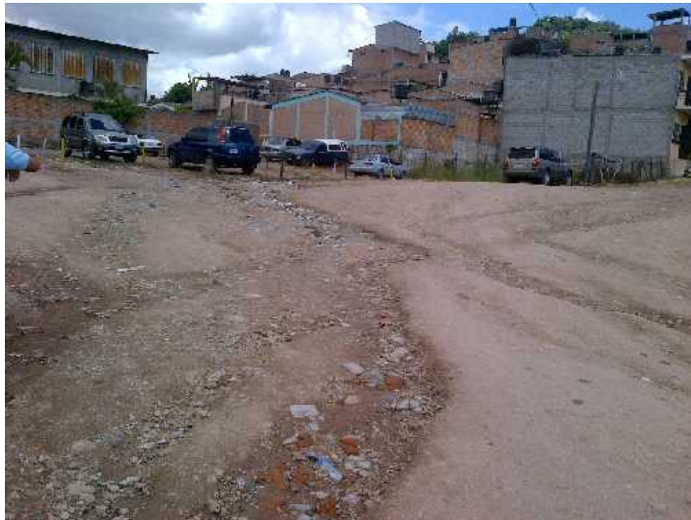
VISTA DE ÁREA DE ESTACIONAMIENTO