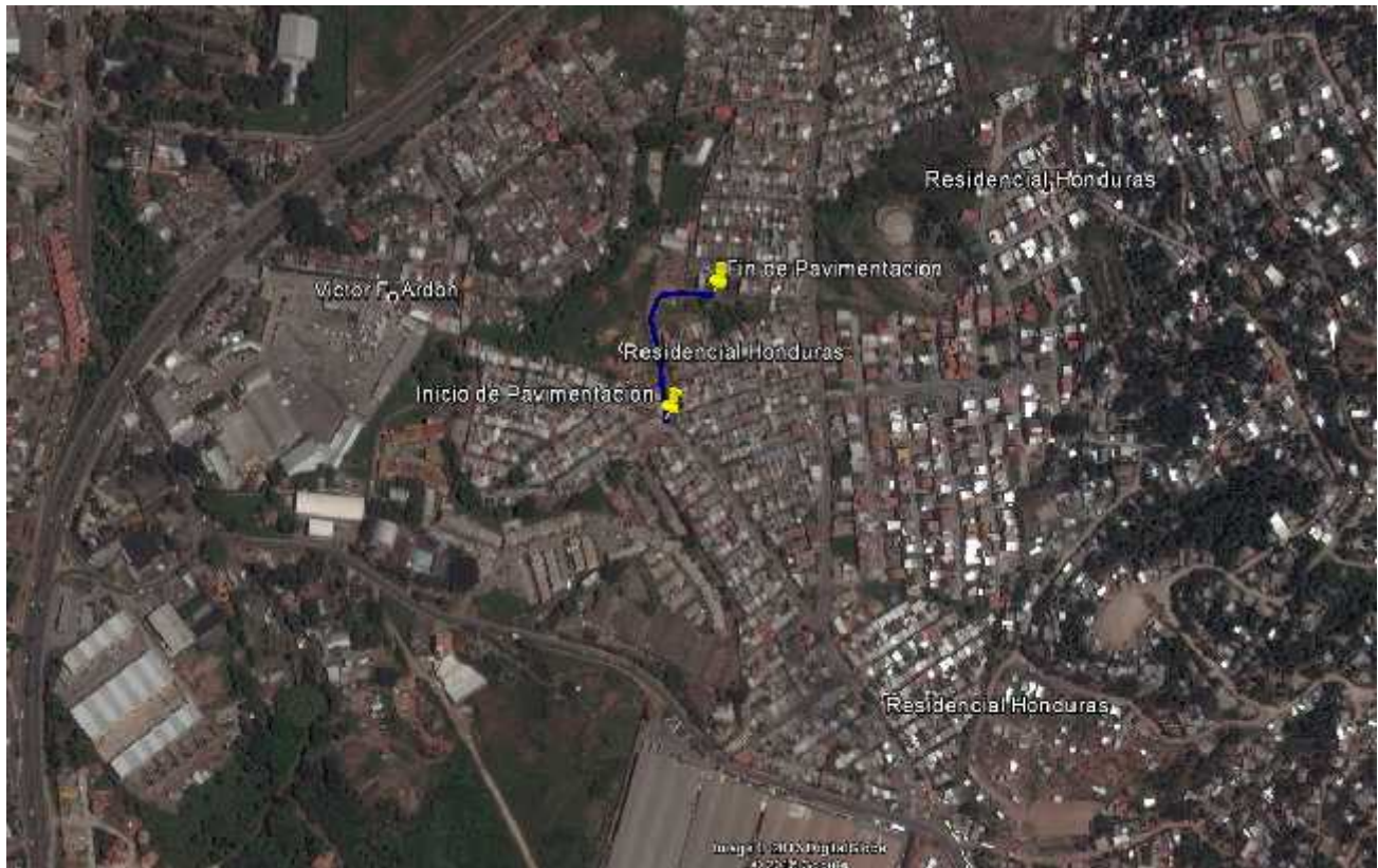
Ubicación del proyecto y calles a pavimentar