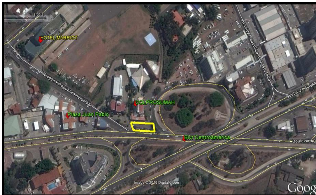
Ubicación frente al COLPROSUMAH