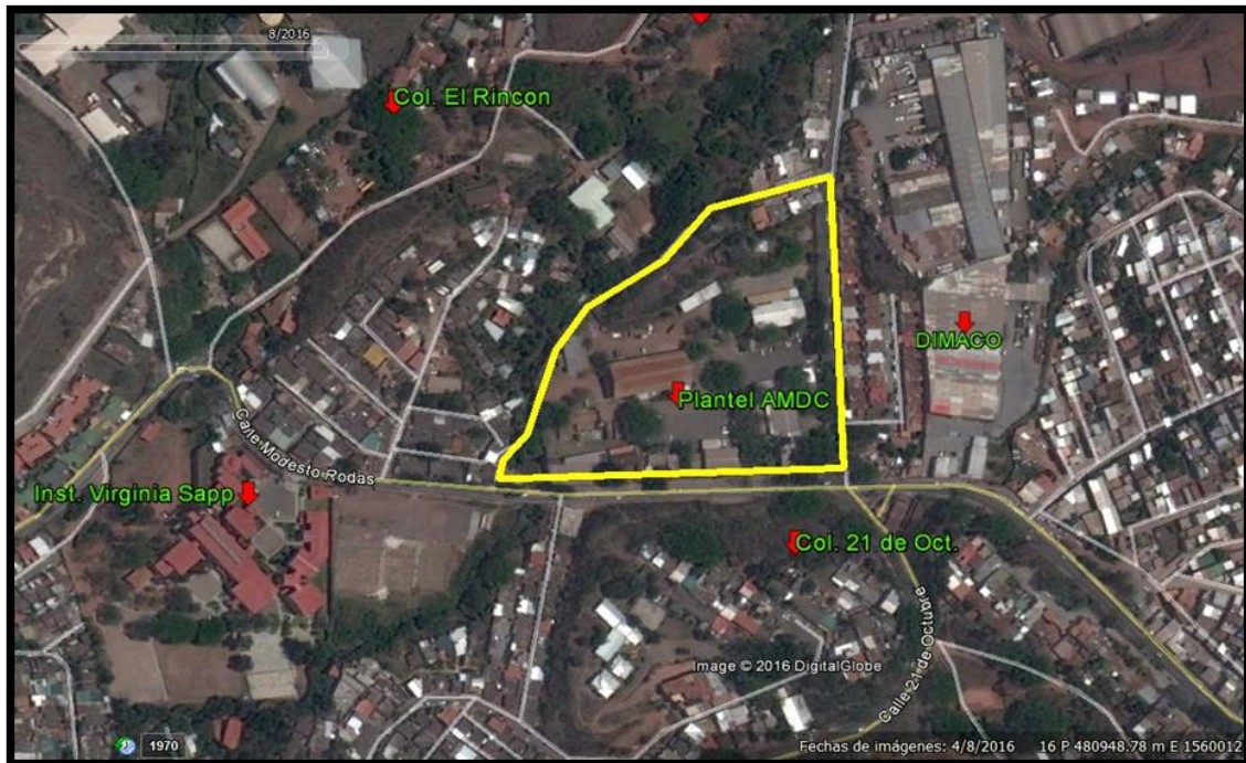
Plantel de la AMDC, aquí se encuentran las Instalaciones del programa COMVIDA

Proyecto: Remodelación de área social en COMVIDA y ampliación de calzada frente a COLPROSUMAH Código: 1323