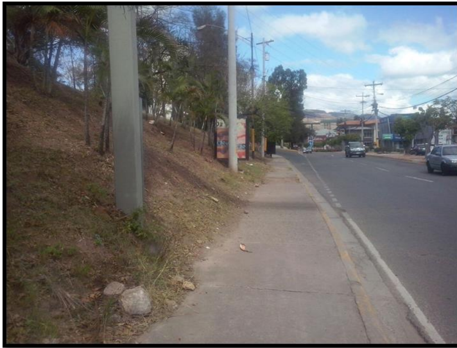
Zona de trabajo frente a COLPROSUMAH