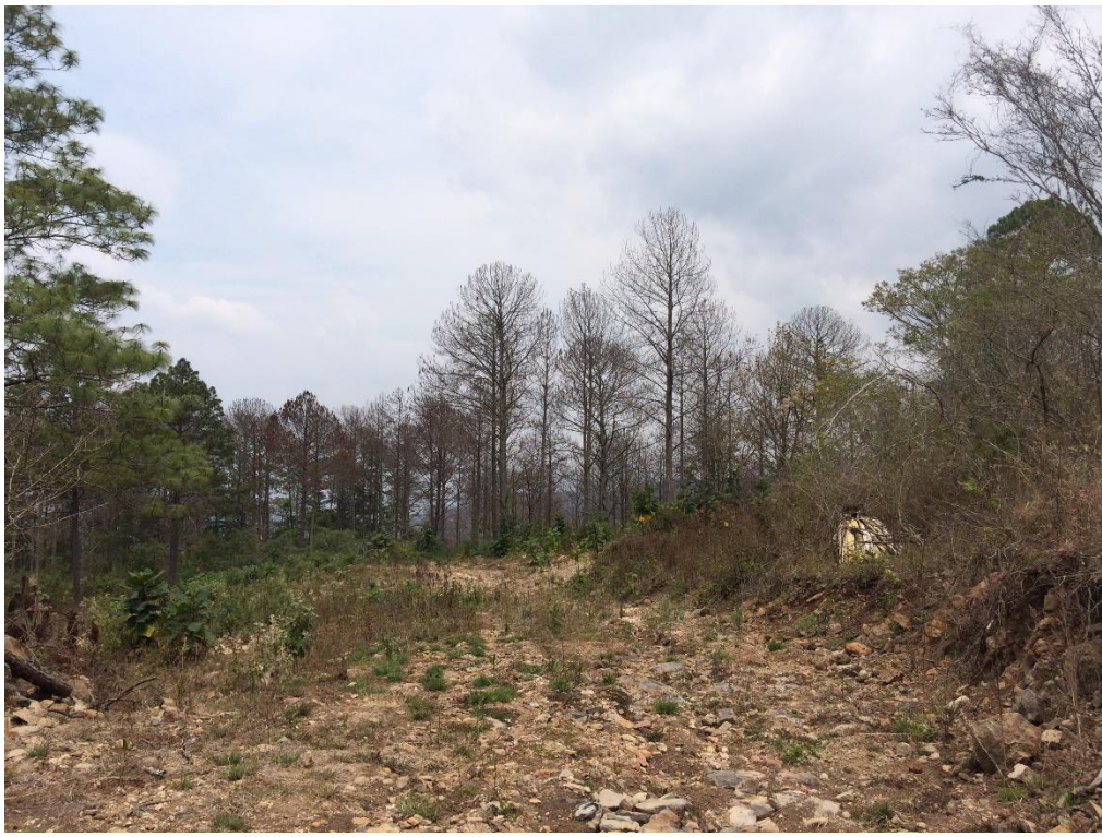
FINAL DE CALLE QUE REQUIERE MECANIZADO Y BALASTADO