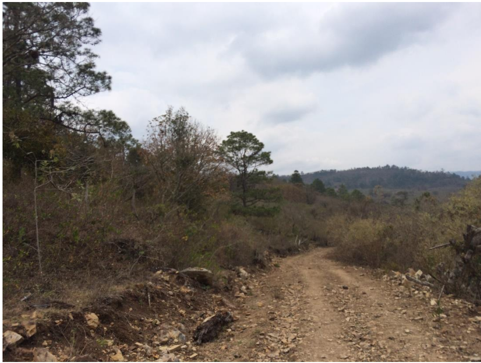
VISTA PANORÁMICA DE CALLE A REPARAR