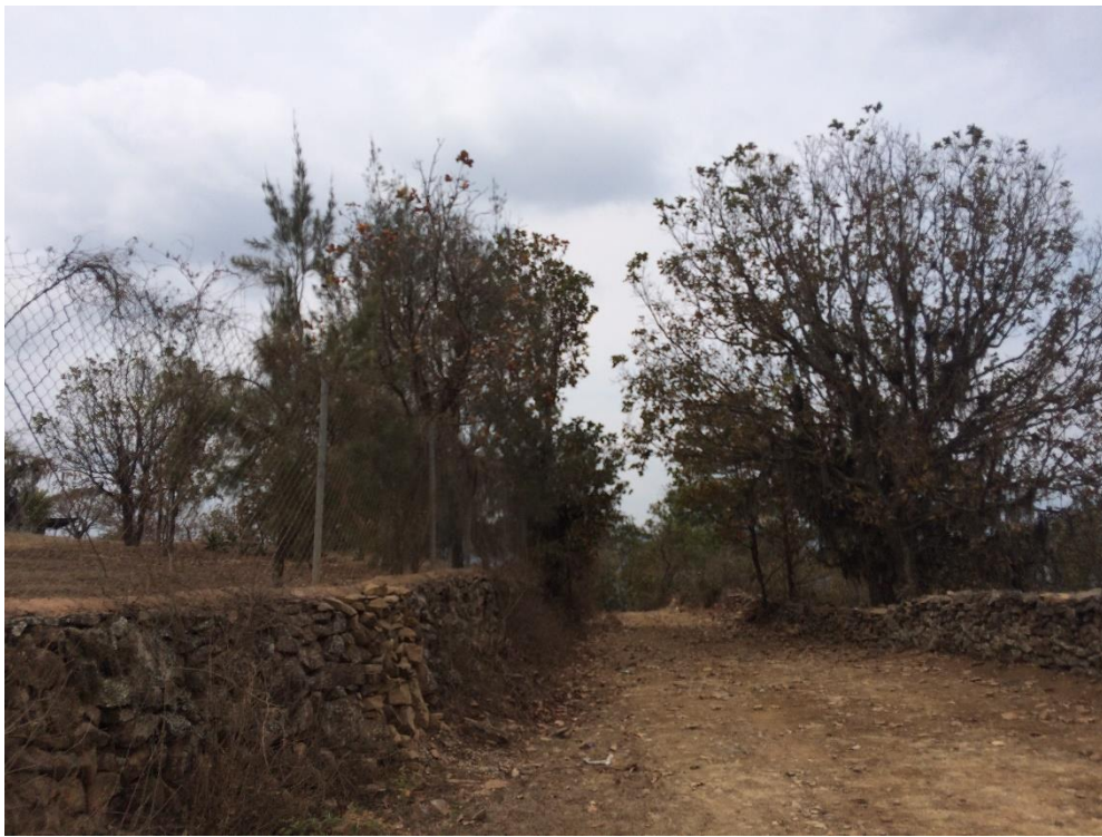
VISTA ACTUAL DE CALLE A REPARAR