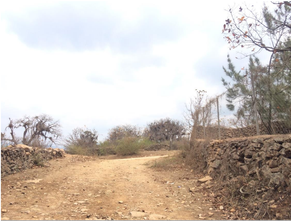
INICIO DE CALLE A REPARAR