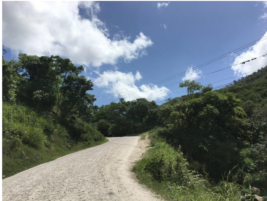
Panorama del tramo en el que se hará el balastado