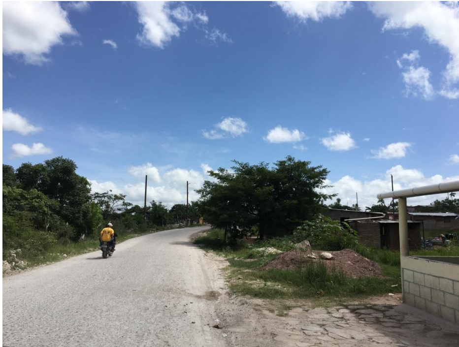
Panorama del tramo en el que se hará el balastado