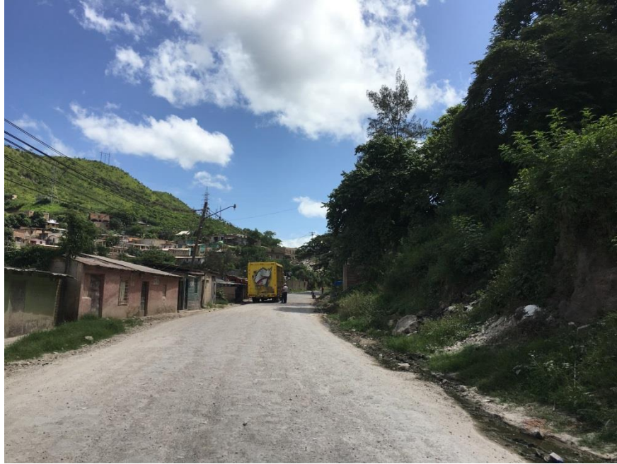
Inicio del balastado