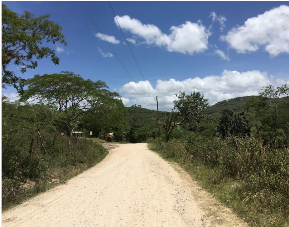
Final del balastado