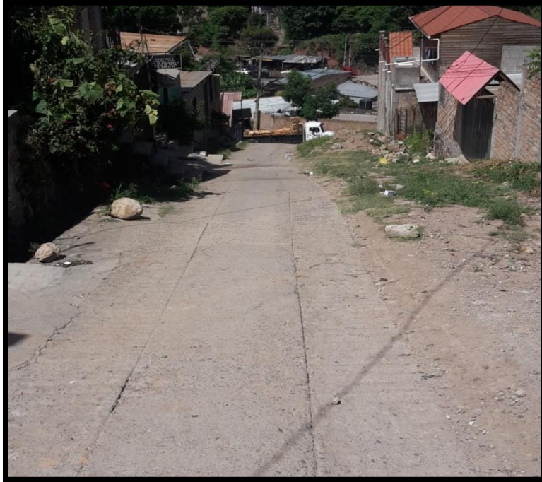
Panorama del tramo donde se demolerán las huellas

Proyecto: Pavimentación de calle con concreto hidráulico, colonia Villa Nueva sector #2, calle 5 Código: 1298