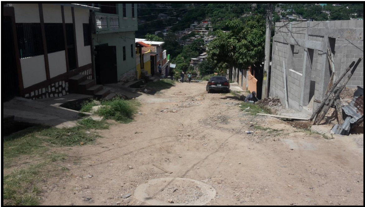
Panorama del tramo a pavimentar