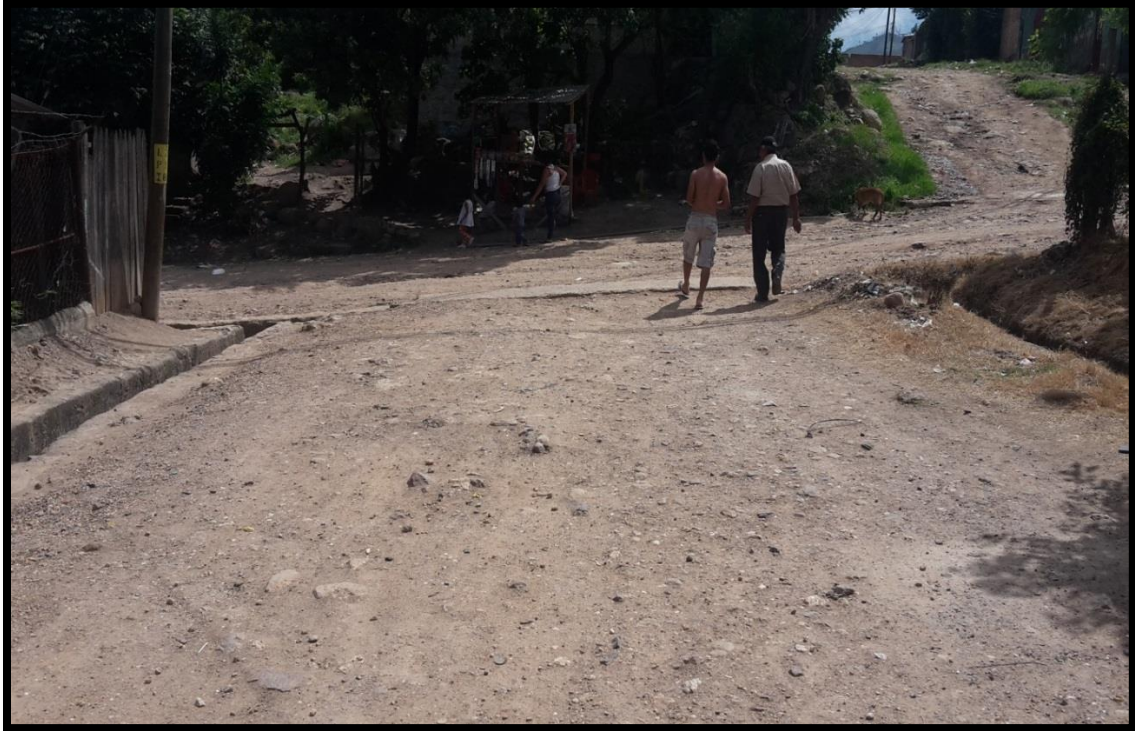
Inicio de tramo a pavimentar con concreto hidráulico

Proyecto: Pavimentación de calle con concreto hidráulico, colonia Villa Nueva sector #2, calle 5 Código: 1298