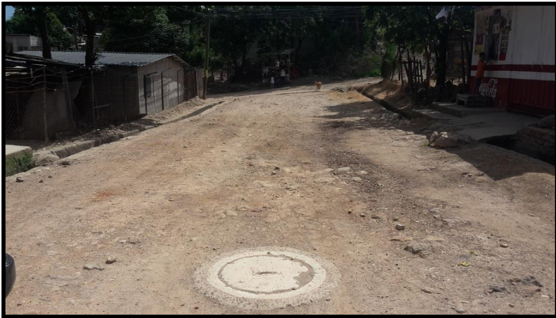
Panorama de tramo a pavimentar con concreto hidráulico