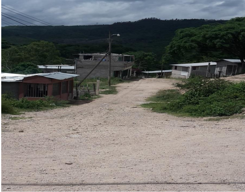
VISTA PANORAMICA DE TRAMO A REPARAR