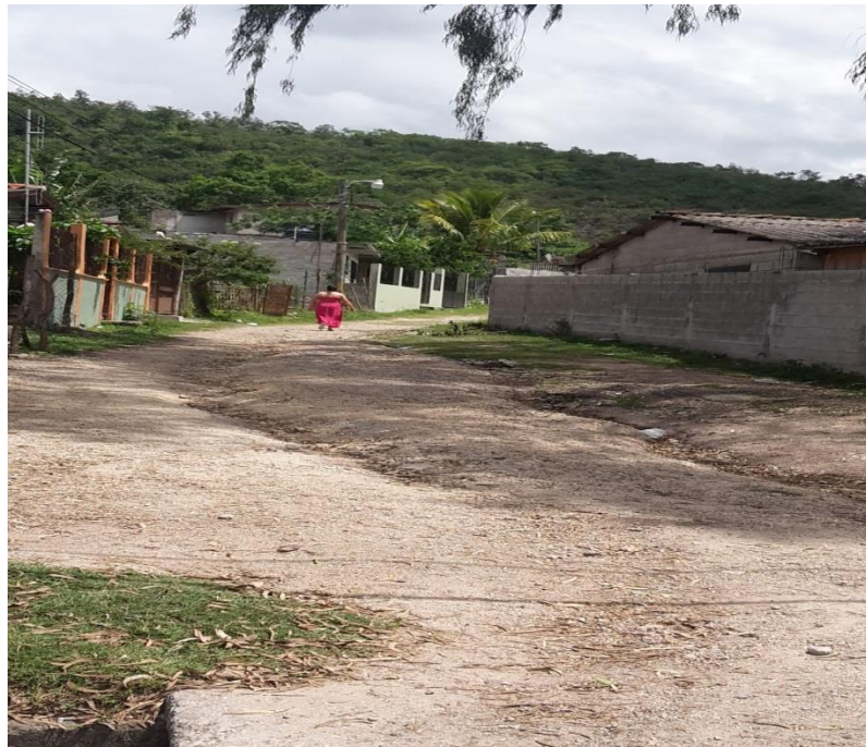
VISTA ACTUAL DEL MAL ESTADO DEL TRAMO A REPARAR