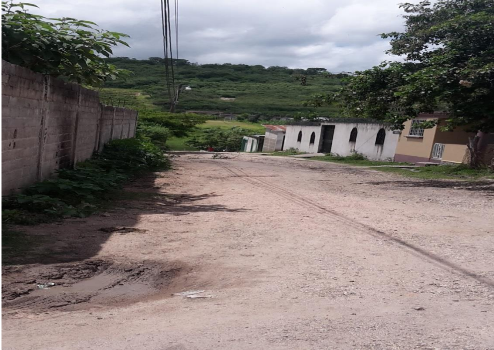
VISTA ACTUAL DEL TRAMO A REPARAR