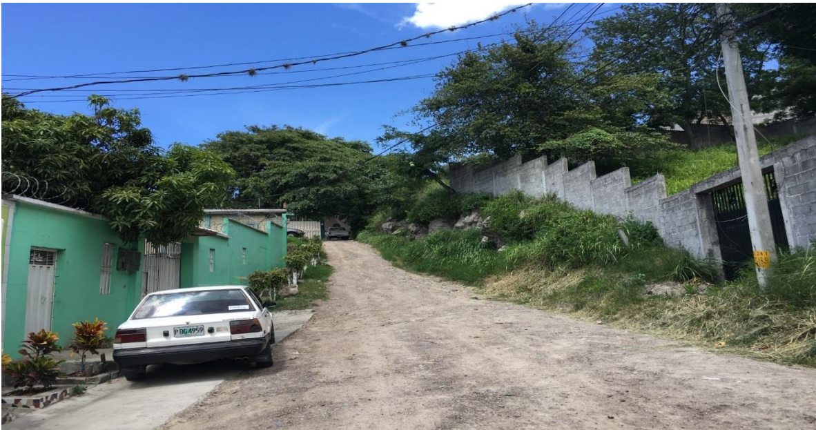
Panorama del tramo a pavimentar con concreto hidráulico