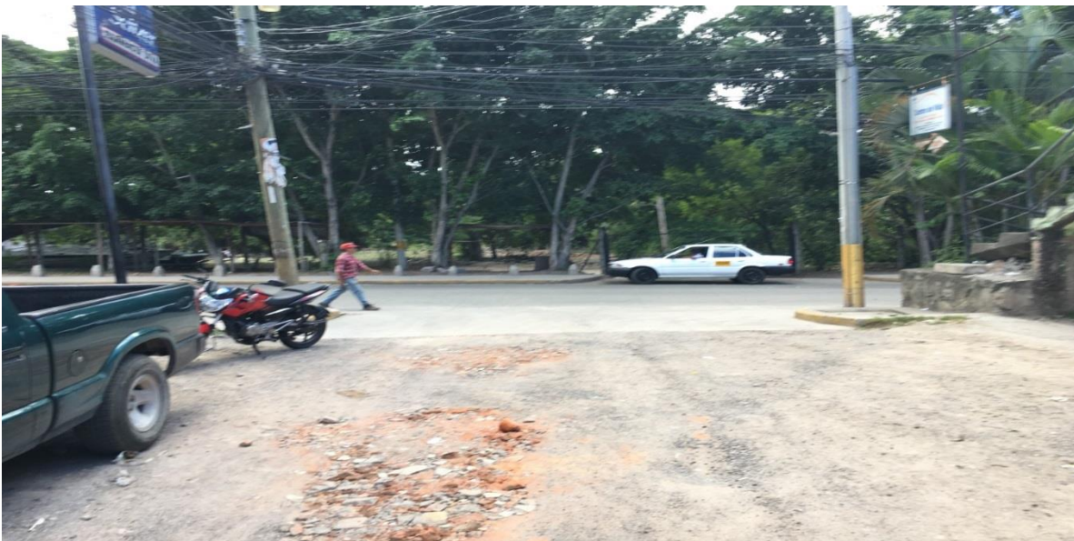
Panorama del tramo a pavimentar con concreto hidráulico