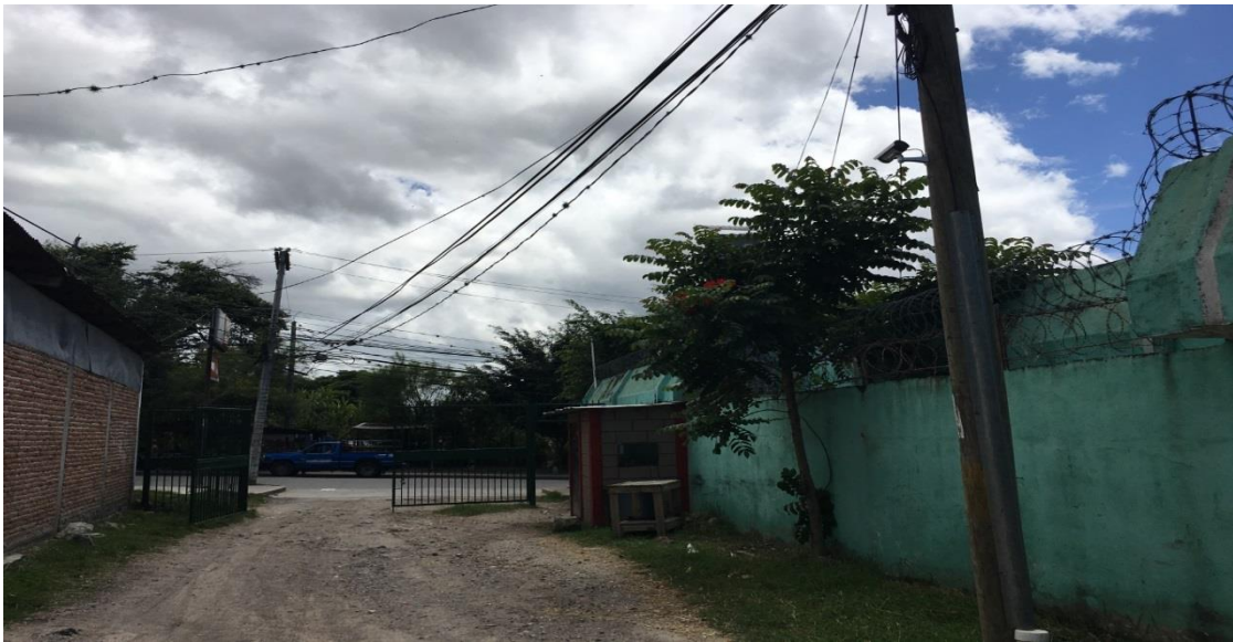
Inicio del tramo a pavimentar con concreto hidráulico