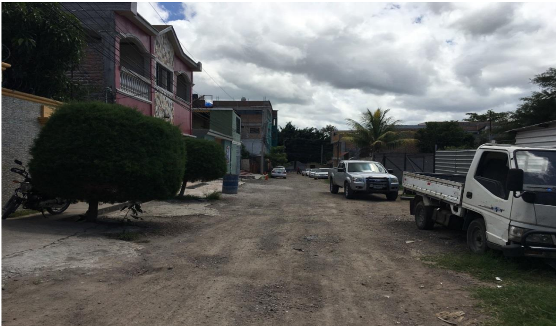
Panorámica de tramo a pavimentar con concreto hidráulico