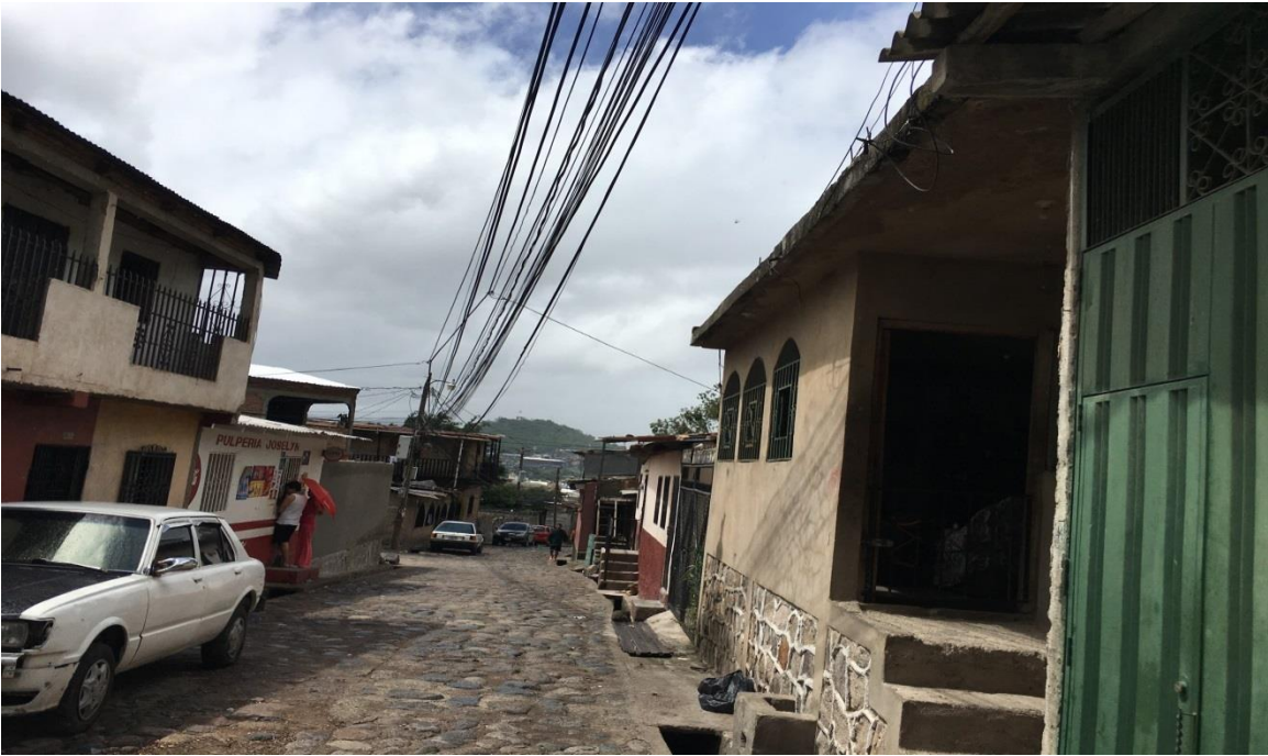
VISTA DE CALLE A PAVIMENTAR