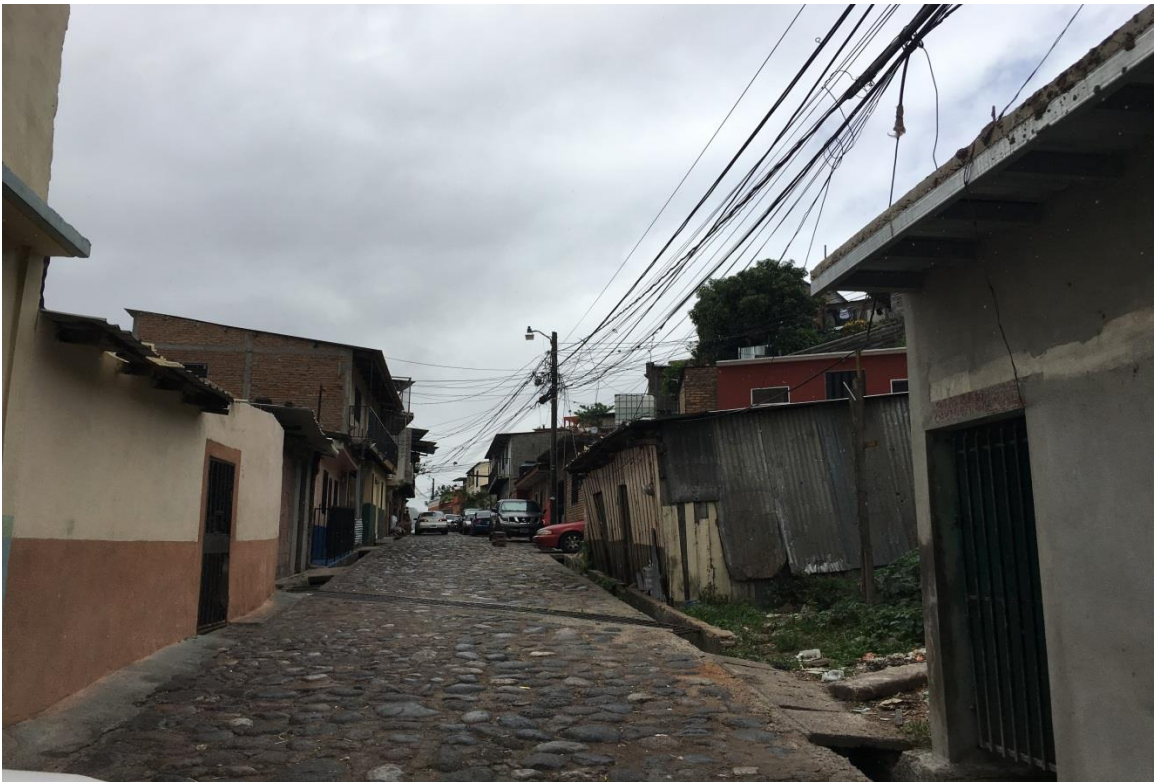
VISTA DE LA REPARACION DEL EMPEDRADO Y WHITE TOPPING