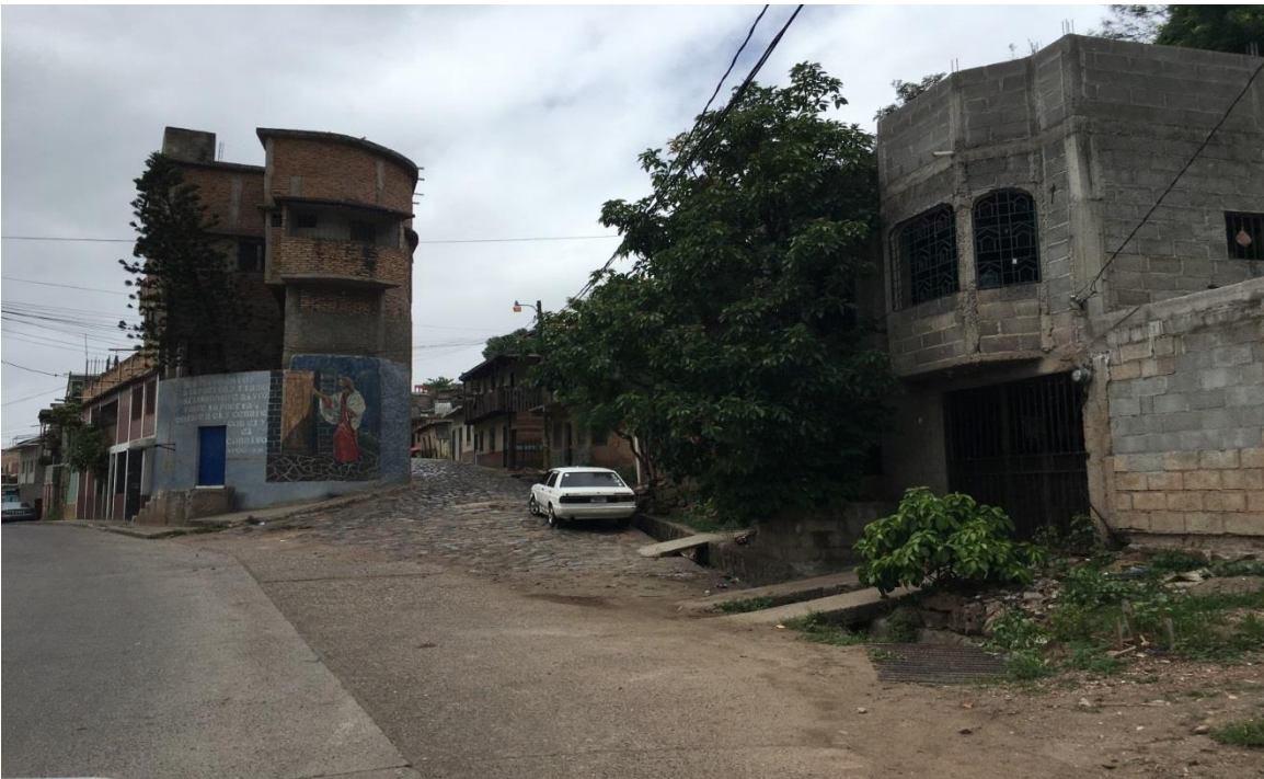
INICIO DE WHITE TOPPING