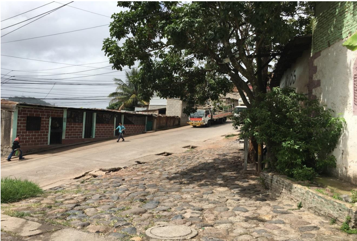
VISTA DEL FINAL DEL PROYECTO