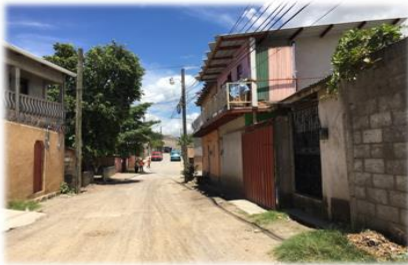
FINAL DE PAVIMENTACIÓN CON CONCRETO HIDRAULICO