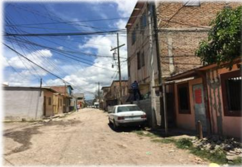
TRAMO A PAVIMENTAR CON CONCRETO HIDRAULICO.