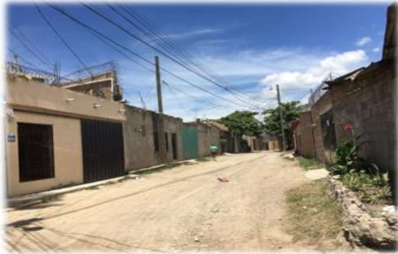
TRAMO A PAVIMENTAR CON CONCRETO HIDRAULICO