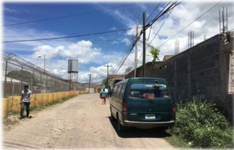
INICIO DE PAVIMENTACION CON CONCRETO HIDRAULICO.