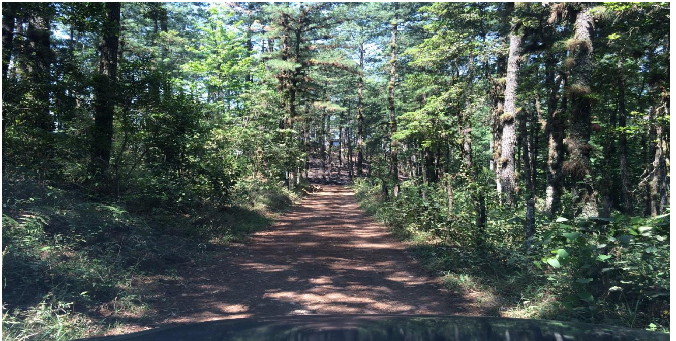
VISTA DEL TRAMO FINAL EN ALDEA EL TRIGO