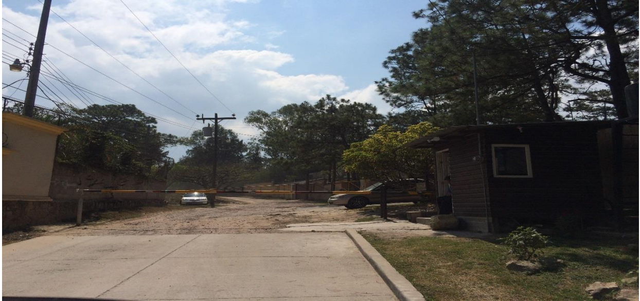
TRAMO A REPARAR EN ACCESO A LA ALDEA EL TRIGO