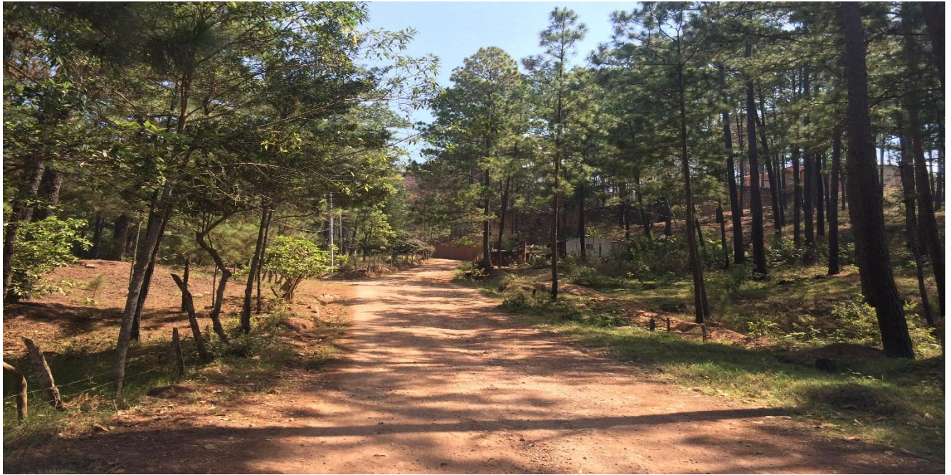
VISTA DEL MAL ESTADO DEL ACCESO A ALDEA EL TRIGO