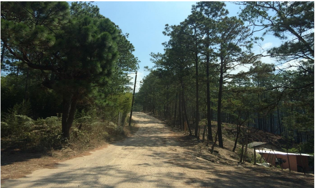
OTRA VISTA PANORAMICA DEL TRAMO A REPARAR