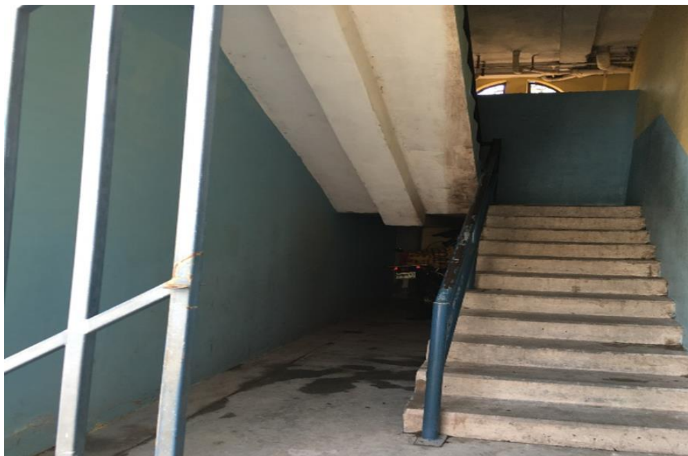
VISTA DEL ESTADO DE LAS GRADAS.