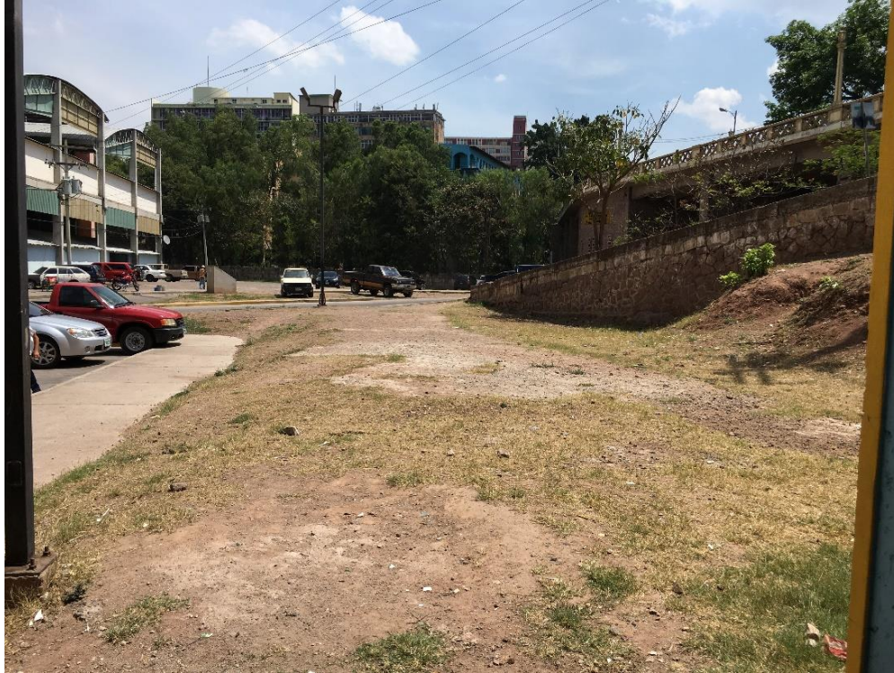
AREAS EXTERNAS DE LA INSTITUCIÓN

Proyecto: Reparación de escuela Enriqueta de Lázarus y clínica médica mercado La Isla Código: 1074