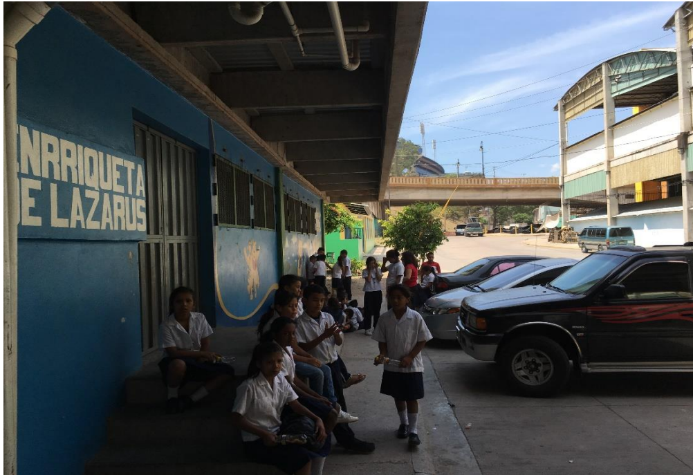
ESCUELA ENRIQUETA LAZARUS, DONDE SE REALIZARA LA AMPLIACIÓN Y REMODELACIÓN.

Proyecto: Reparación de escuela Enriqueta de Lázarus y clínica médica mercado La Isla Código: 1074