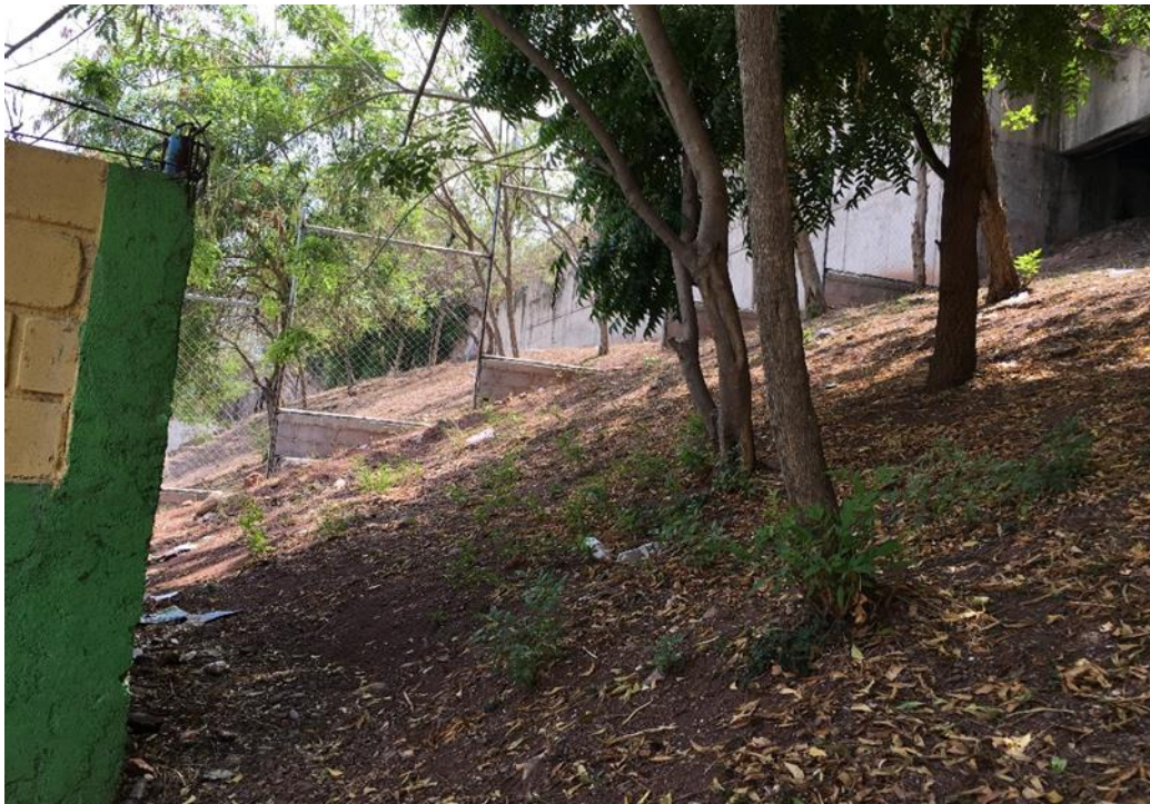
LUGAR DONDE SE REALIZARA LA CONSTRUCCION DE MURO PERIMETRAL.