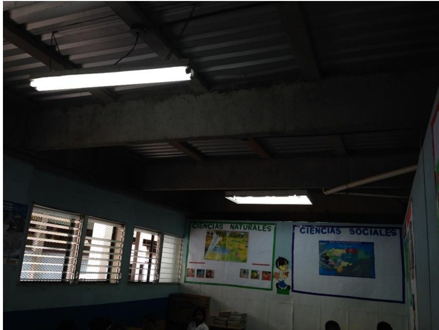
SITUACIÓN ACTUAL DE LA ESCUELA ENRIQUETA LAZARUS

Proyecto: Reparación de escuela Enriqueta de Lázarus y clínica médica mercado La Isla Código: 1074