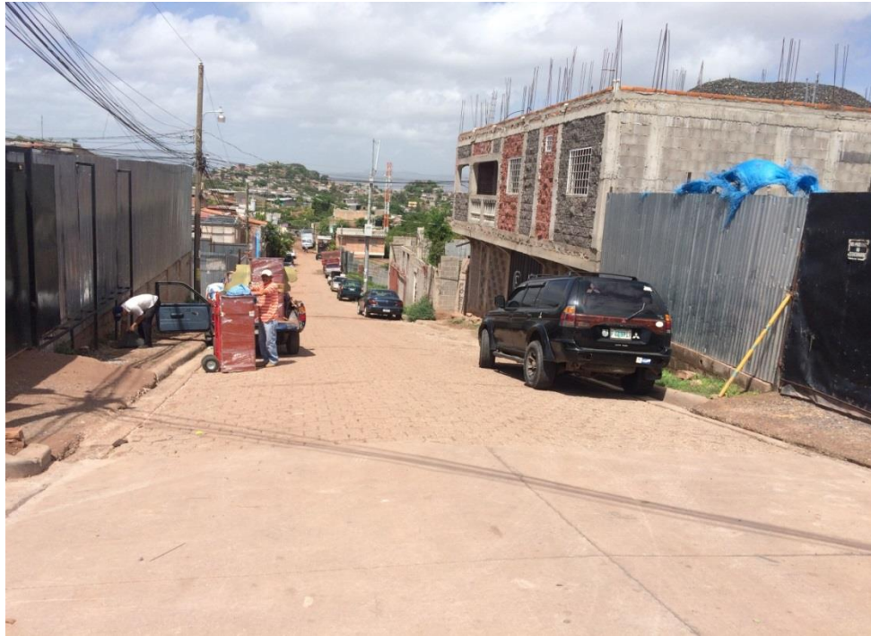
VISTA DEL INICIO DEL TRAMO 3

Proyecto: Pavimentación de calle con concreto hidráulico, col. Santa María Código: 1303