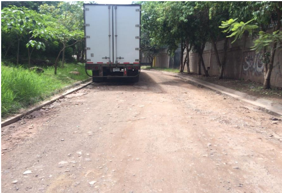
VISTA DEL FINAL DEL TRAMO 2 E INICIO DEL TRAMO 1