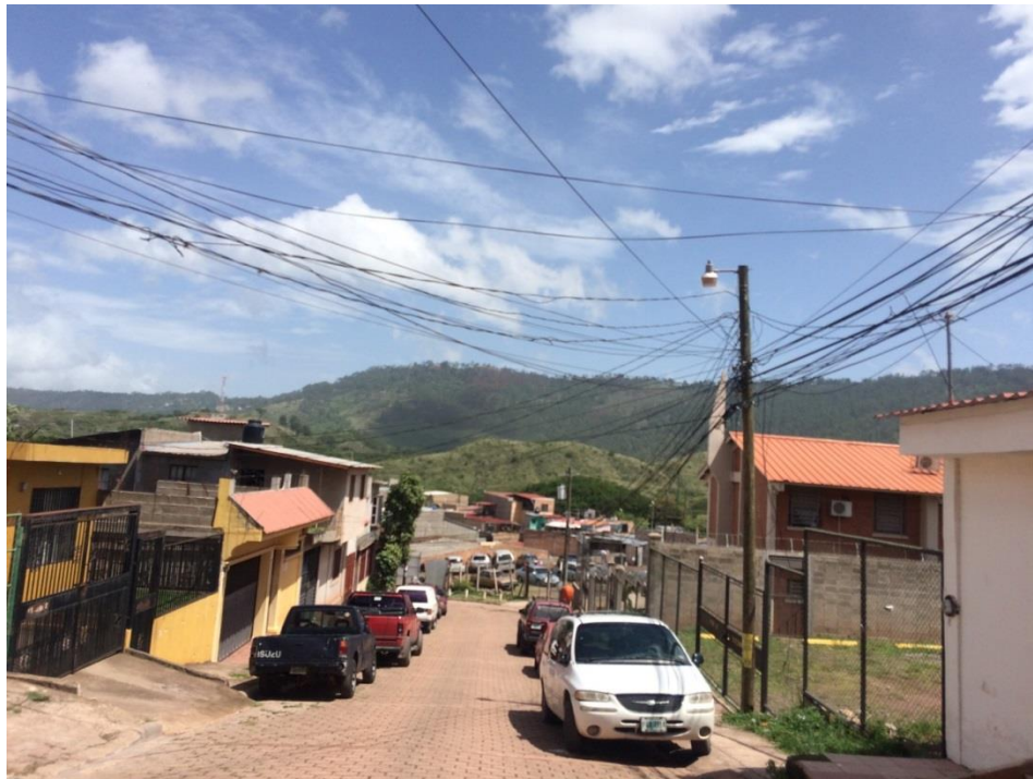
FINAL DEL TRAMO 3