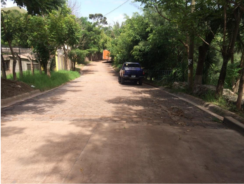
INICIO DE LA CALLE A PAVIMENTAR TRAMO 2

Proyecto: Pavimentación de calle con concreto hidráulico, col. Santa María Código: 1303