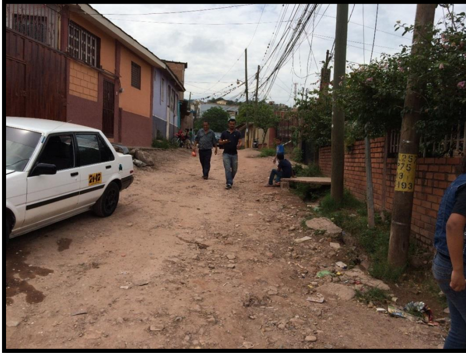
VISTA DEL MAL ESTADO DE LAS CALLES

Proyecto: Pavimentación de calle con concreto hidráulico, col. La Travesía, calle Paseo Cerro de Plata Código: 1234