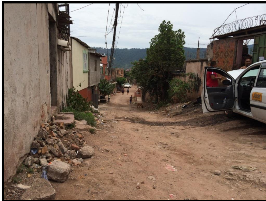
TRAMO FINAL DE LA PAVIMENTACIÓN