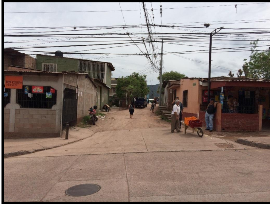
VISTA DEL INICIO DE LA CALLE A PAVIMENTAR

Proyecto: Pavimentación de calle con concreto hidráulico, col. La Travesía, calle Paseo Cerro de Plata Código: 1234