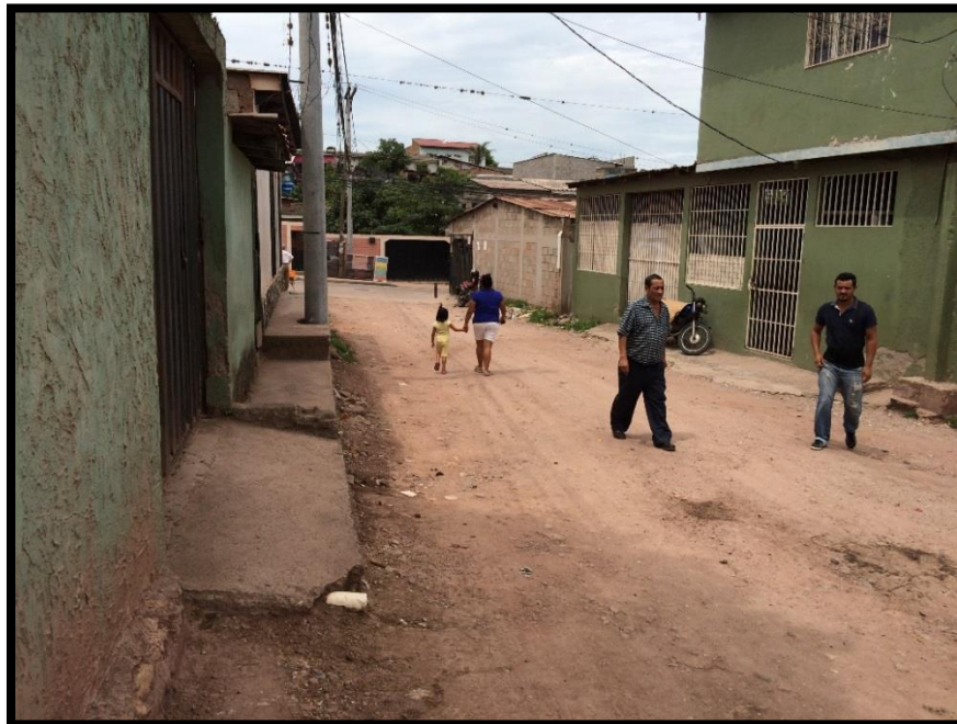
VISTA DEL TRAMO A PAVIMENTAR