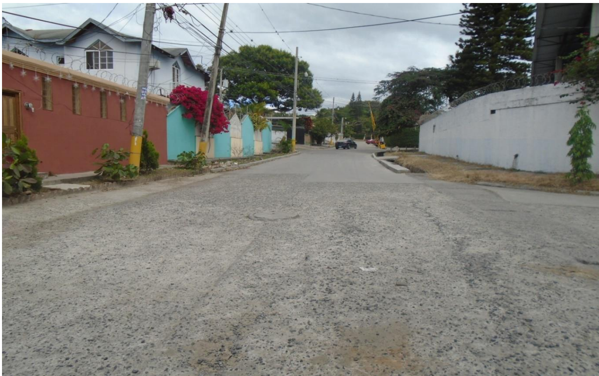
VISTA DE LA CALLE A PAVIMENTAR SOBRE LA LOSA EXISTENTE