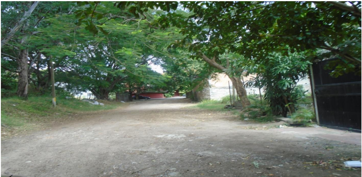
PANORAMA DE CALLE A PAVIMENTAR CON CONCRETO HIDRAULICO