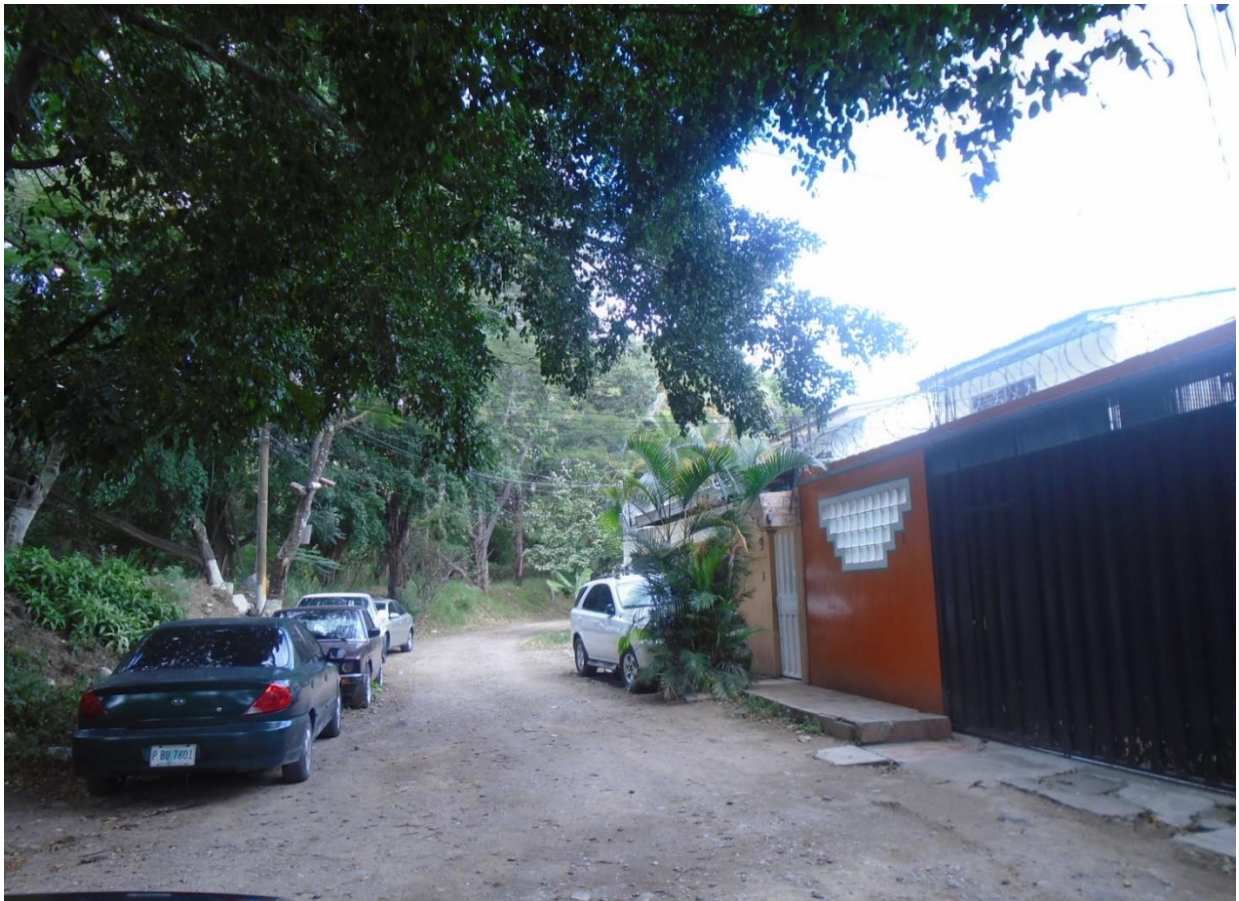
CALLE A PAVIMENTAR CON CONCRETO HIDRAULICO

Proyecto: Pavimentación de calle con concreto hidráulico, en col. Mayangle calle principal Código: 1545