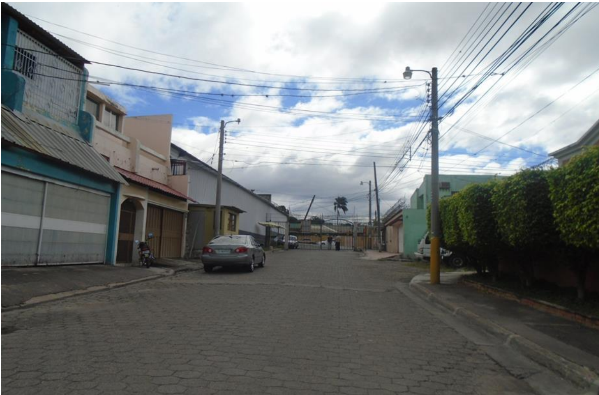
VISTA DE LA CALLE A PAVIMENTAR CON CONCRETO HIDRÁULICO