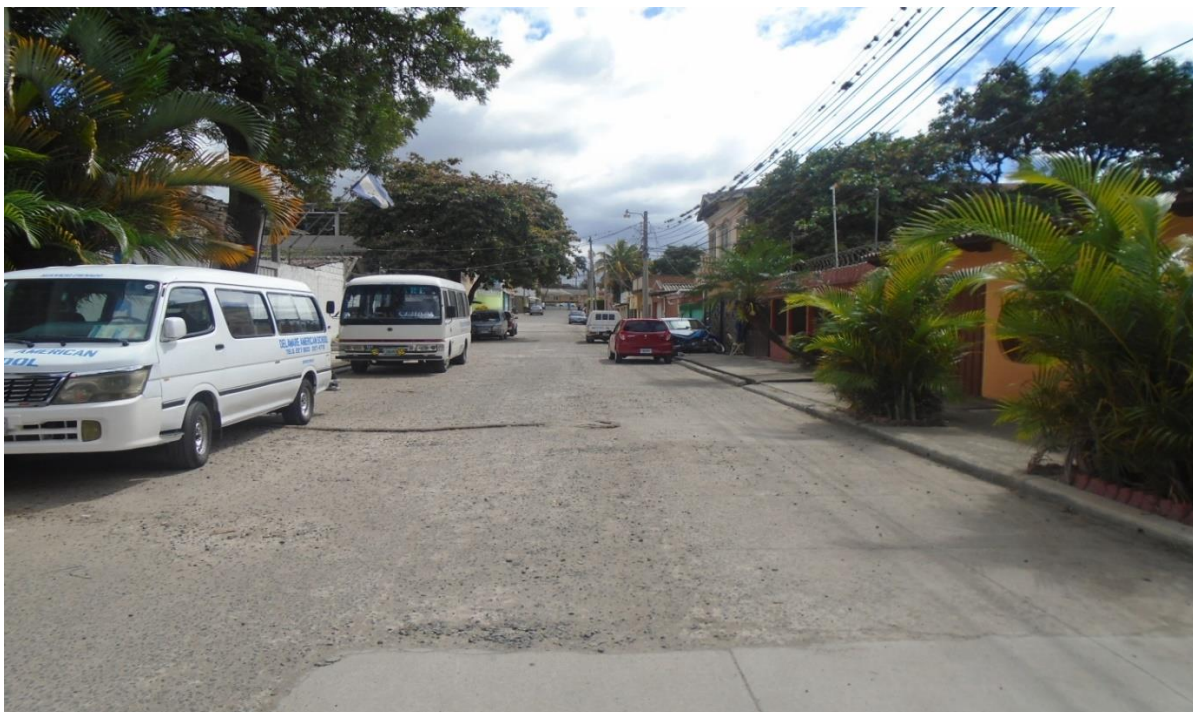
VISTA DE CALLE CON LOSA EXISTENTE EN MAL ESTADO