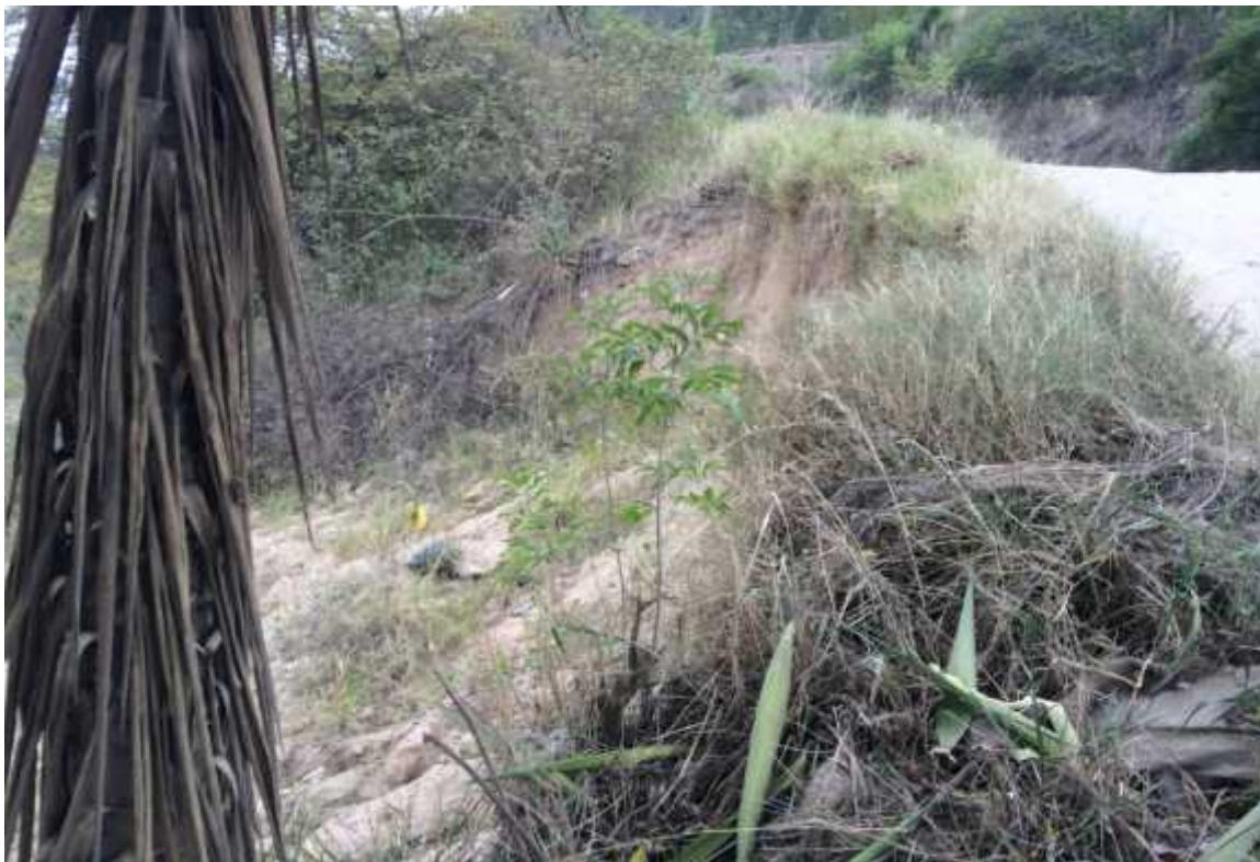
VISTA PANORAMICA DE MURO DE CONTENCION