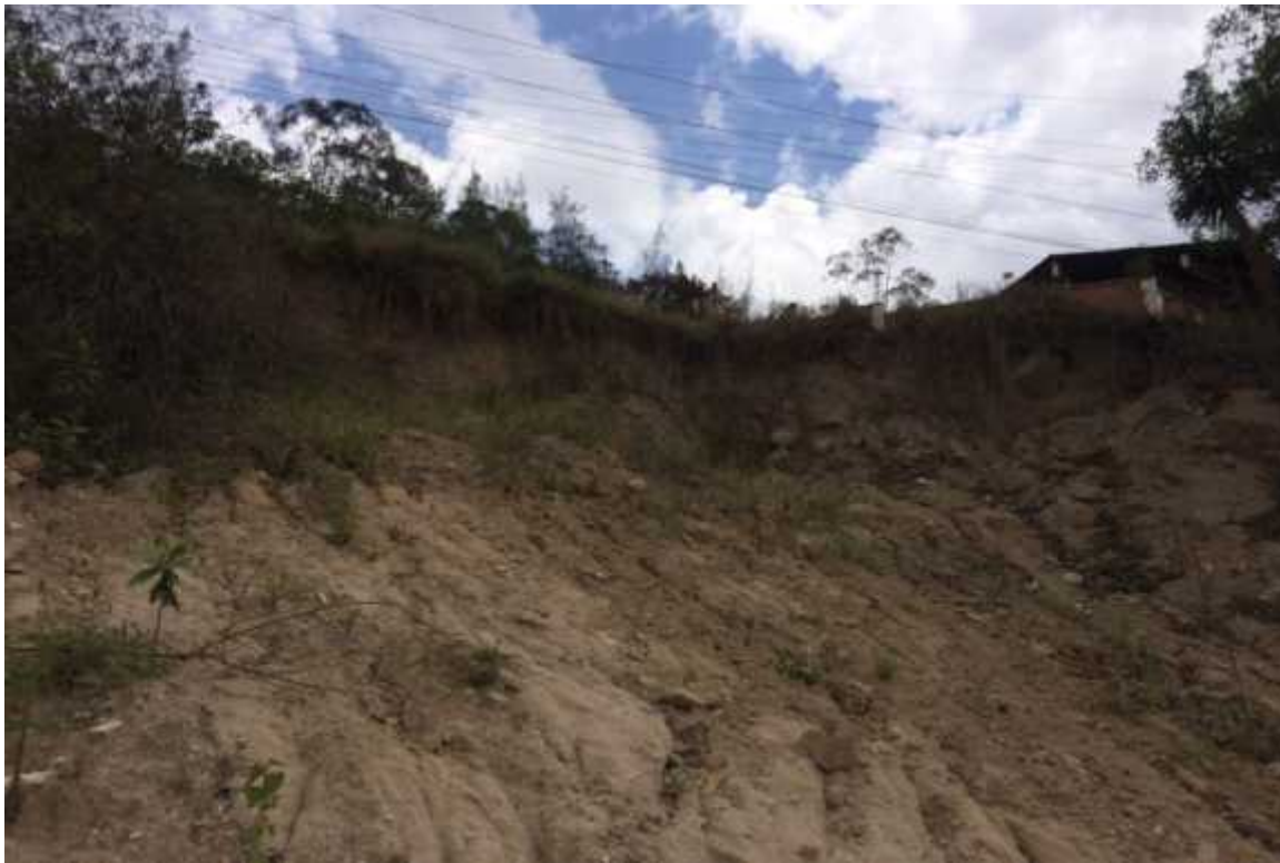
UBICACIÓN DE MURO DE CONTENCIÓN

Colonia Reparto por Arriba, ultima entrada, Km. 4 carretera hacia El Picacho, Tegucigalpa M.D.C.