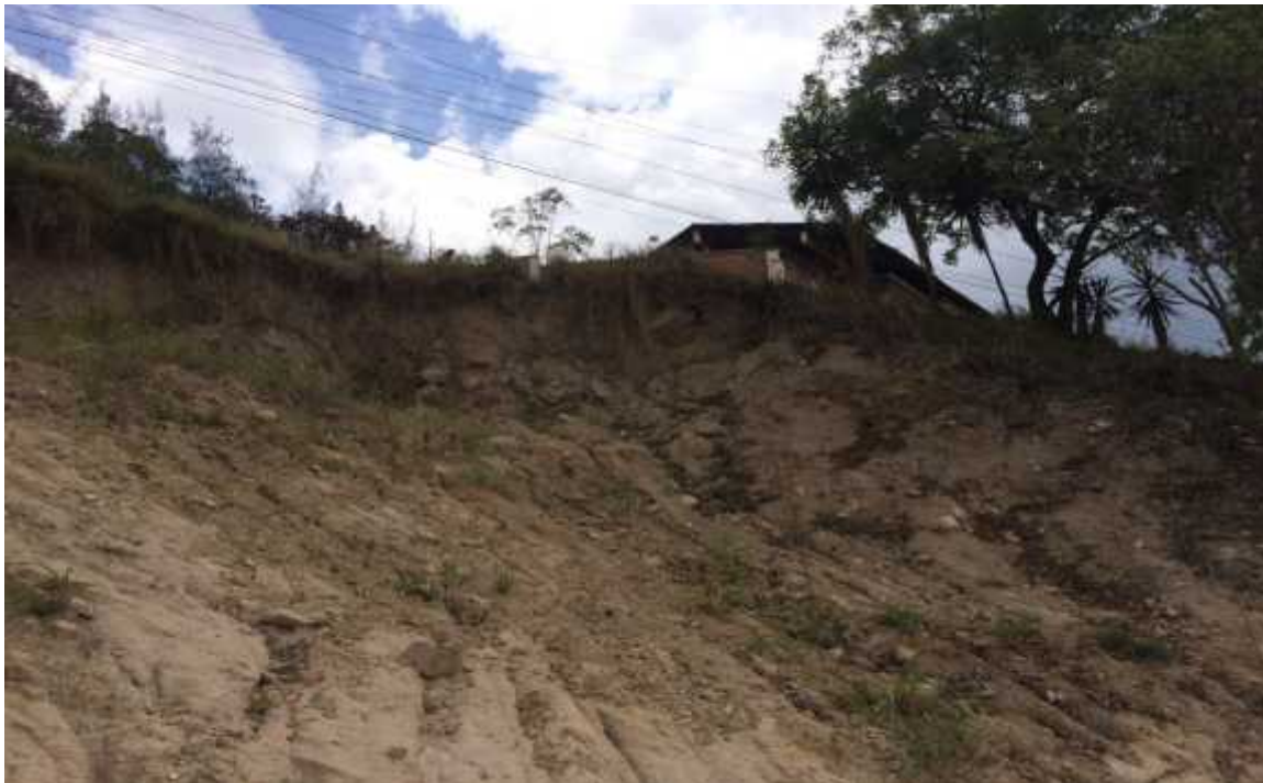
VISTA DE UBICACIÓN DEL MURO