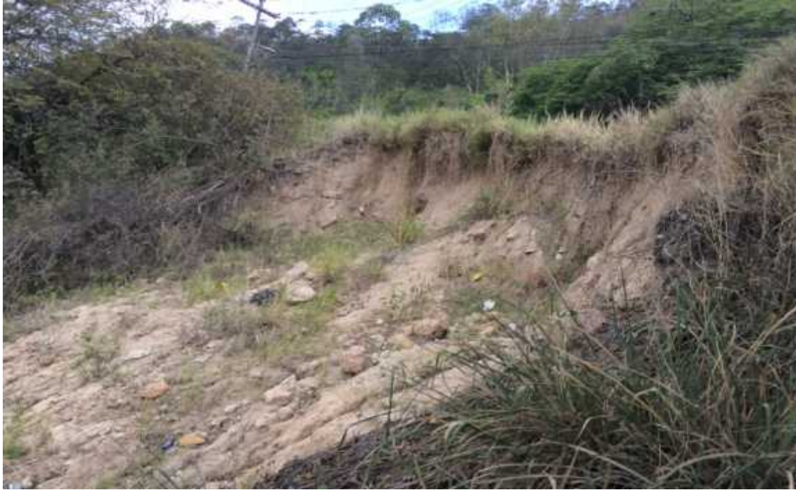
TRAMO A CONSTRUIR EL MURO