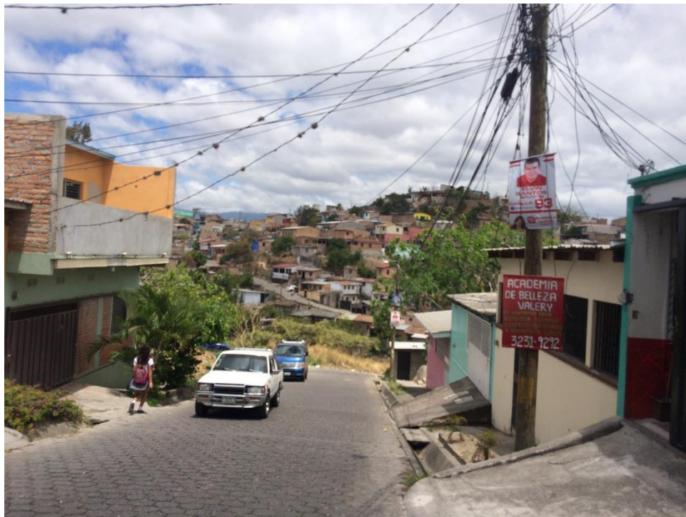
VISTA DEL ESTADO DE LOS ADOQUINES EXISTENTES.