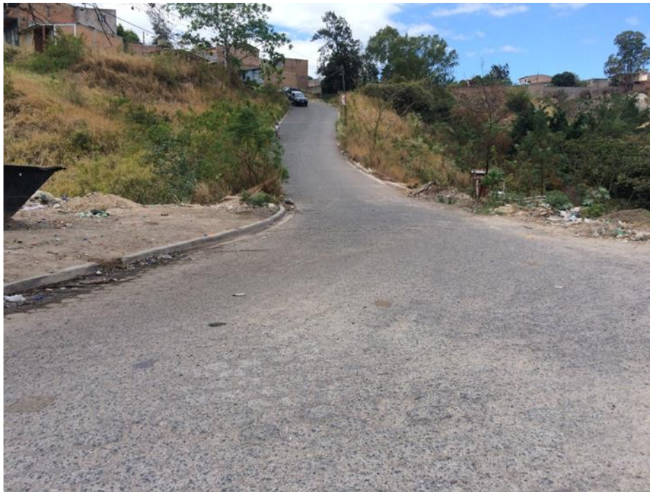
INICIO DE CALLE EN QUE SE DESMONTARÁ ADOQUÍN Y SE PAVIMENTARÁ CON CONCRETO HIDRÁULICO