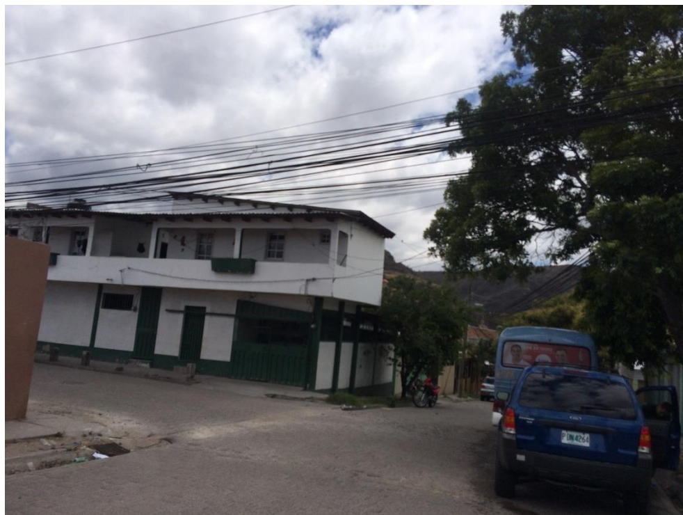
FINAL DE CALLE A PAVIMENTAR CON CONCRETO HIDRÁULICO