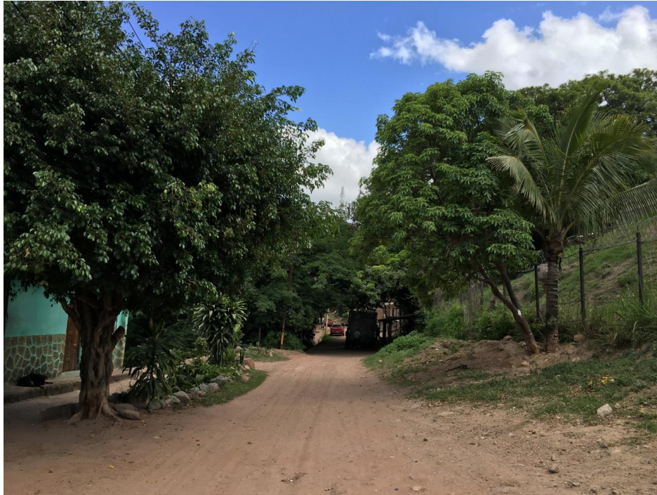
VISTA PANORAMICA DE CALLE A PAVIMENTAR