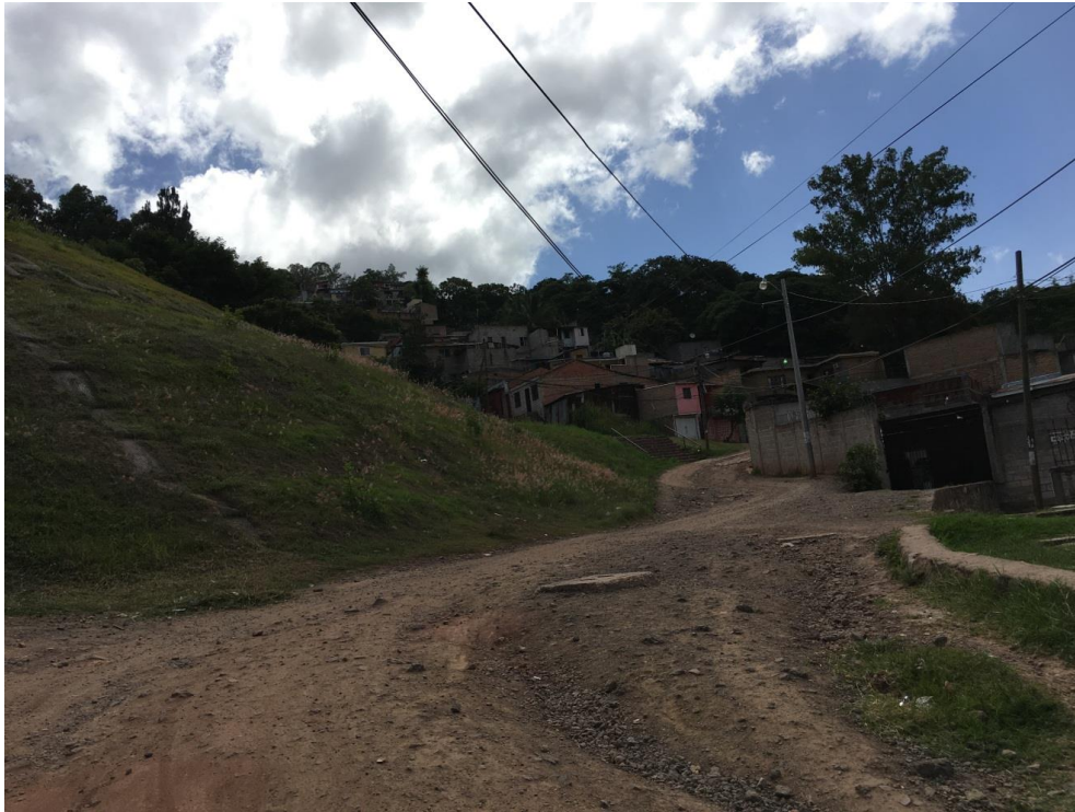
INICIO DE LA CALLE A PAVIMENTAR