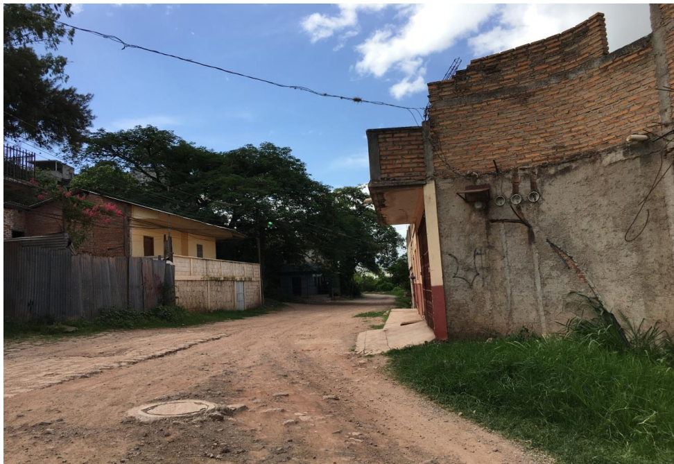
VISTA DE LA CALLE A PAVIMENTAR