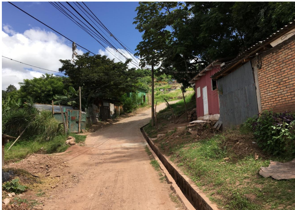
FINAL DEL PROYECTO