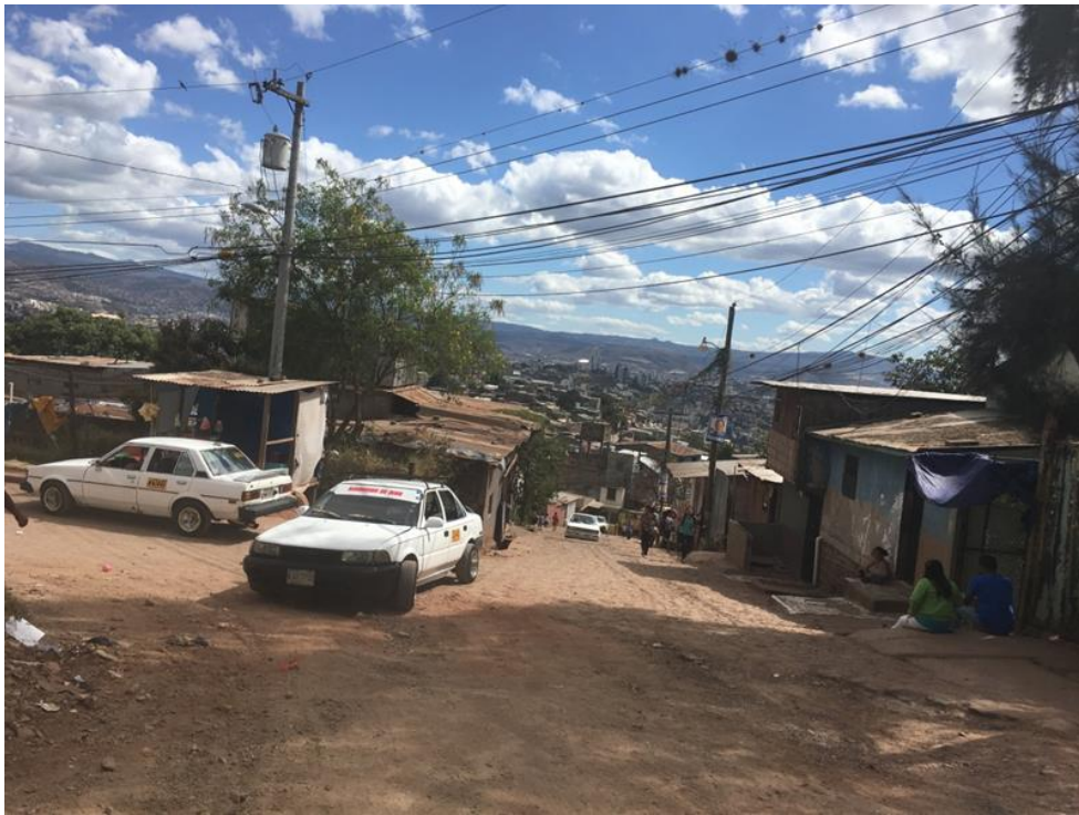
PANORAMA DE LA CALLE A PAVIMENTAR