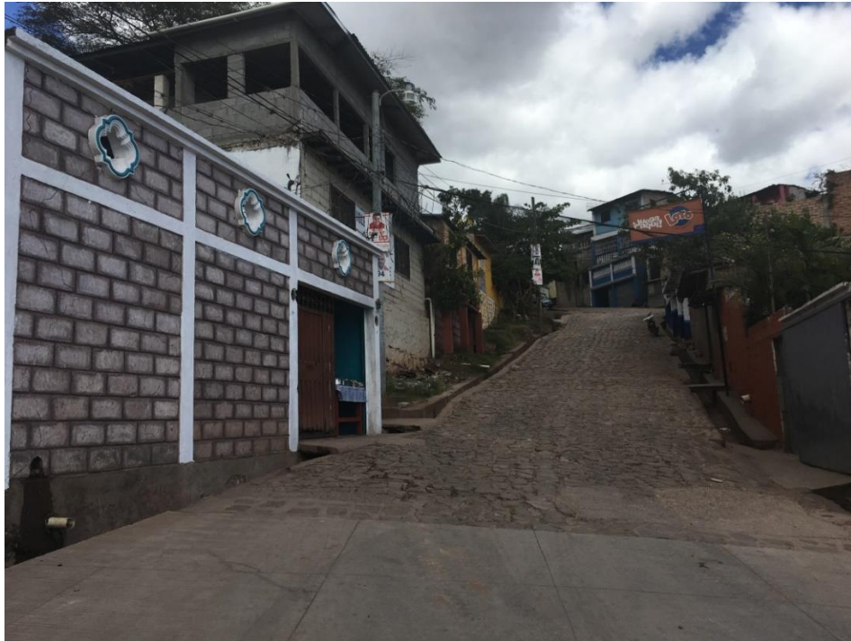
CALLE EN QUE SE DEMOLERÁ EL EMPEDRADO

Proyecto: Pavimentación de calle con concreto hidráulico, col. Guillén, calle principal Código: 1651