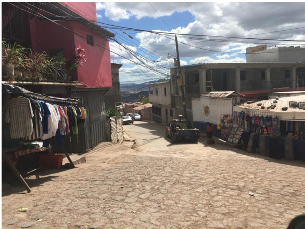
CALLE A PAVIMENTAR CON CONCRETO HIDRÁULICO