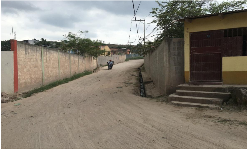
Inicio de la calle a pavimentar

Proyecto: Pavimentación de calle con concreto hidráulico, col. San José de Loarque Código: 1207