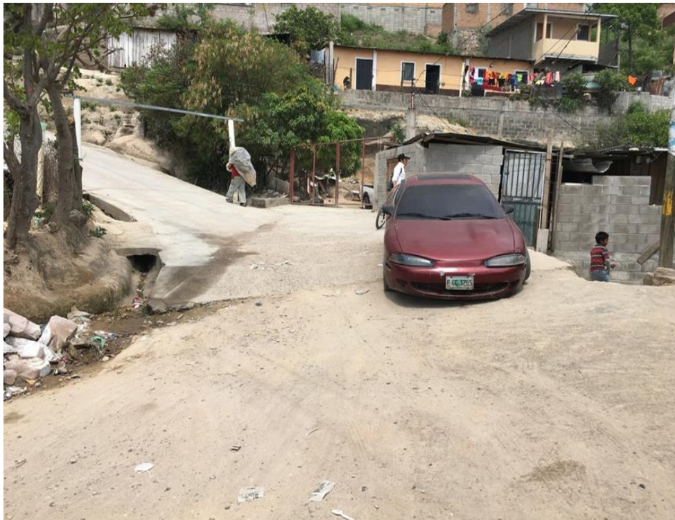
Fin de calle a pavimentar