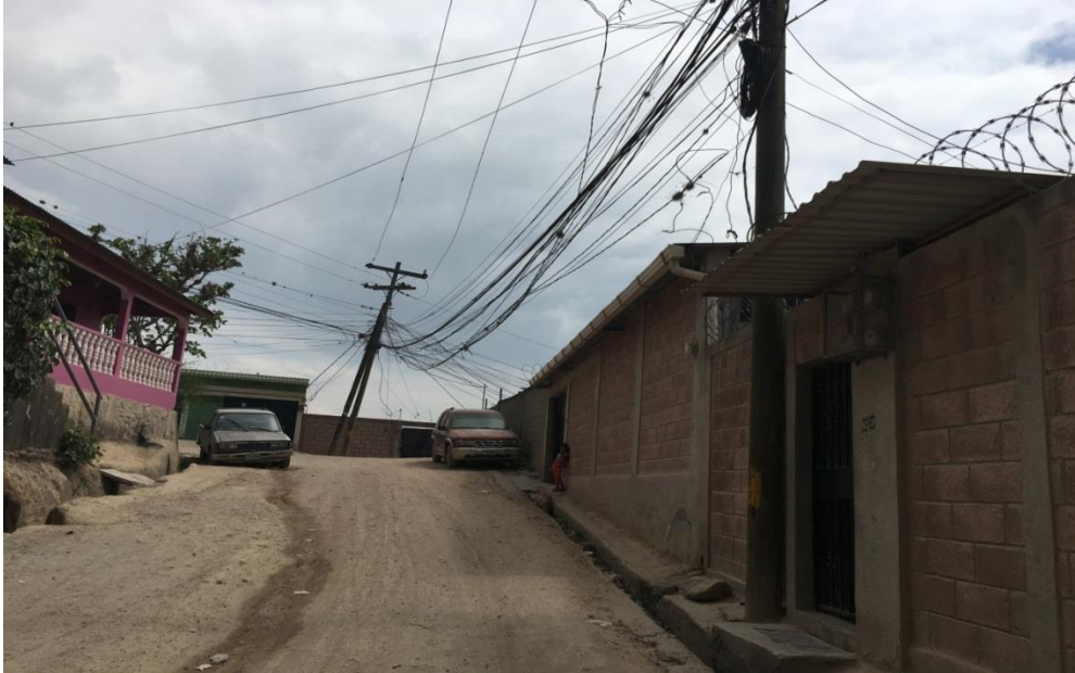
Vista de la calle

Proyecto: Pavimentación de calle con concreto hidráulico, col. San José de Loarque Código: 1207