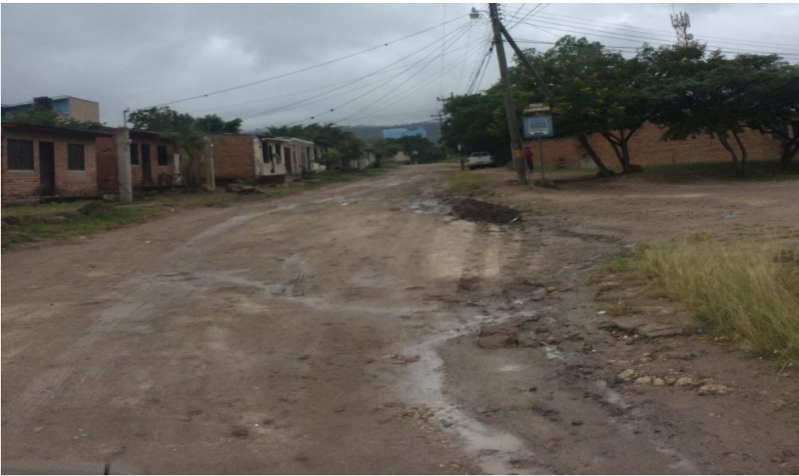
INICIO DE LA CALLE A PAVIMENTAR