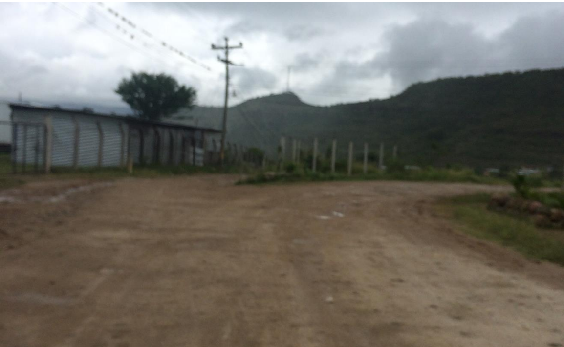
FINAL DEL PROYECTO