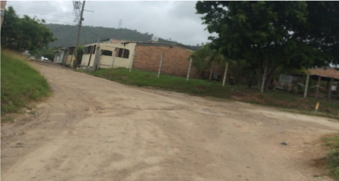
VISTA PANORÁMICA DE LA CALLE A PAVIMENTAR