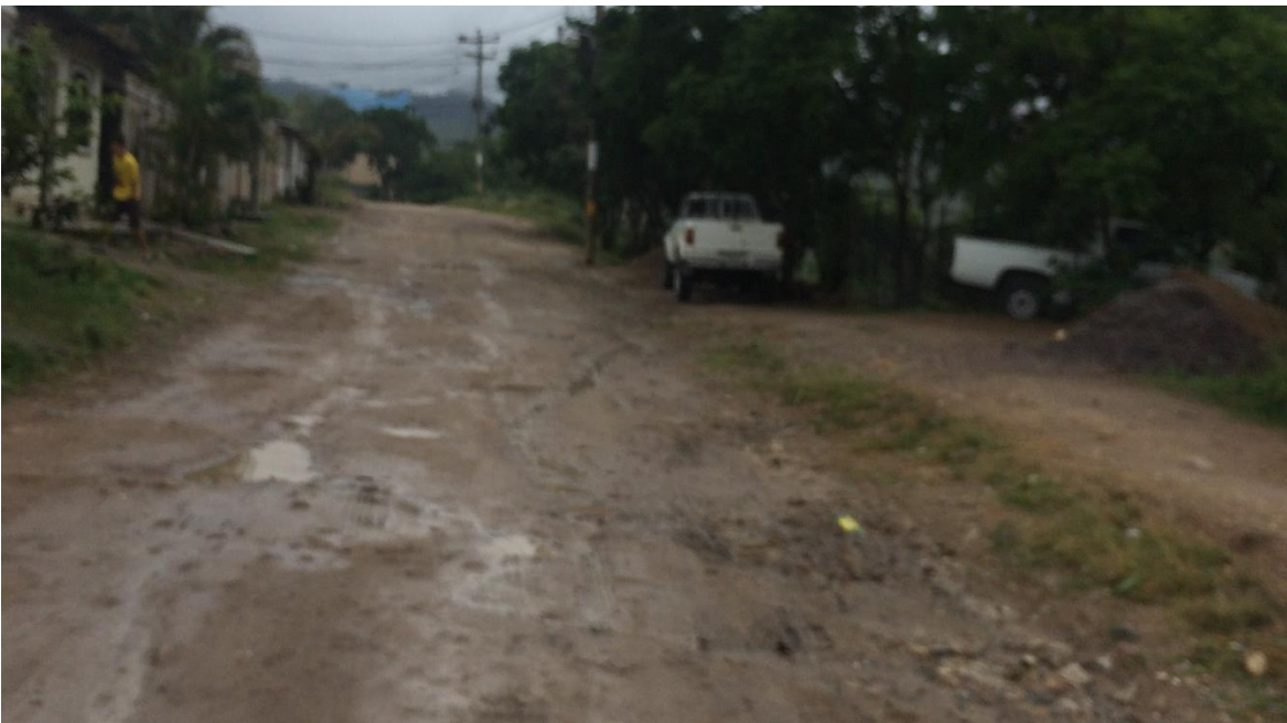
VISTA DE LA CALLE EN MAL ESTADO