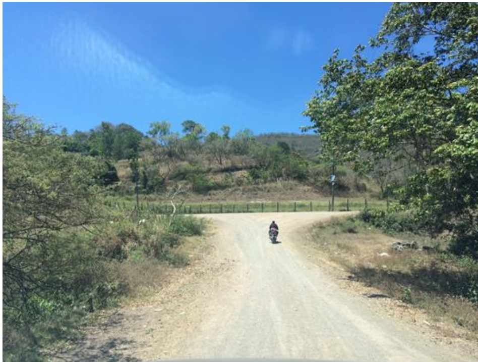
VISTA DEL MAL ESTADO DE LA CALLE

Proyecto: Conformación y balastado de calles, aldea Santa Cruz de Soroguara-El Guayabo Código: 1724