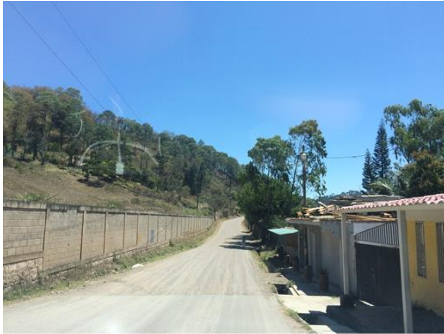
INICIO DE CALLE