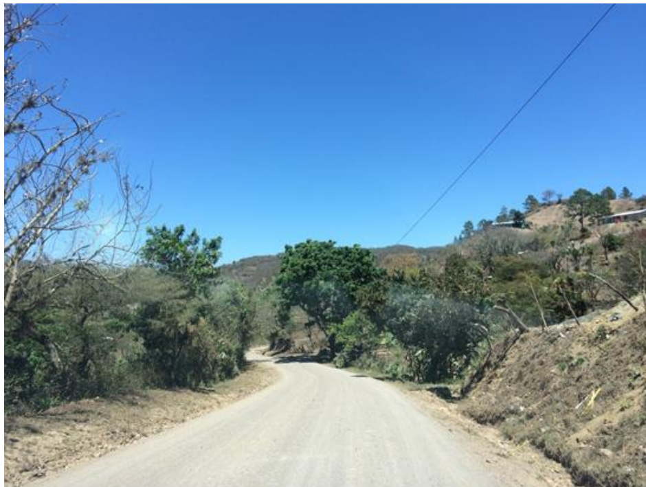
FINAL DE CALLE