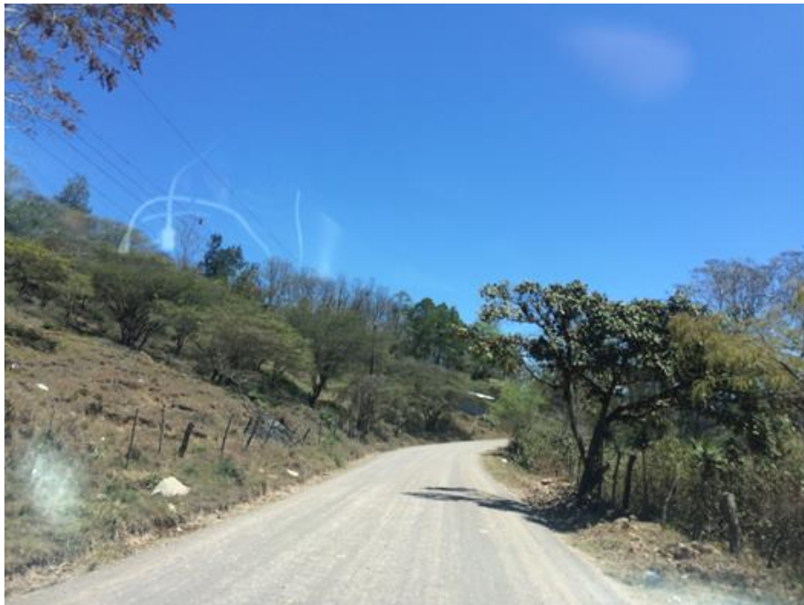
VISTA PANORAMICA DE LA CALLE A REPARAR