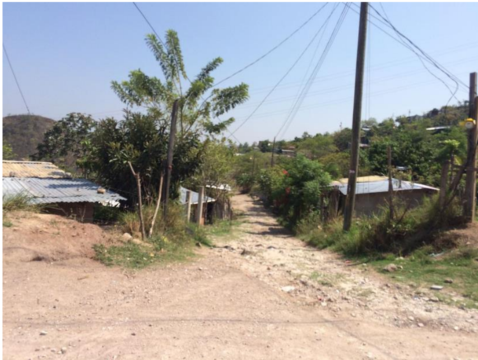
Se observa el deterioro de una de las calles al interior de la colonia