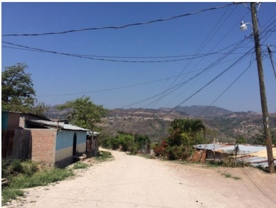
Condiciones actuales de otro sector de la calle principal