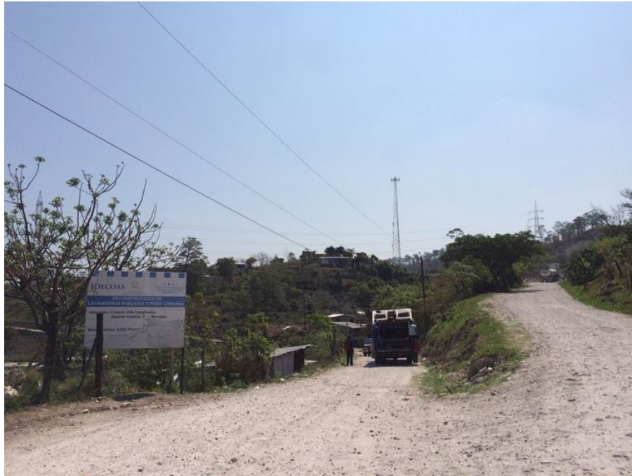
Condiciones actuales de calle principal de Villa Campesina