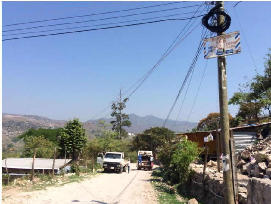
Vista de otro tramo de calle que requiere conformado y balastado.