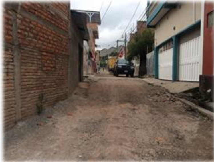
VISTA DE CALLE A PAVIMENTAR CON CONCRETO HIDRAULICO