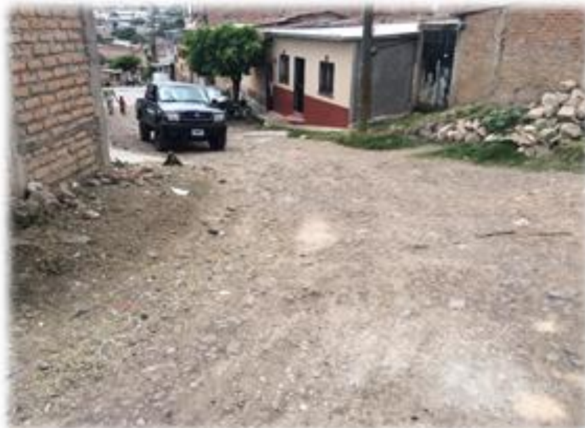
VISTA DE CALLE A PAVIMENTAR CON CONCRETO HIDRAULICO.