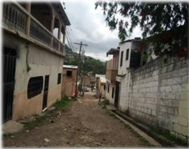
VISTA DEL ESTADO DE LA CALLE A PAVIMENTAR.