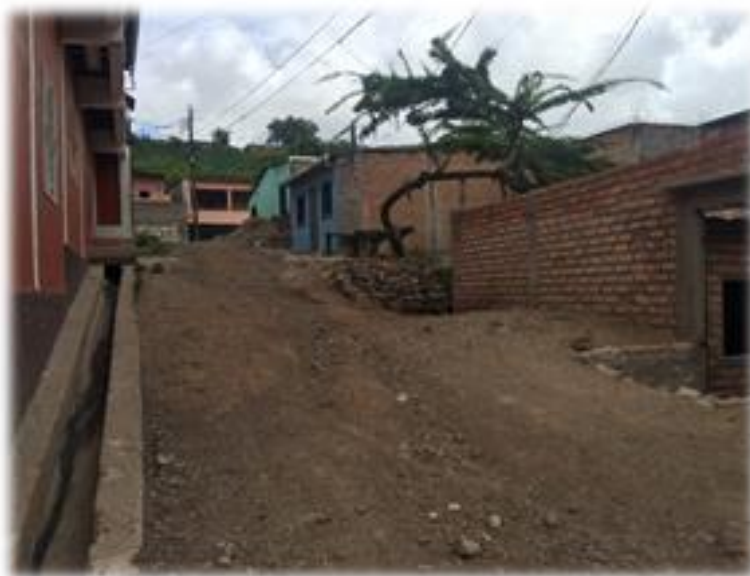
VISTA DE CALLE A PAVIMENTAR CON CONCRETO HIDRAULICO.