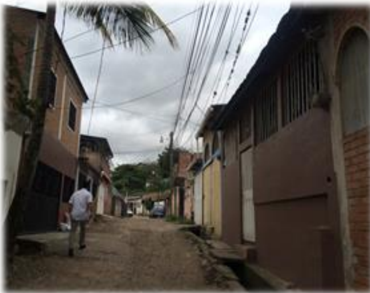
FINAL DE PAVIMENTO CON CONCRETO HIDRAULICO.