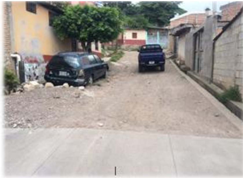
INICIO DE PAVIMENTACION CON CONCRETO HIDRAULICO.