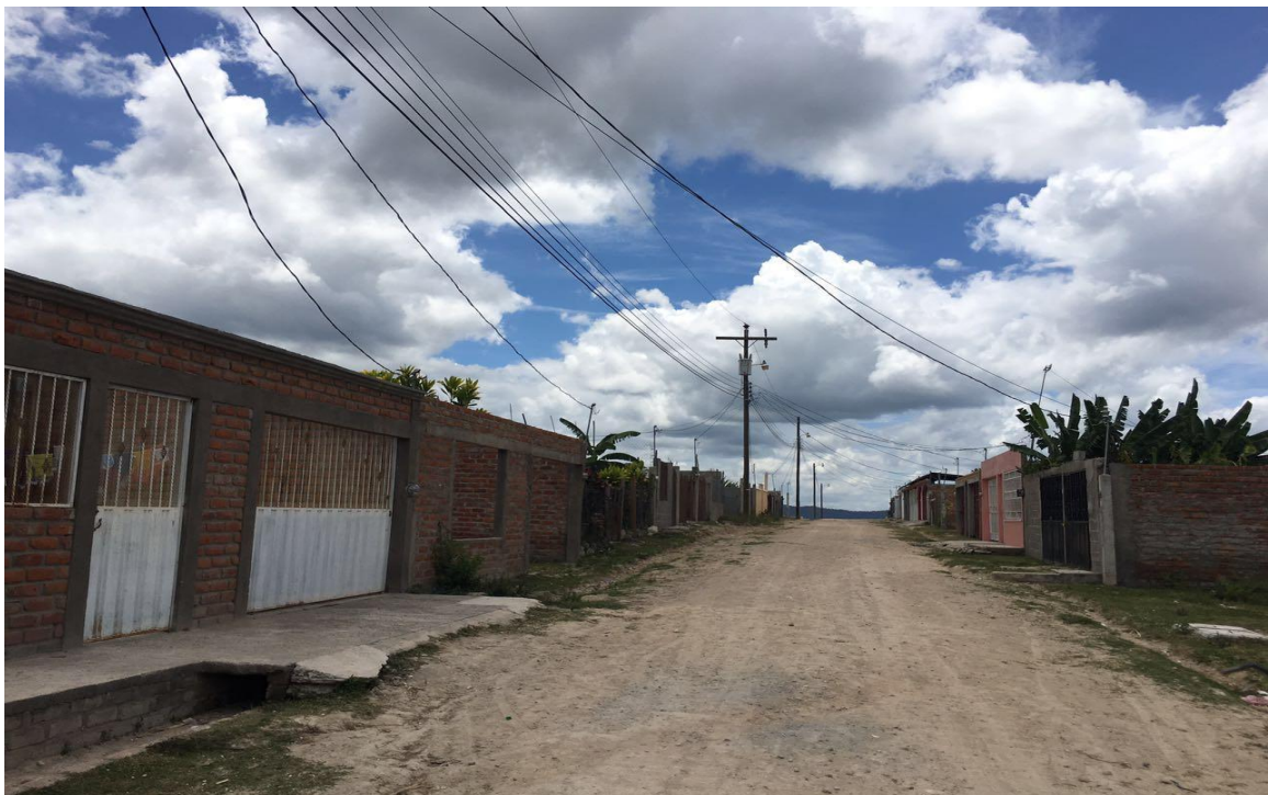
VISTA DE LA CALLE EN MAL ESTADO