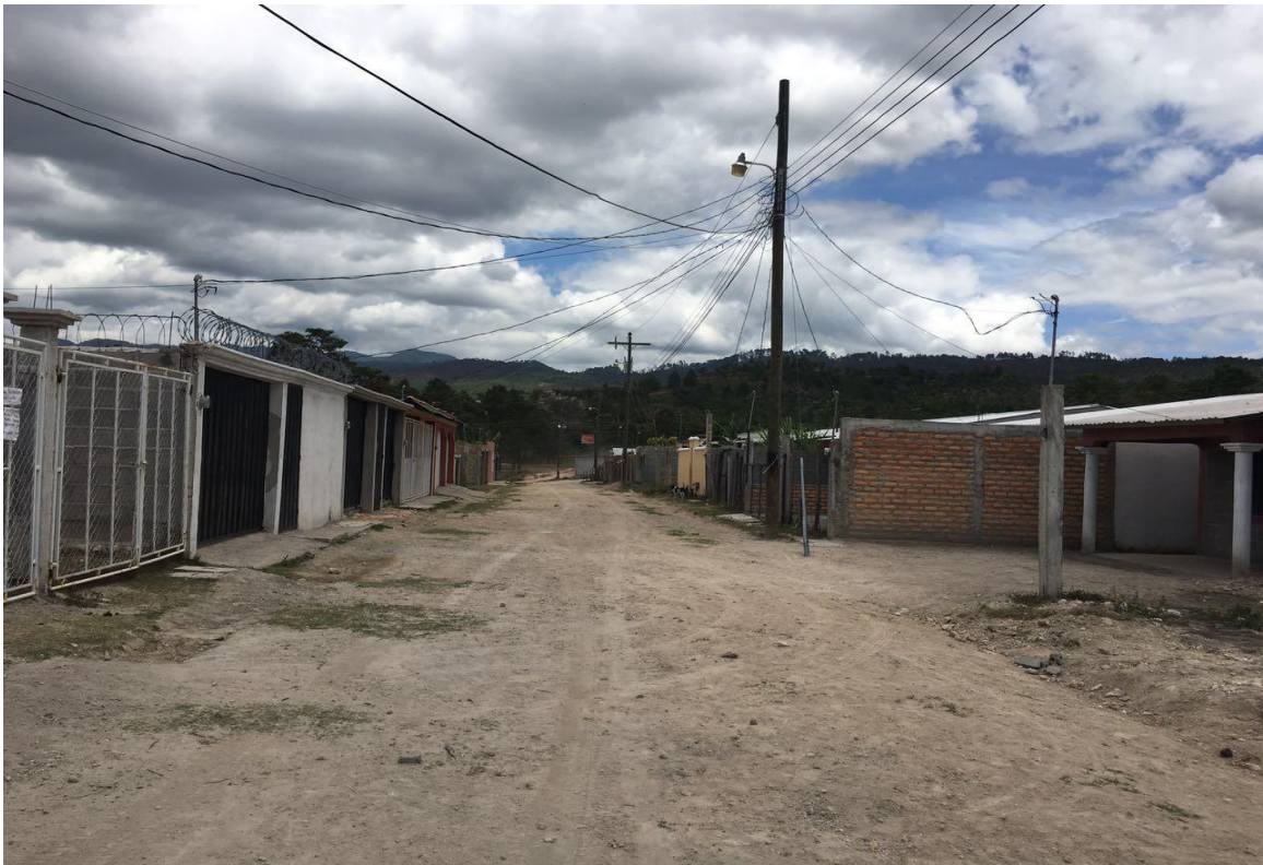
VISTA DE LA CALLE NO. 1