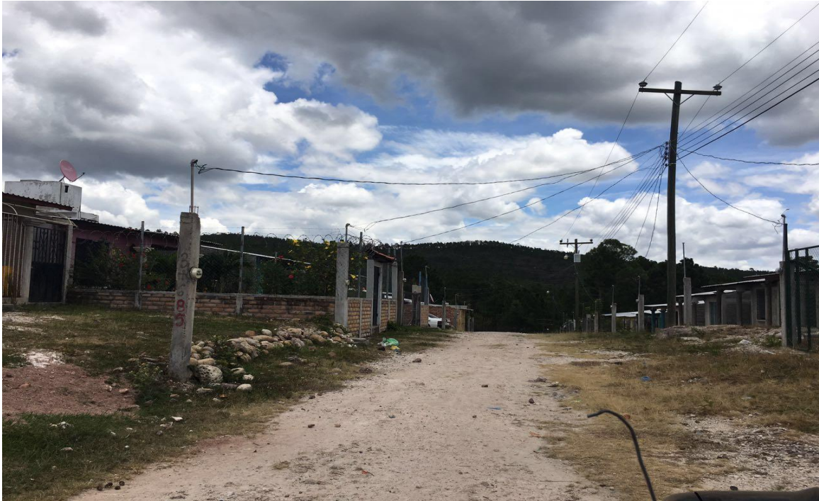
VISTA DE LA CALLE NO. 3