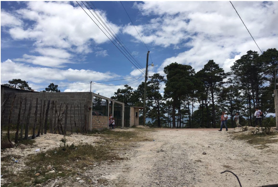
VISTA PANORAMICA DE LA CALLE NO. 2