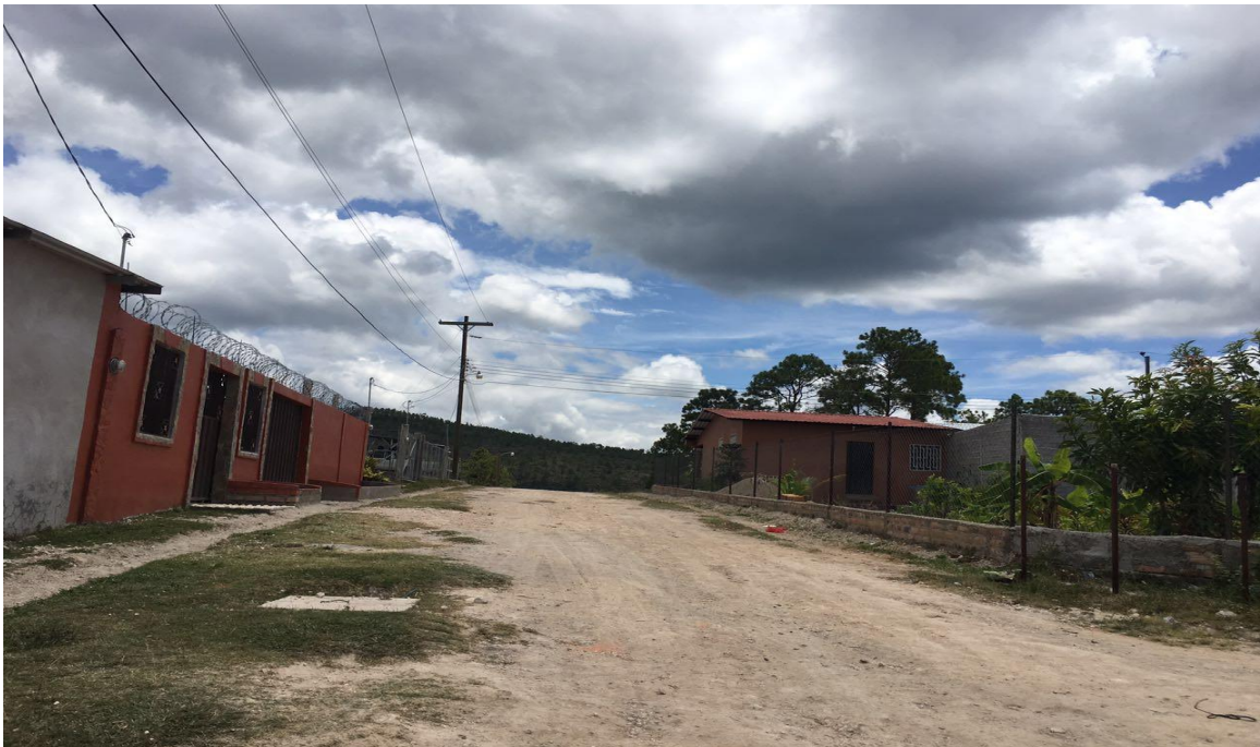
FINAL DEL PROYECTO