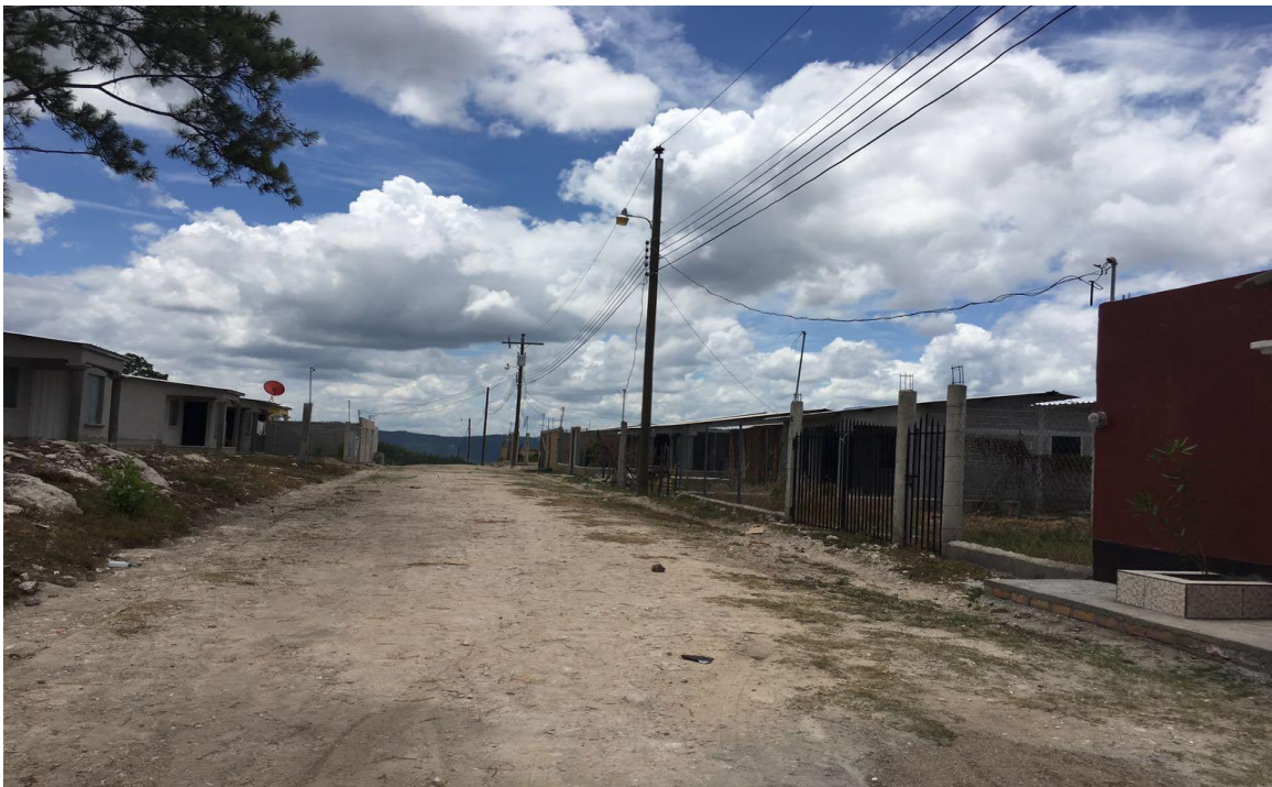
VISTA PANORAMICA DE LA CALLE A PAVIMENTAR