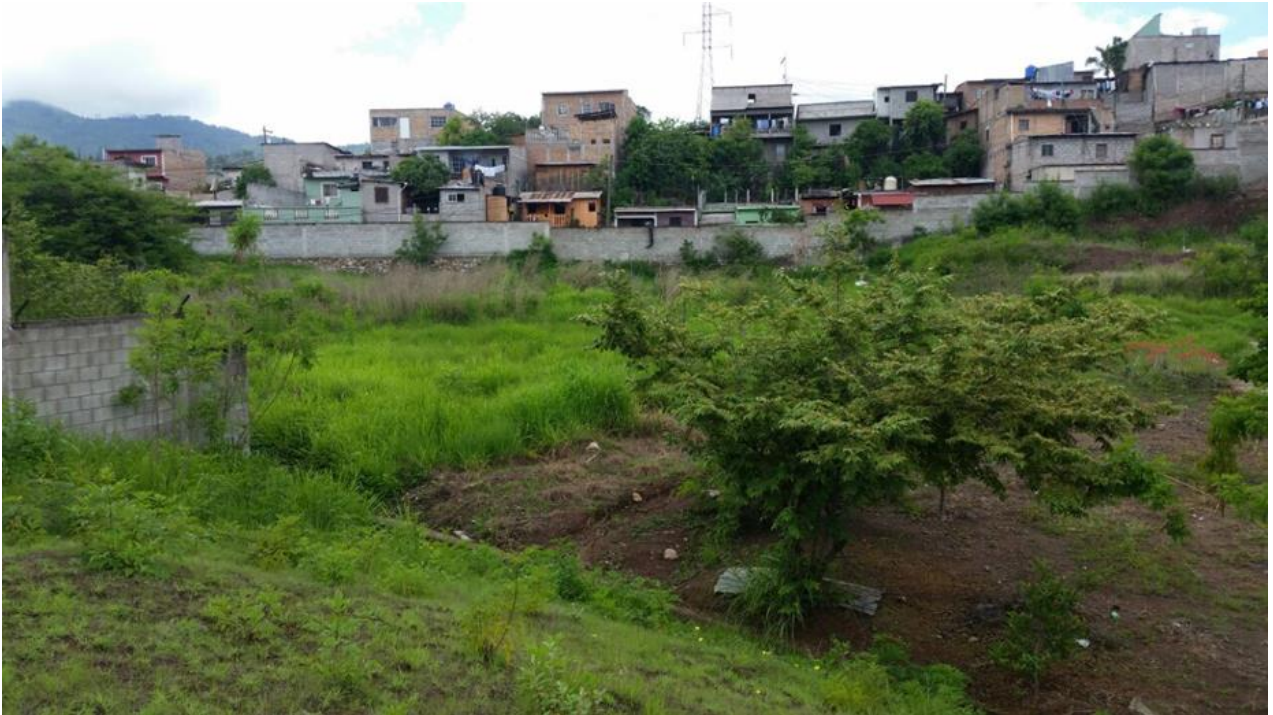
Foto No. 3: Lugar donde se removerá la capa vegetal para construir la cancha