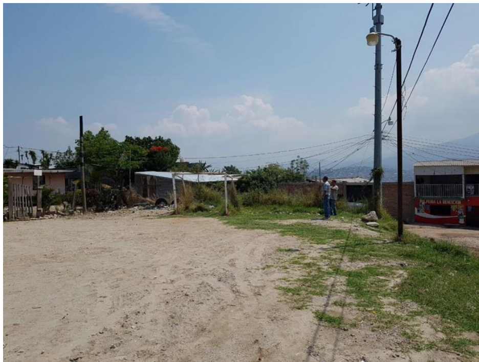
Foto No. 6: Vista donde se construirá la cancha en Villa Nueva, sector 5