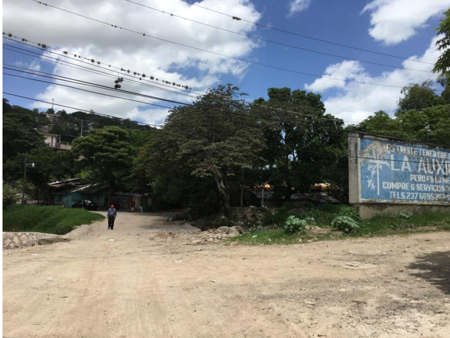
INICIO DEL TRAMO NO.1

Proyecto: Pavimentación de calle con concreto hidráulico, colonia Vegas del Country Código: 1290