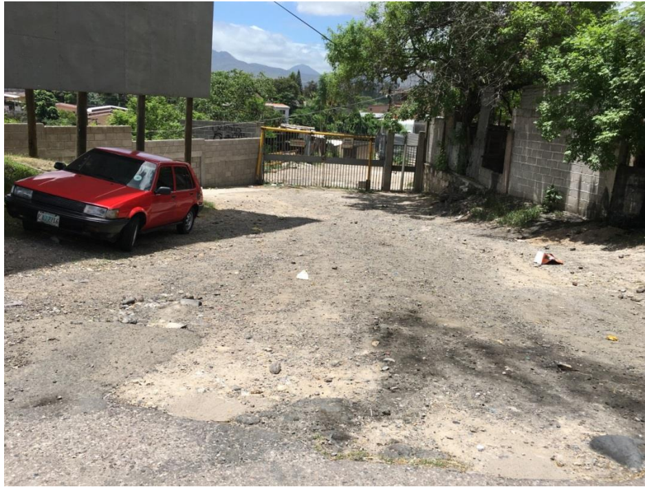
INICIO DEL TRAMO NO. 2

Proyecto: Pavimentación de calle con concreto hidráulico, colonia Vegas del Country Código: 1290