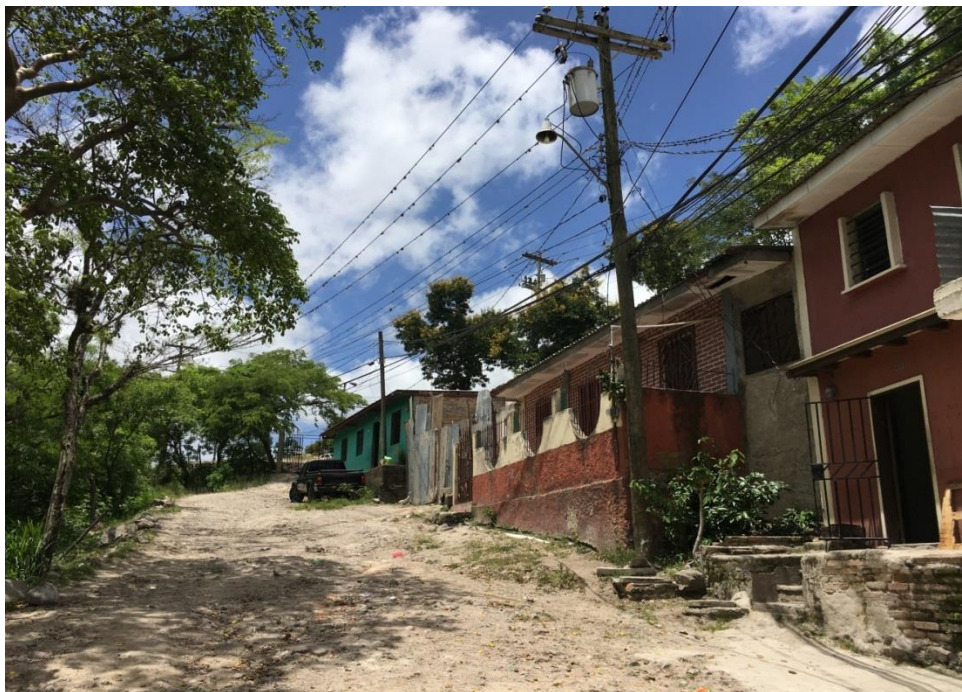
FINAL DEL TRAMO NO. 1