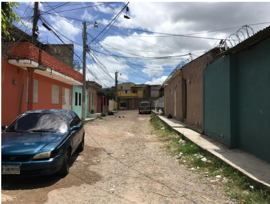
FINAL DEL TRAMO NO.3