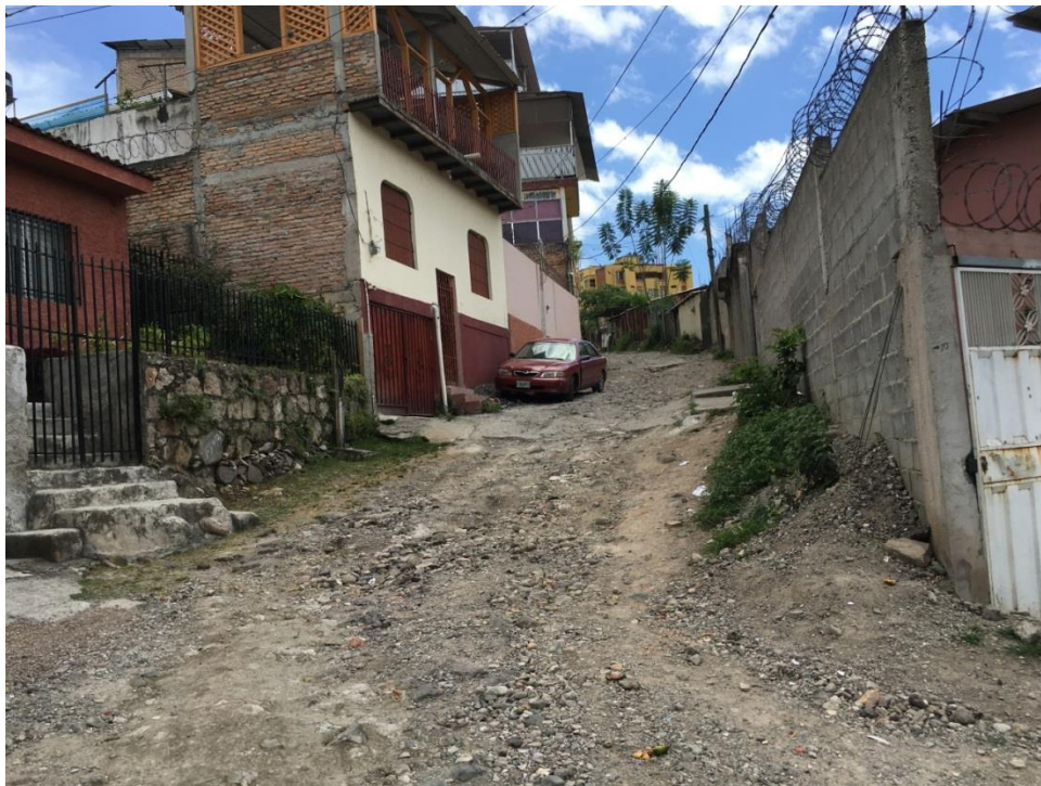
FINAL DEL TRAMO NO.2