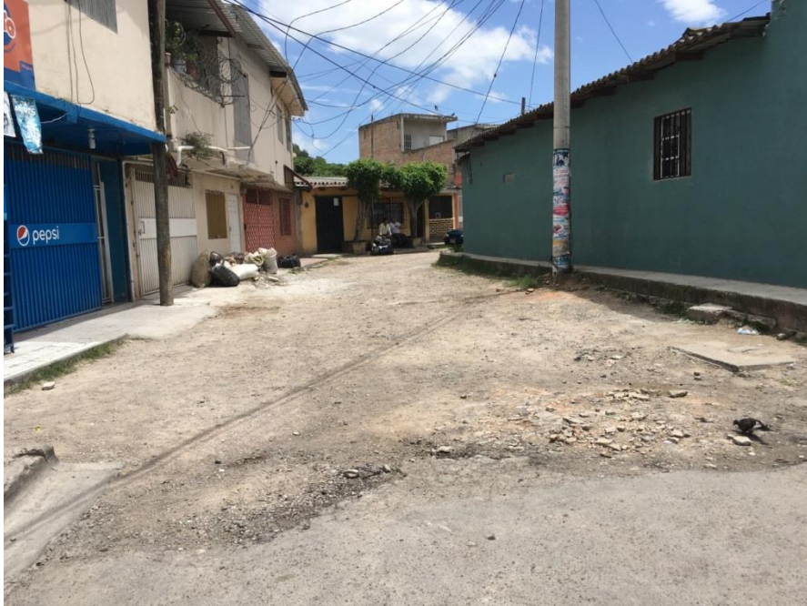
INICIO DEL TRAMO NO. 3

Proyecto: Pavimentación de calle con concreto hidráulico, colonia Vegas del Country Código: 1290