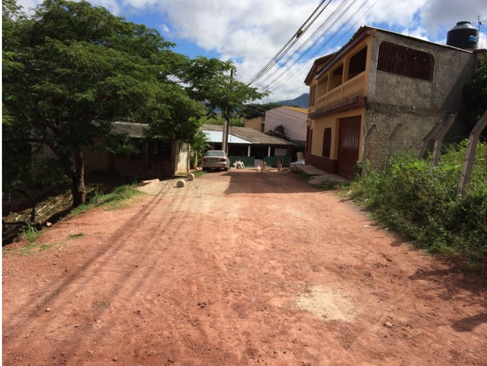
VISTA PANORAMICA DE CALLE A PAVIMENTAR