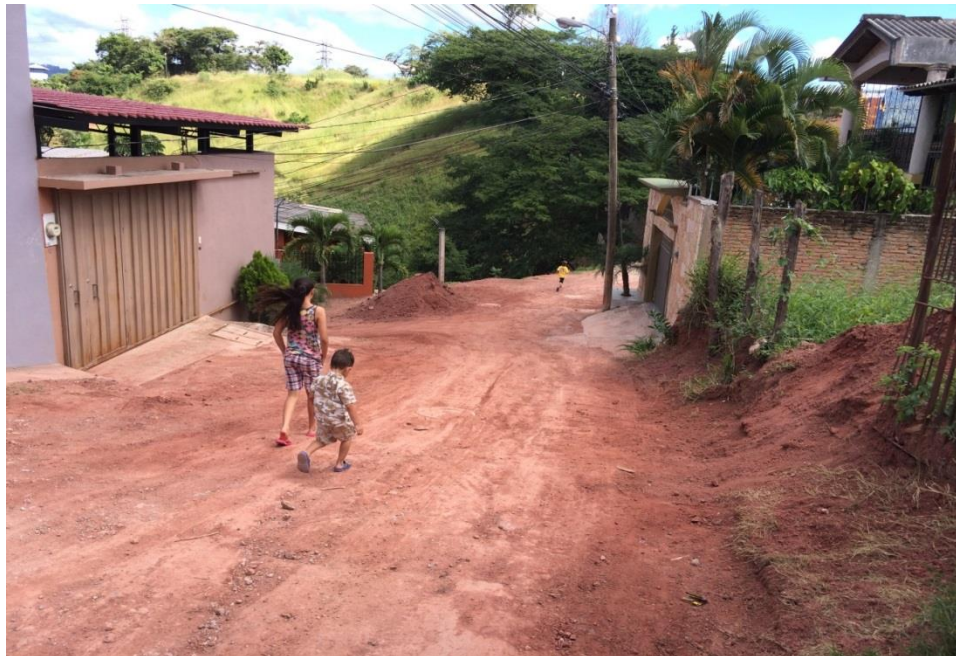
TRAMO DE CALLE A PAVIMENTAR EN COL. ALTOS DE LA JOYA