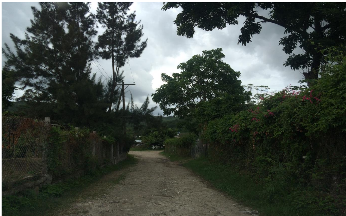
VISTA PANORAMICA DEL TRAMO A REPARAR