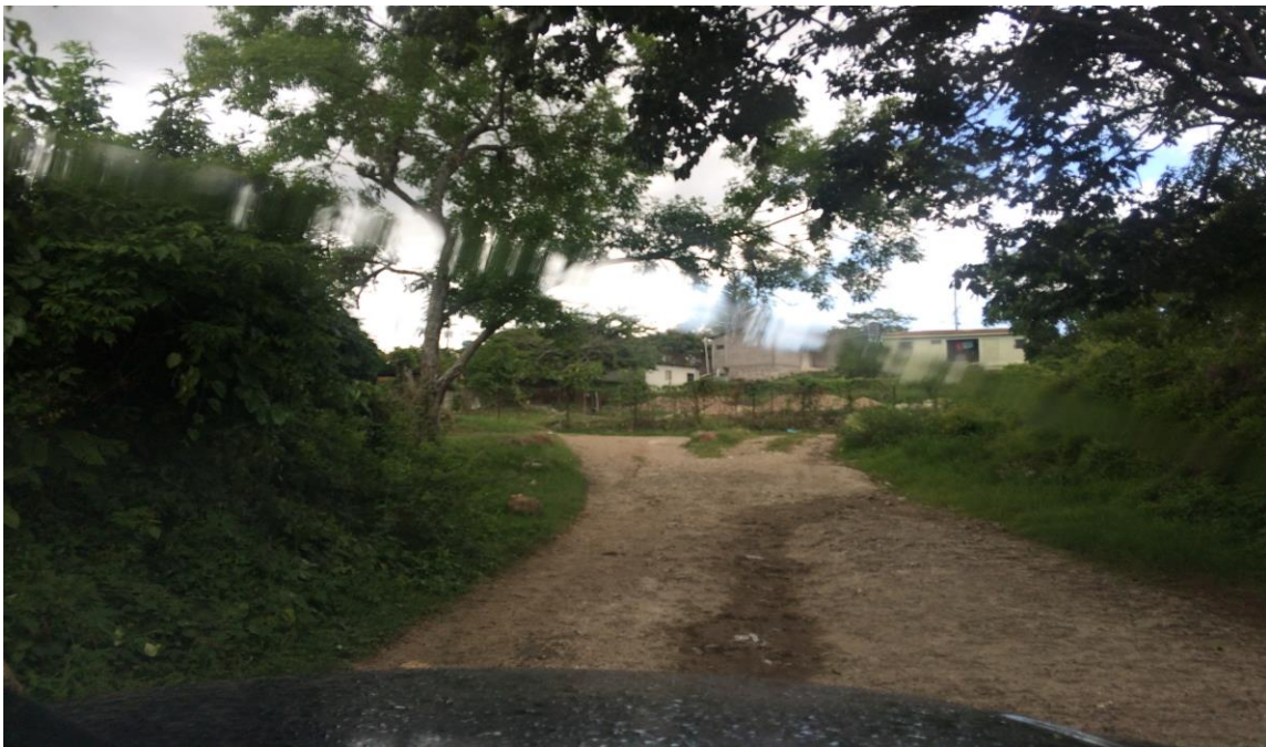
OTRA VISTA DEL TRAMO A REPARAR