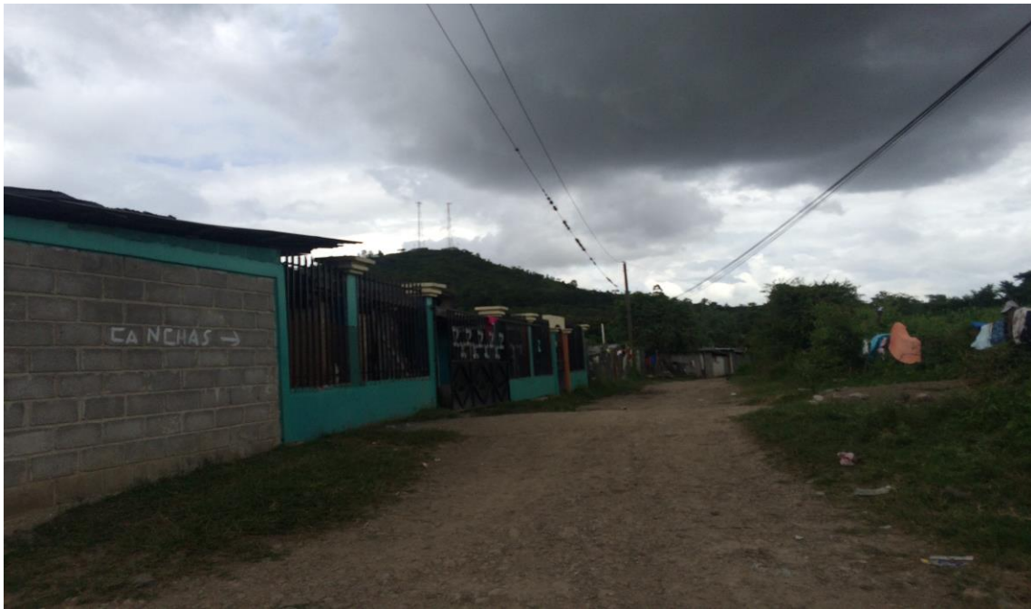
VISTA DEL MAL ESTADO DEL ACCESO A CIUDAD MATEO

Proyecto: Conformación y balastado de calles, y construcción de cunetas, aldea Las Tapias Código: 1257