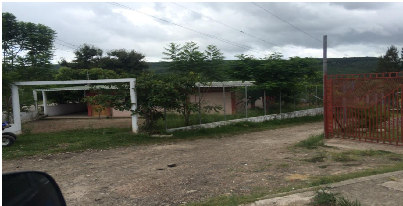
INICIO DE CALLE A CONFORMAR