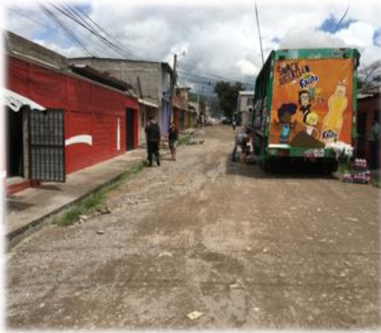
INICIO DE PAVIMENTACIÓN CON CONCRETO HIDRÁULICO.

Proyecto: Pavimentación de calle con concreto hidráulico, colonia Las Torres, sector 1 Código: 1262