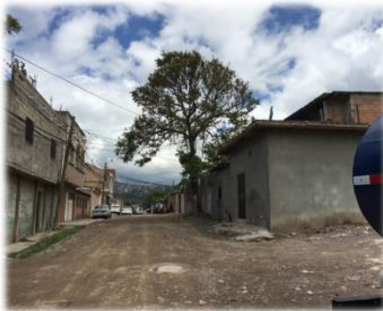
VISTA DE CALLE A PAVIMENTAR CON CONCRETO HIDRÁULICO.