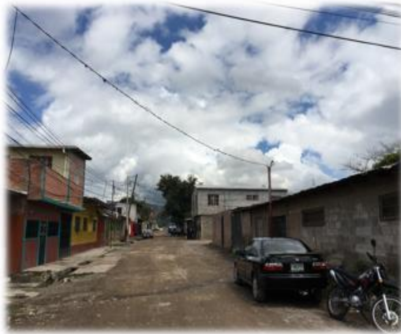
VISTA DE CALLE A PAVIMENTAR CON CONCRETO HIDRÁULICO.