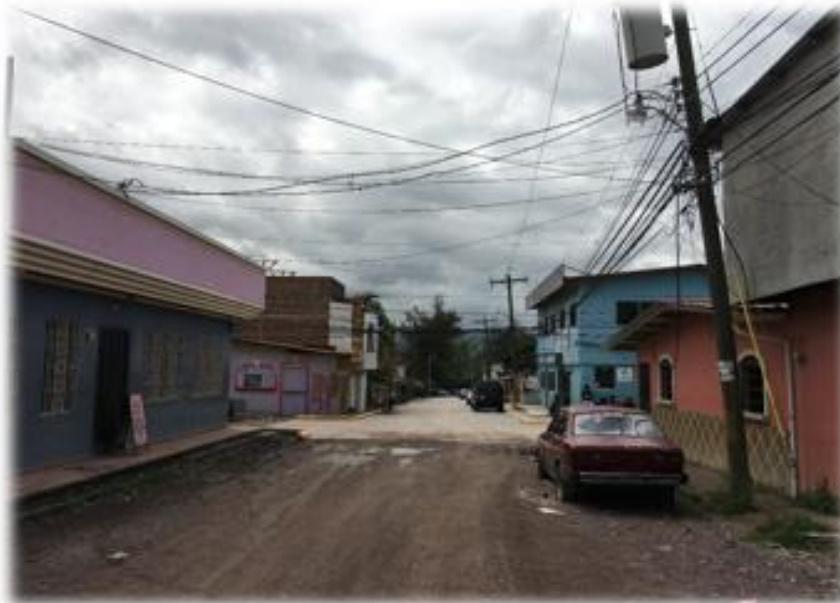
FINAL DE PAVIMENTO CON CONCRETO HIDRÁULICO.