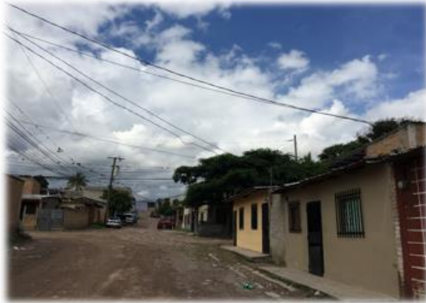
VISTA DEL ESTADO DE LA CALLE A PAVIMENTAR.