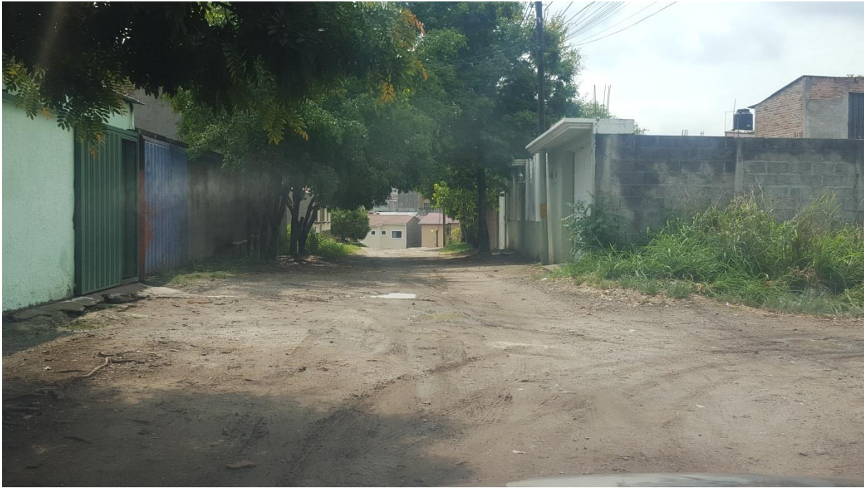
1. VISTA DE ESTADO ACTUAL DE CALLE A PAVIMENTAR