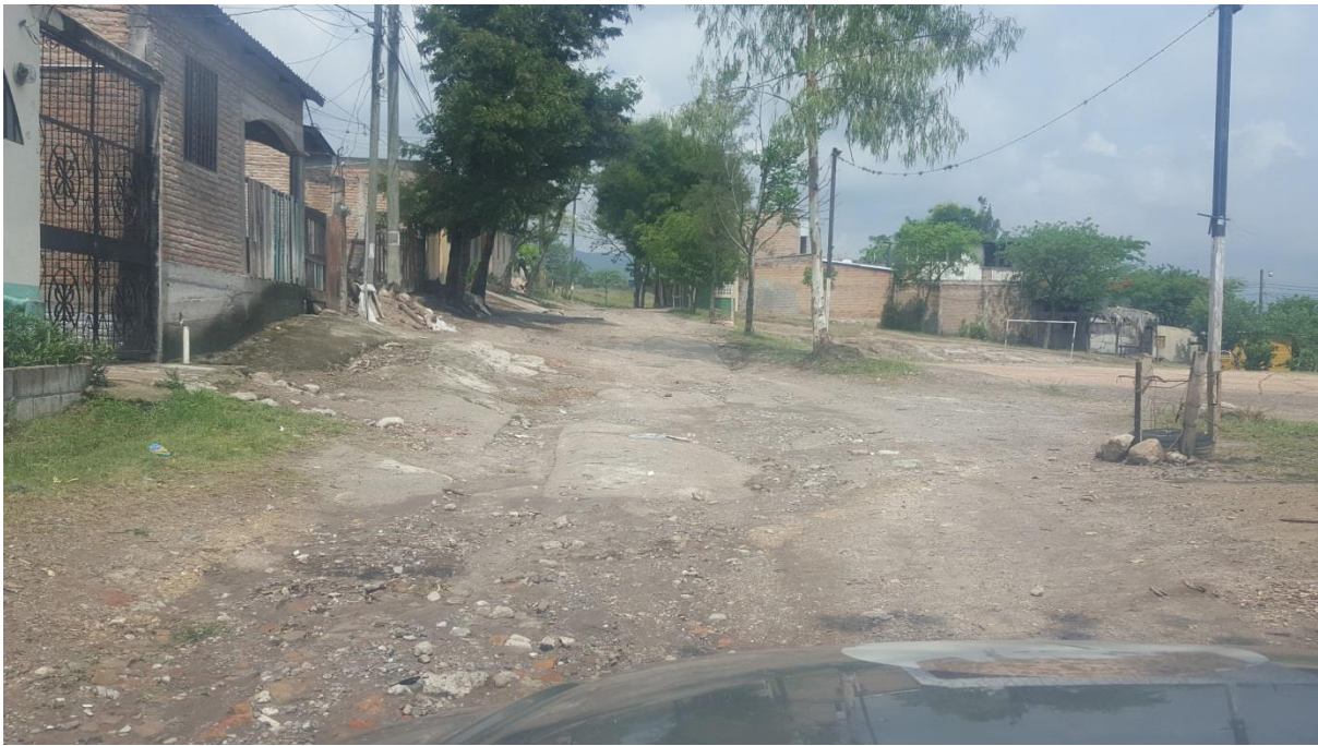
3. VISTA PANORAMICA DE CALLE A PAVIMENTAR