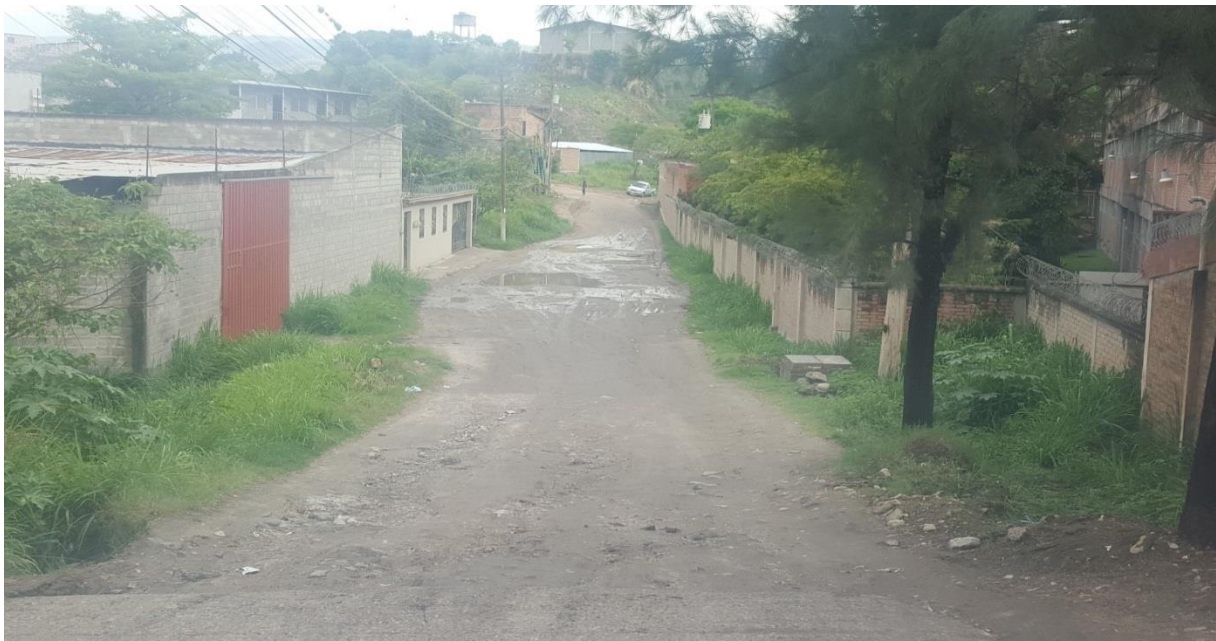
4. VISTA ESTADO ACTUAL DE CALLE A PAVIMENTAR