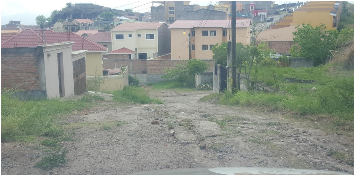
2. VISTA PANORAMICA DE CALLE A PAVIMENTAR