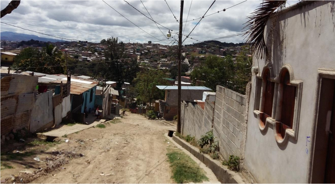
Vista de la sección de la calle

Proyecto: Pavimentación de calle con concreto hidráulico, col Los Andes Código: 1127