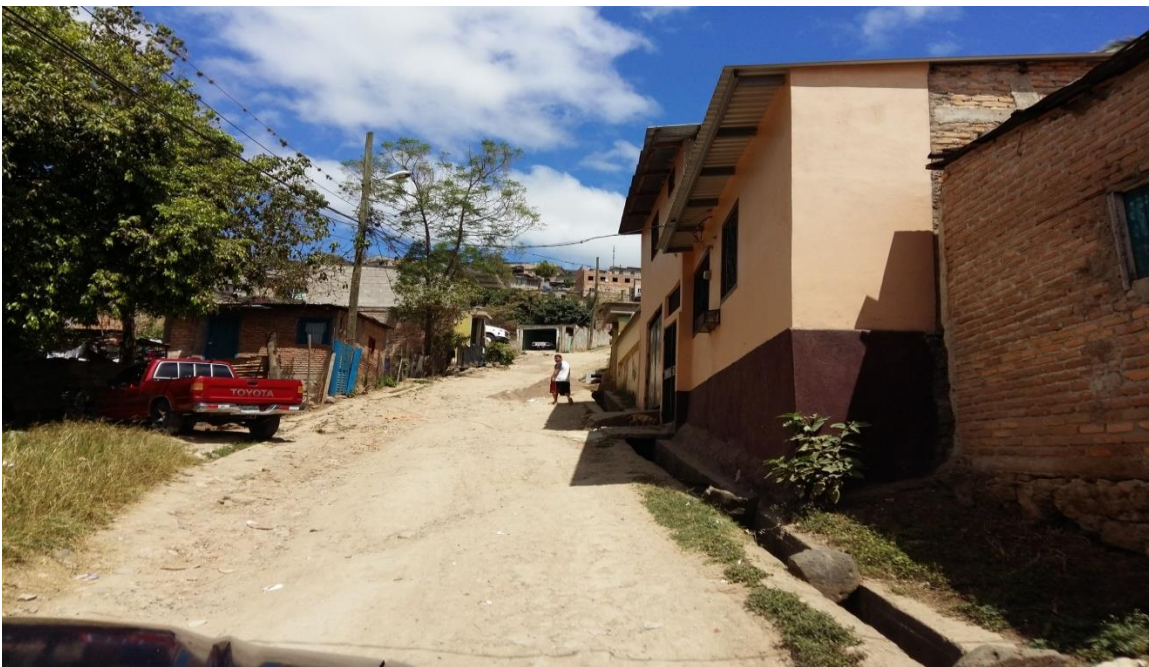
Vista panorámica de la calle