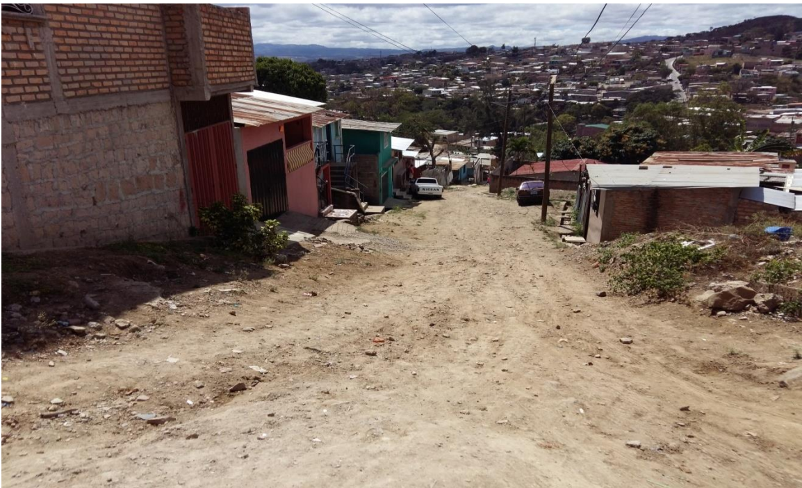
Fin de calle a pavimentar