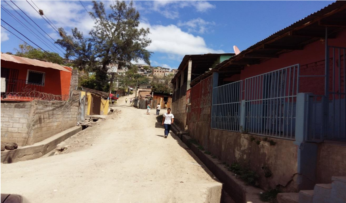
Inicio de la calle a pavimentar