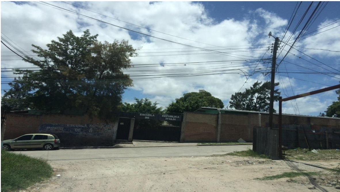
Inicio de calle a pavimentar con concreto hidráulico, tramo A