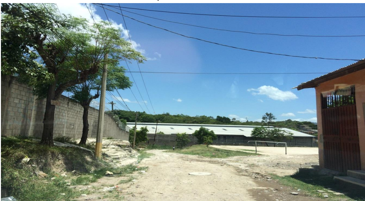
Final de calle a pavimentar con concreto hidráulico, tramo A