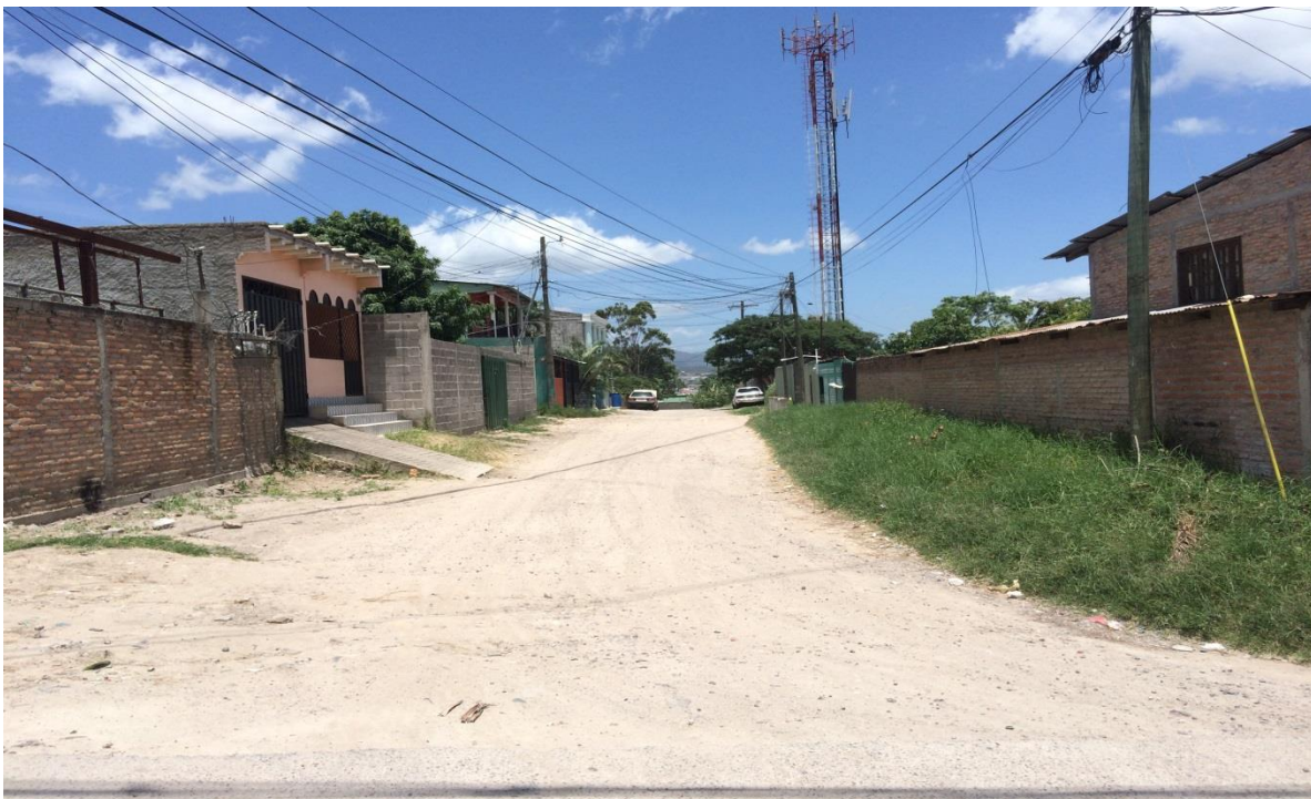
Panorama de calle a pavimentar con concreto hidráulico