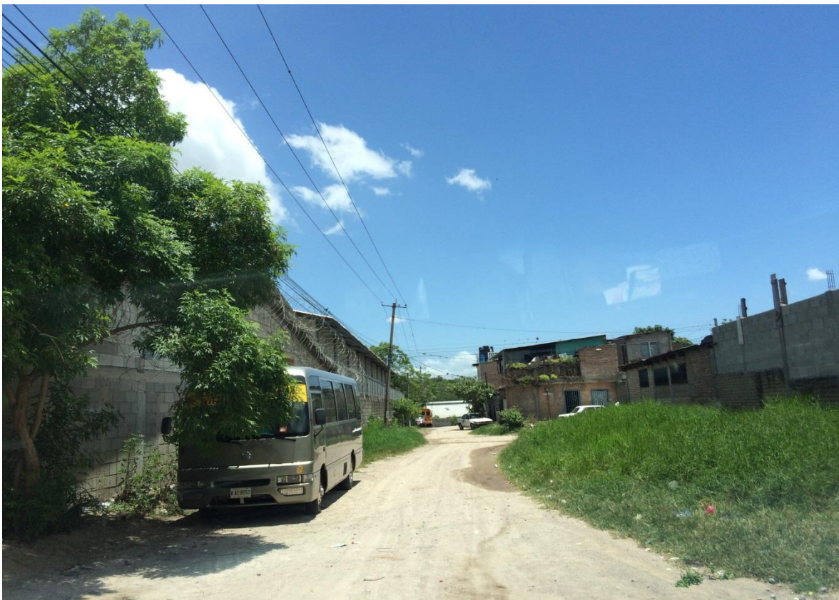
Panorama de calle a pavimentar con concreto hidráulico