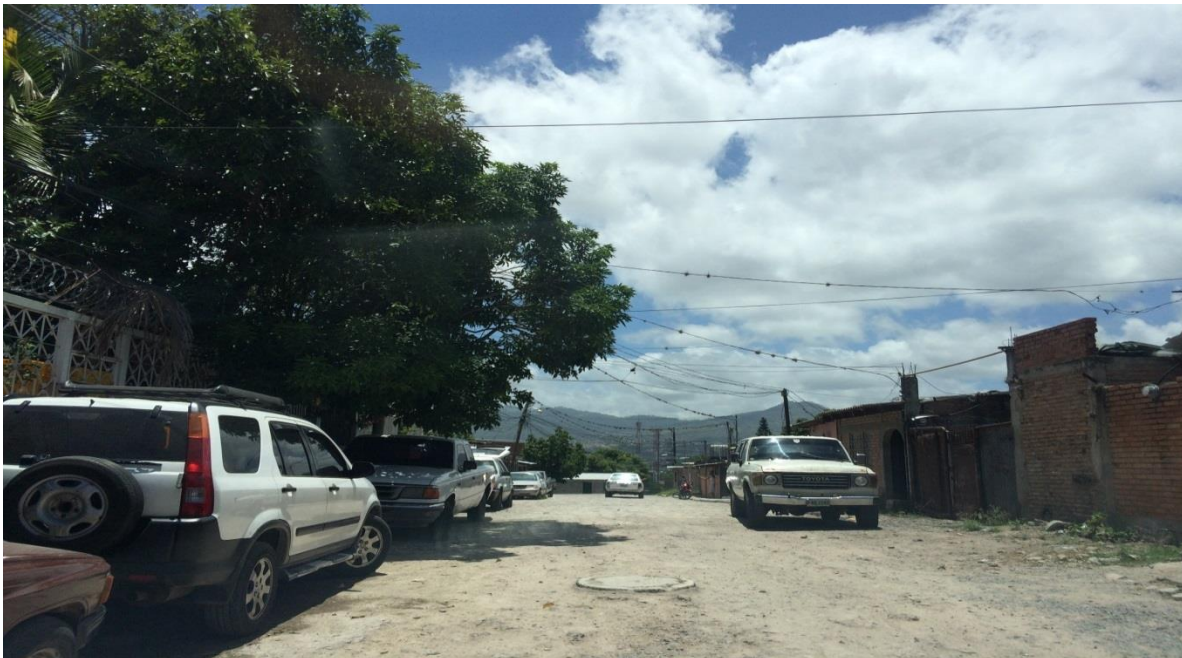
Final de calle a pavimentar con concreto hidráulico, tramo B