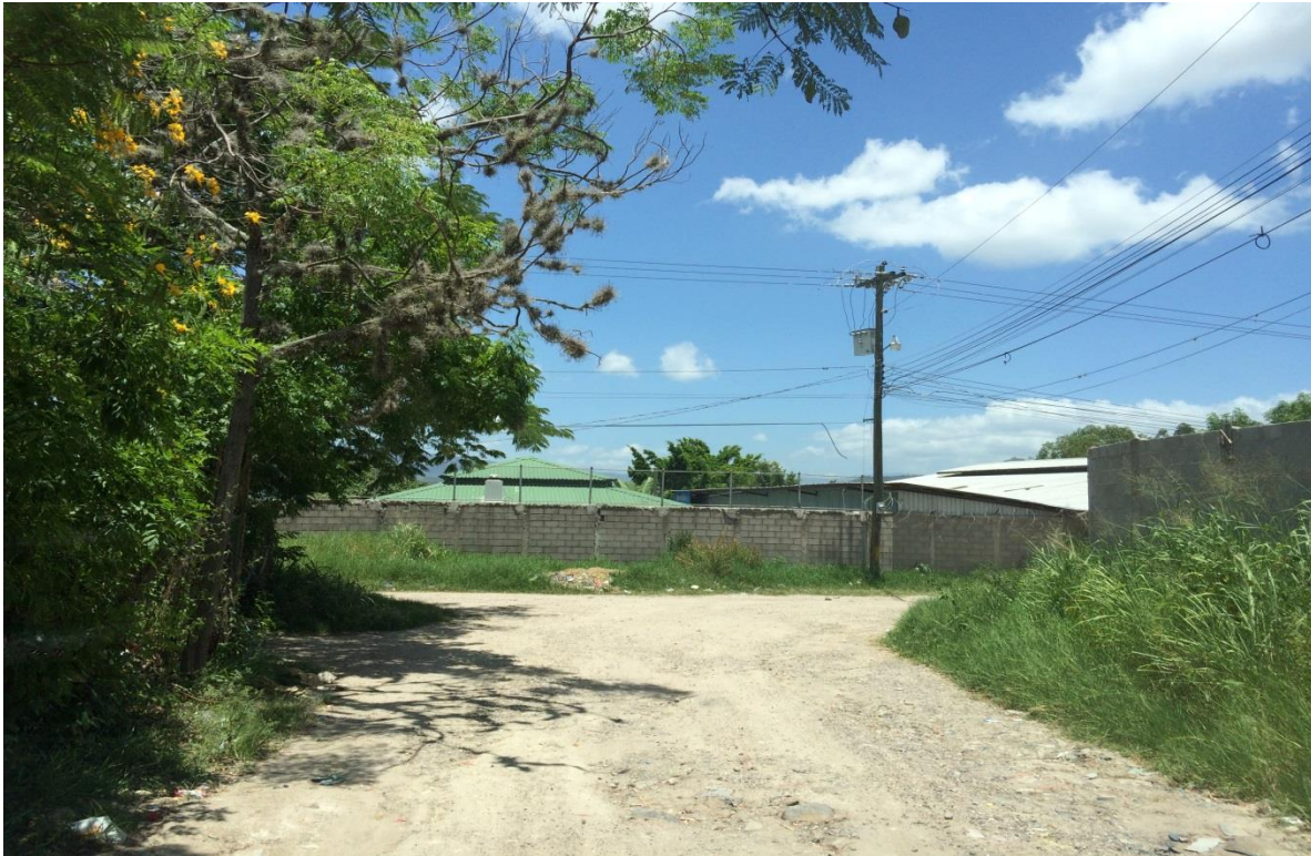
Inicio de calle a pavimentar con concreto hidraulico, tramo B

Proyecto: Pavimentación de calles con concreto hidráulico en colonia Lomas del Cortijo Código: 1265