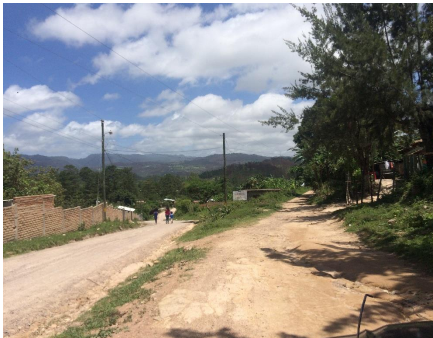
INCIÓ DE TRAMO A REPARAR