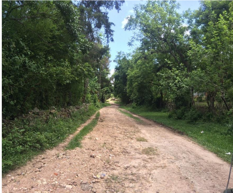
OTRA VISTA PANORAMICA DEL TRAMO A REPARAR