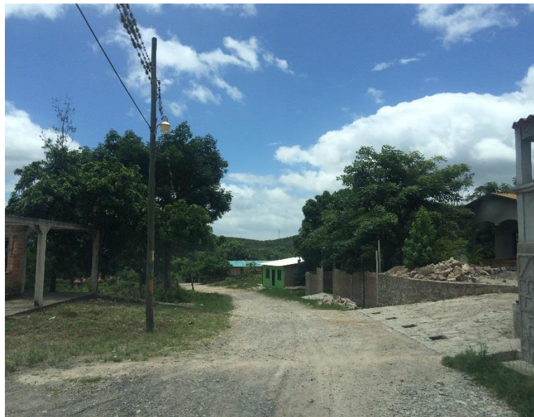
FINAL DE CALLE A REPARAR