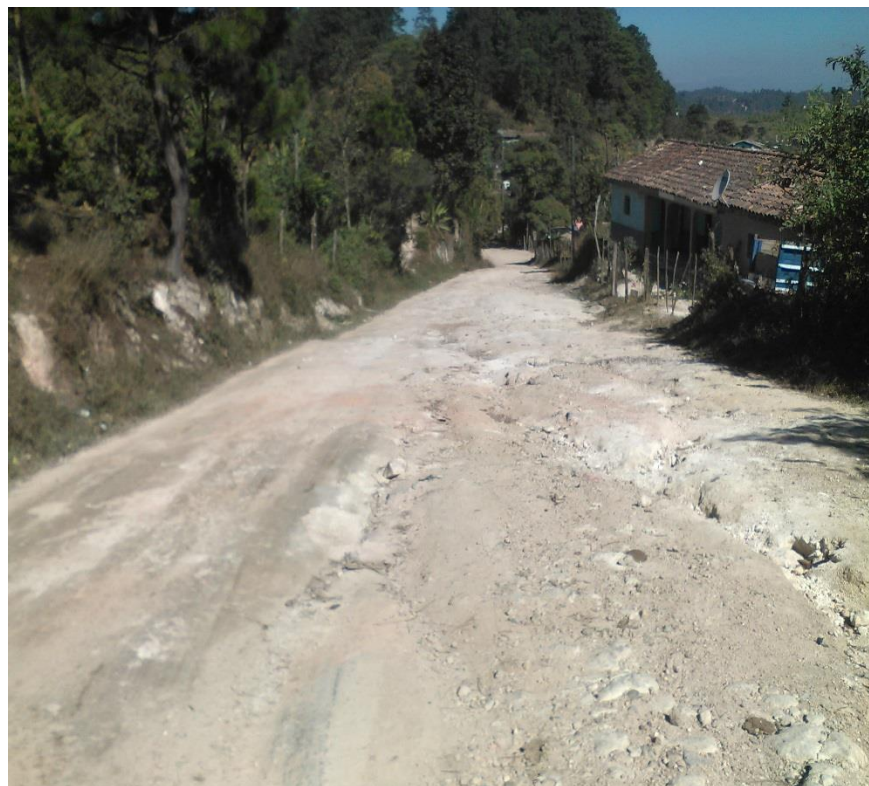
VISTA PANORAMICA DE CALLE A REPARAR