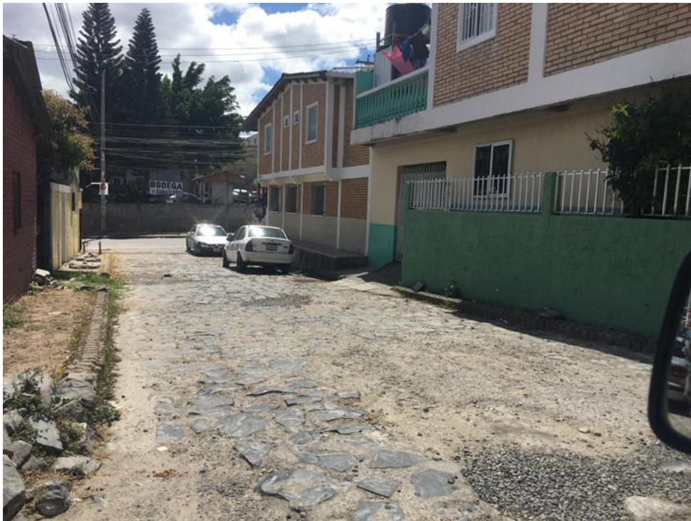
CONDICIONES ACTUALES DEL EMPEDRADO EN EL SITIO DONDE SE CONECTARÁ CON LA CALLE PRINCIPAL