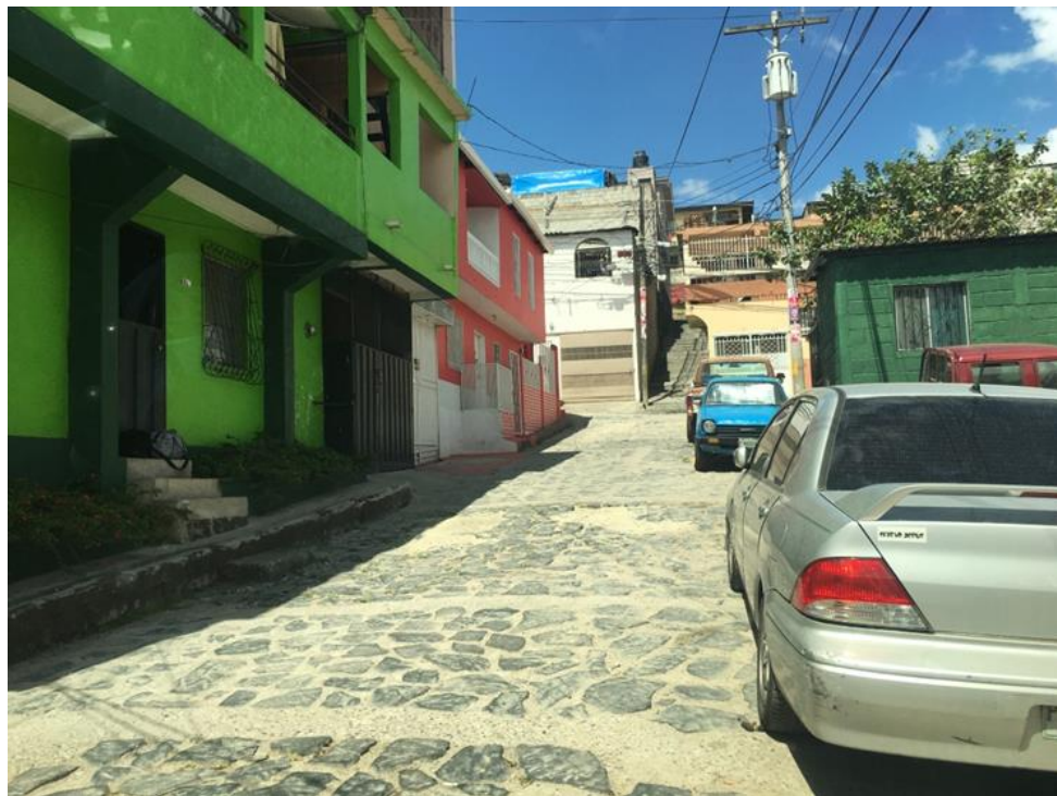
VISTA DE OTRO SECTOR DEL EMPEDRADO A CUBRIR CON WHITE TOPPING