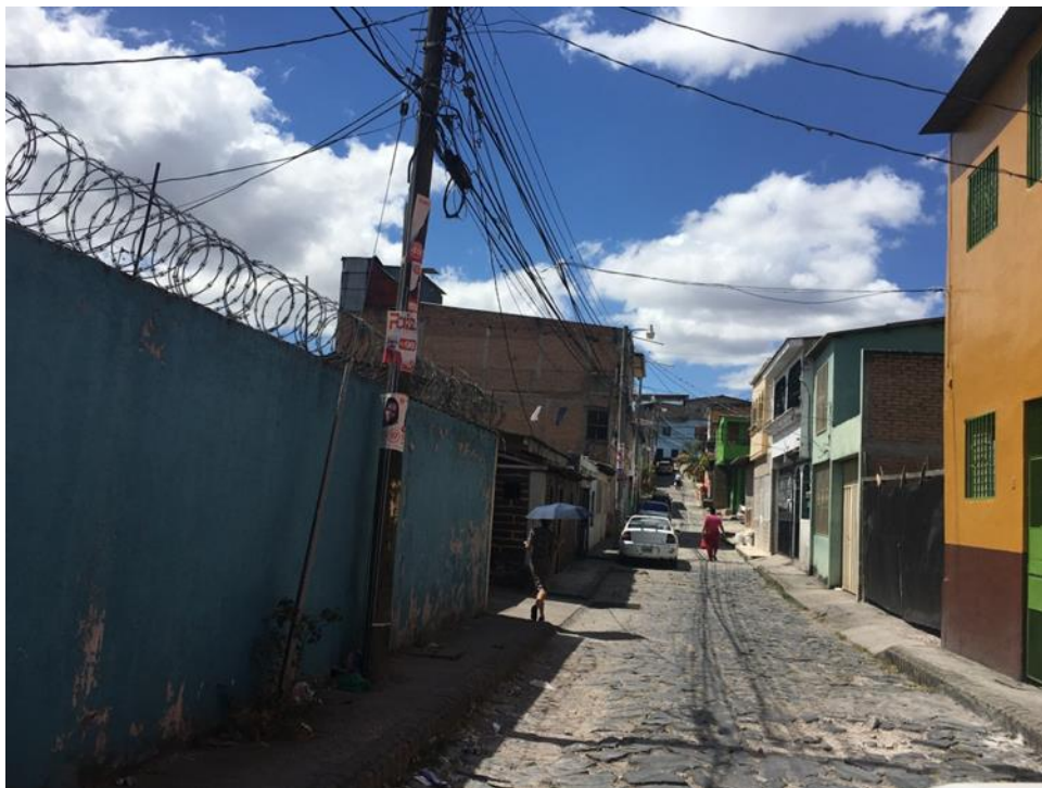
SE PUEDE OBSERVAR EL MAL ESTADO EN QUE SE ENCUENTRA EL EMPEDRADO EXISTENTE