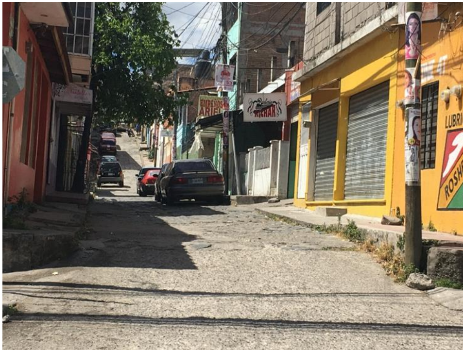
VISTA DE UNA DE LAS CALLES DONDE SE COLOCARÁ WHITE TOPPING