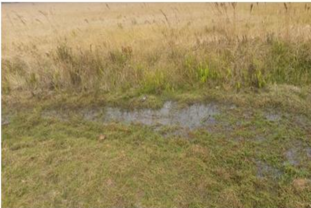
VISTA DEL ESTADO ACTUAL DE LA LAGUNA