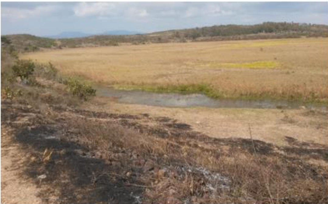
VISTA DE LA CONSTRUCCION DEL MURO