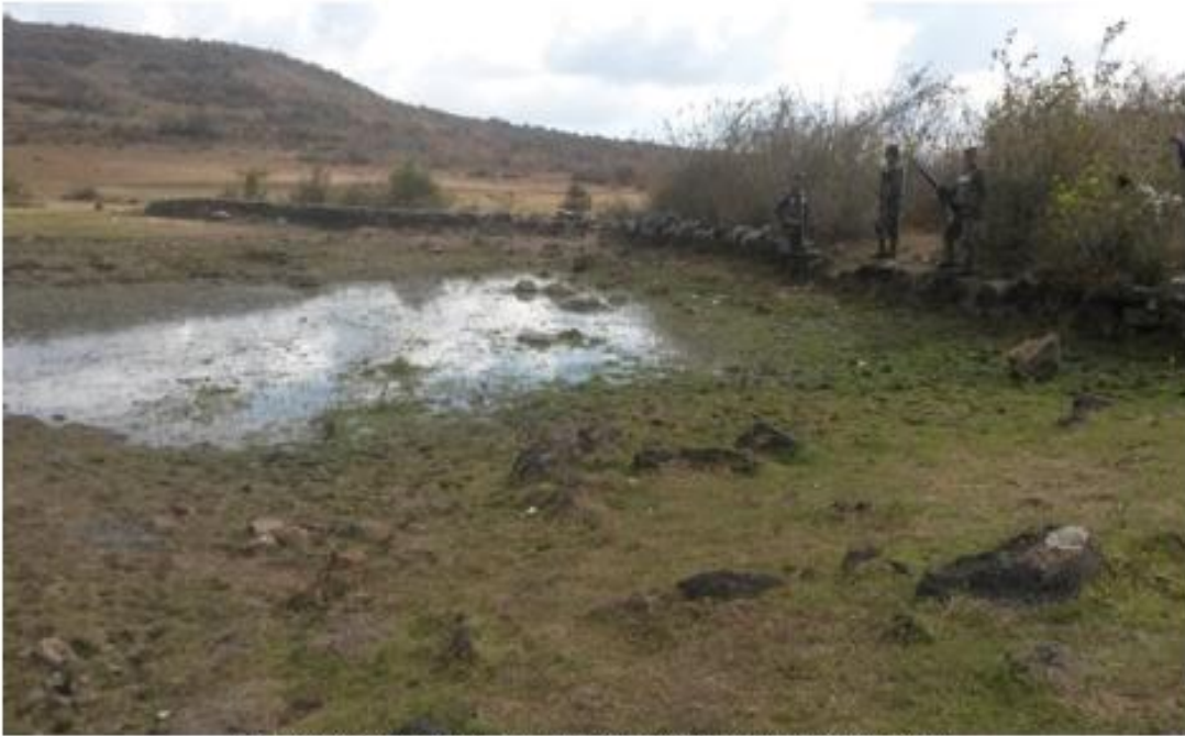
VISTA PANORAMICA DE LA LAGUNA EL PEDREGAL