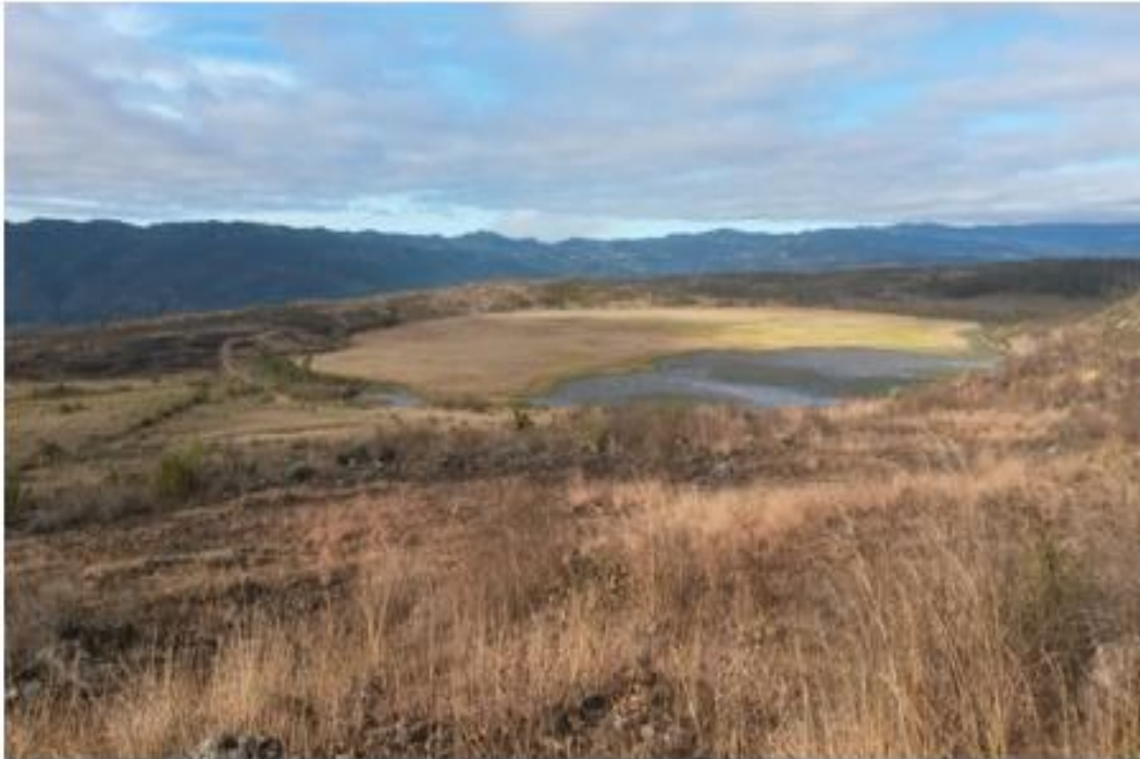
VISTA DE LA UBICACION DE LA LAGUNA EL PEDREGAL