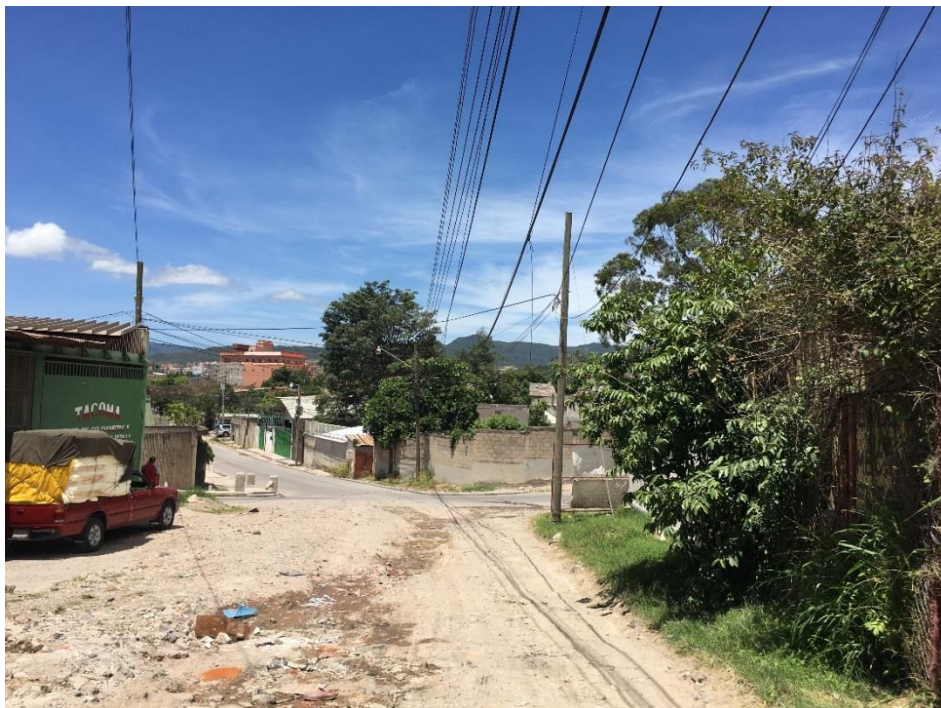
Final del tramo a pavimentar con concreto hidráulico