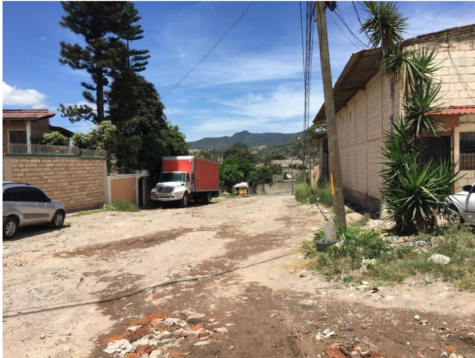
Panorama del tramo a pavimentar con concreto hidráulico