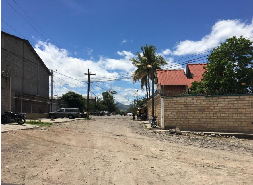
Inicio de tramo a pavimentar con concreto hidráulico

Proyecto: Pavimentación de calle con concreto hidráulico en col. Inestroza Código: 1312