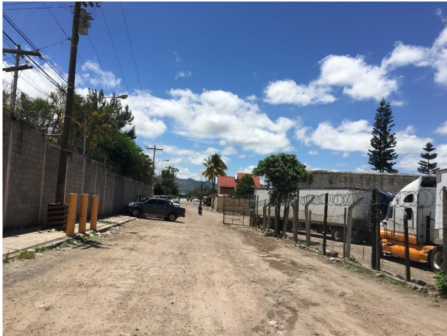
Panorama de tramo a pavimentar con concreto hidráulico