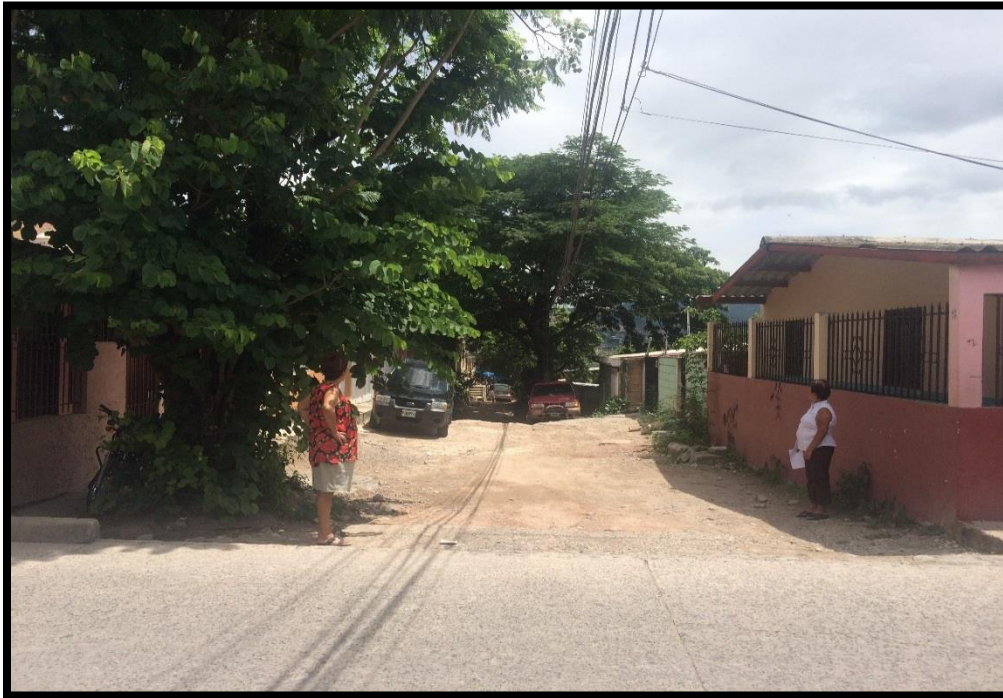
OTRA VISTA DEL MAL ESTADO DE LAS CALLES ACTUALMENTE