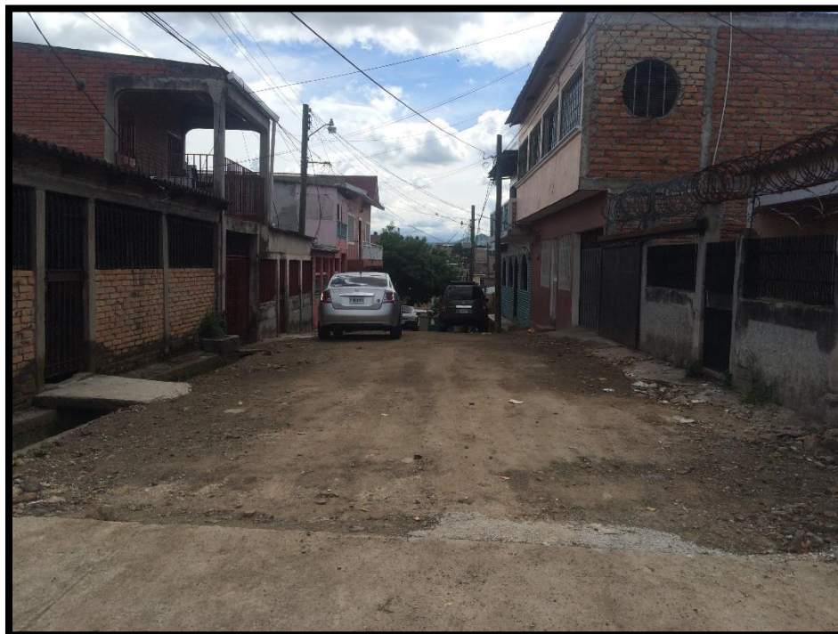
VISTA DEL INICIO DE LA PRIMERA CALLE