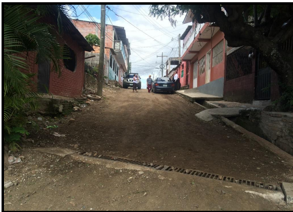
VISTA DEL TRAMO A PAVIMENTAR