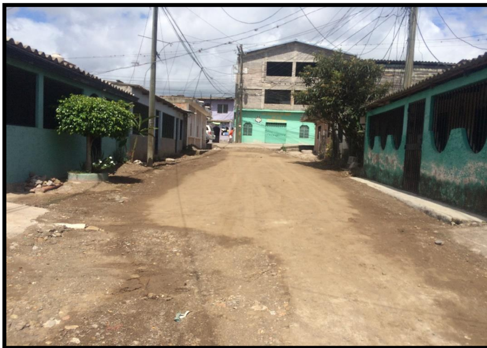
VISTA DEL MAL ESTADO DE LA CALLE