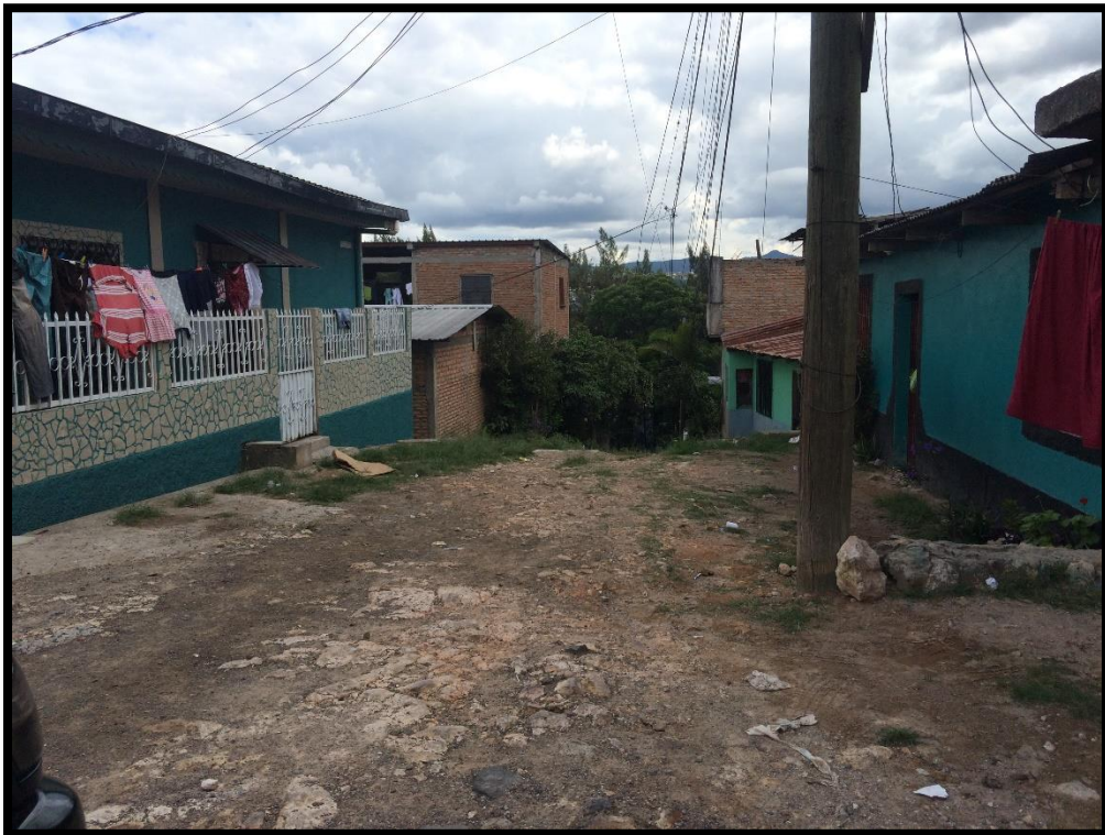
TRAMO FINAL DE LA PAVIMENTACIÓN