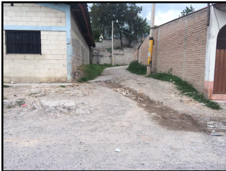
VISTA DEL INICIO DE LA CALLE A PAVIMENTAR