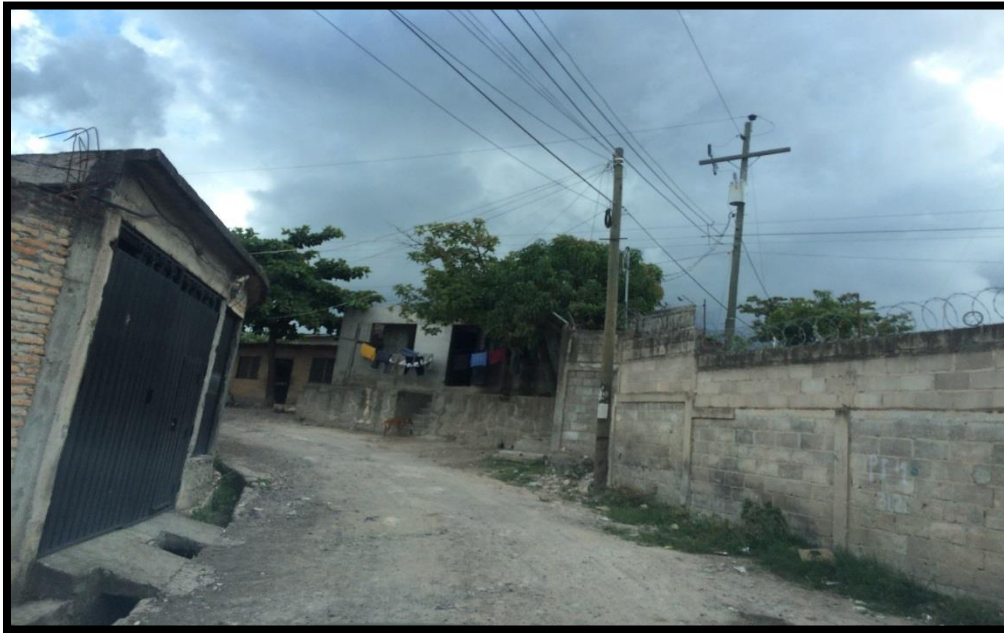
VISTA DEL MAL ESTADO DE LAS CALLES