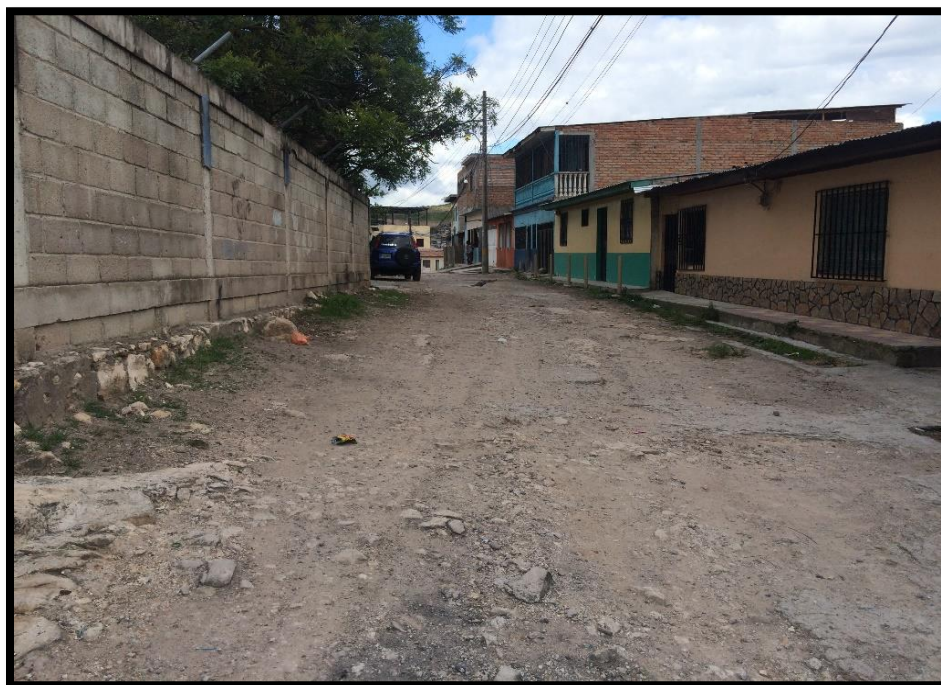
VISTA DEL TRAMO A PAVIMENTAR