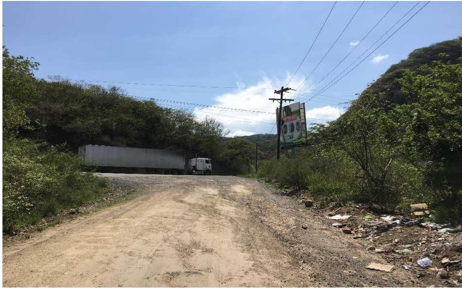
1. VISTA PANORAMICA DE TRAMO INICIAL A REPARAR

Proyecto: Conformación y balastado de calles, aldeas Casa Quemada-Cofradía Código: 1239