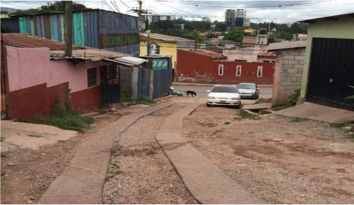
Foto 1: inicio de calle tramo a, pavimentacion contiguo a radiadores de honduras.