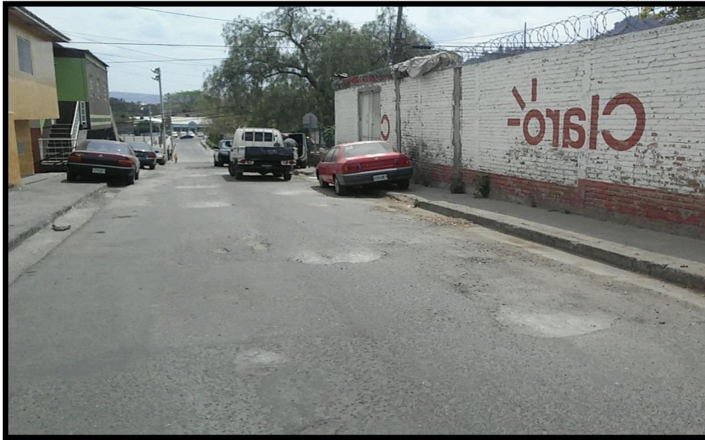
Vista del tramo en mal estado de las calles