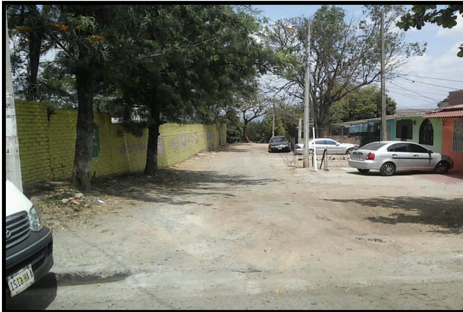
Vista del tramo a trabajar con mezcla Asfáltica