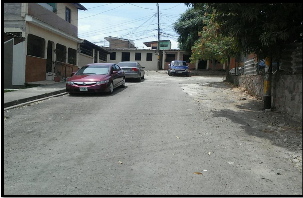
Vista del deterioro de la calle existente