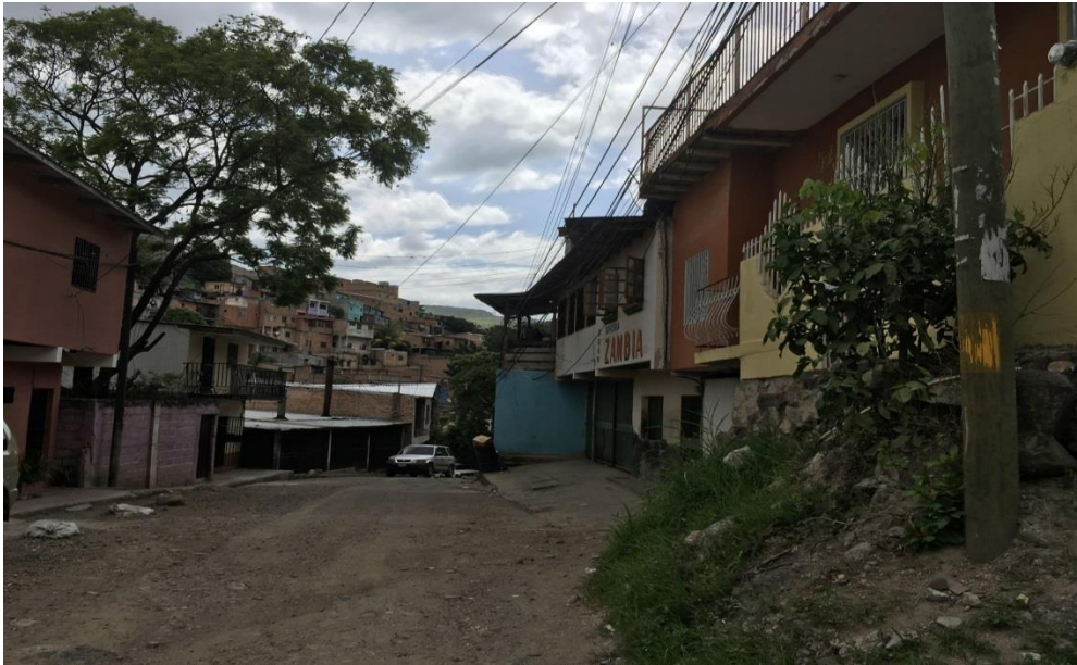
3. VISTA PANORAMICA DE CALLE A PAVIMENTAR