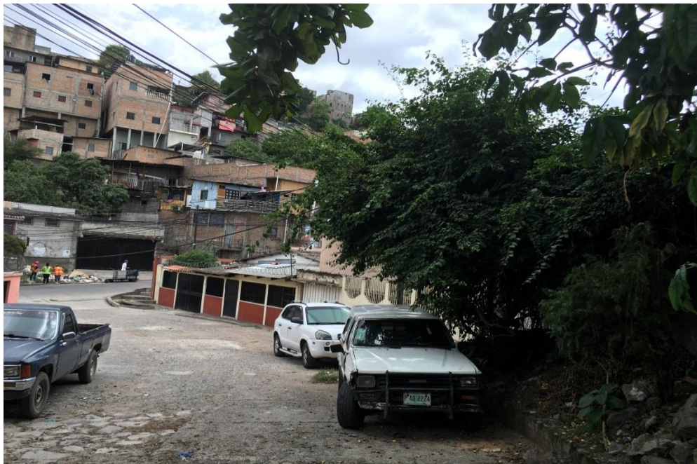
4. VISTA ESTADO ACTUAL DE CALLE A PAVIMENTAR