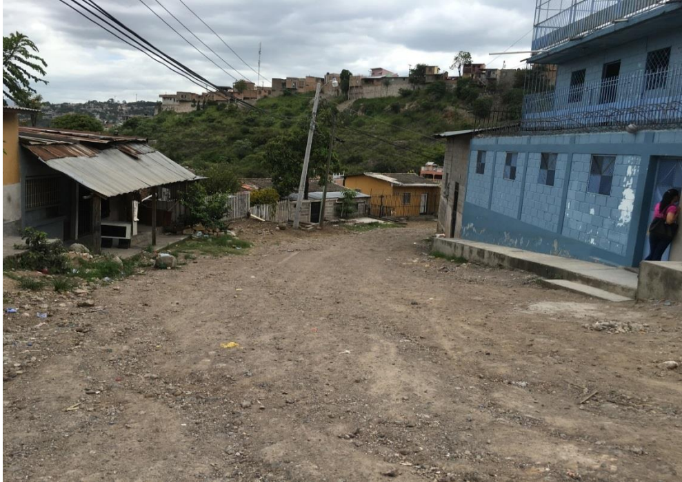
1. VISTA DE ESTADO ACTUAL DE CALLE A PAVIMENTAR