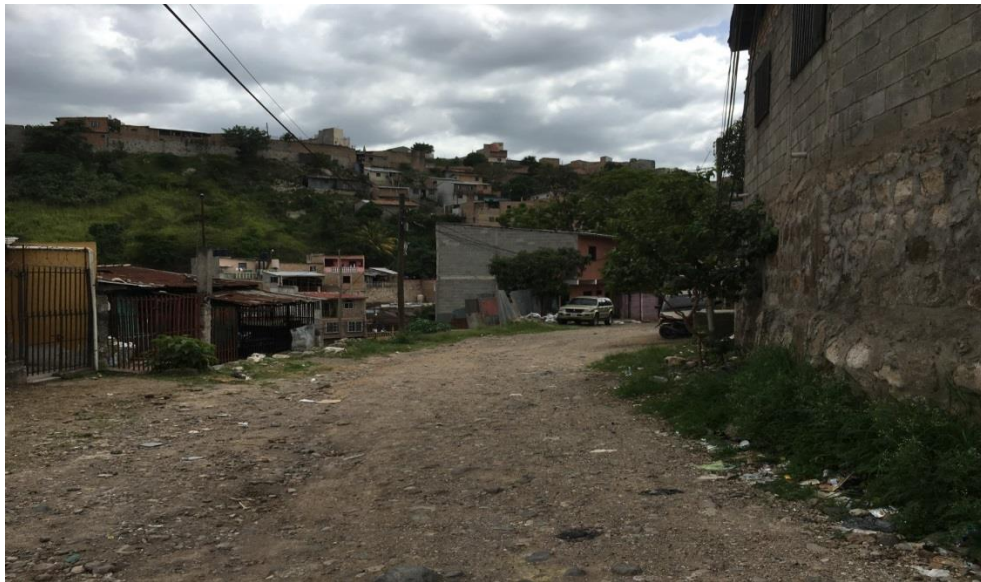
2. VISTA PANORAMICA DE CALLE A PAVIMENTAR