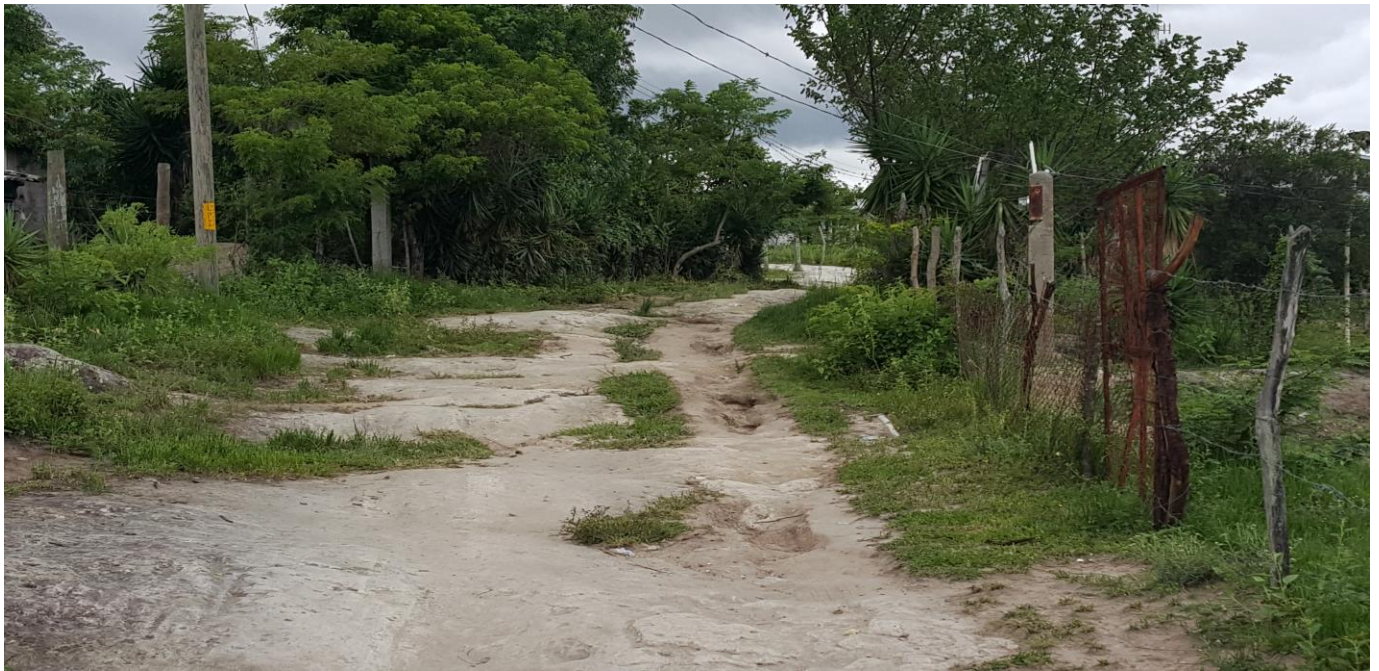
VISTA DEL MAL ESTADO DEL ACCESO A ALDEA LA CAÑADA