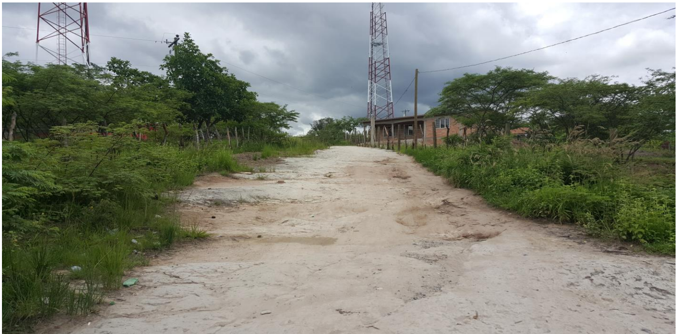
VISTA DE TRAMO FINAL