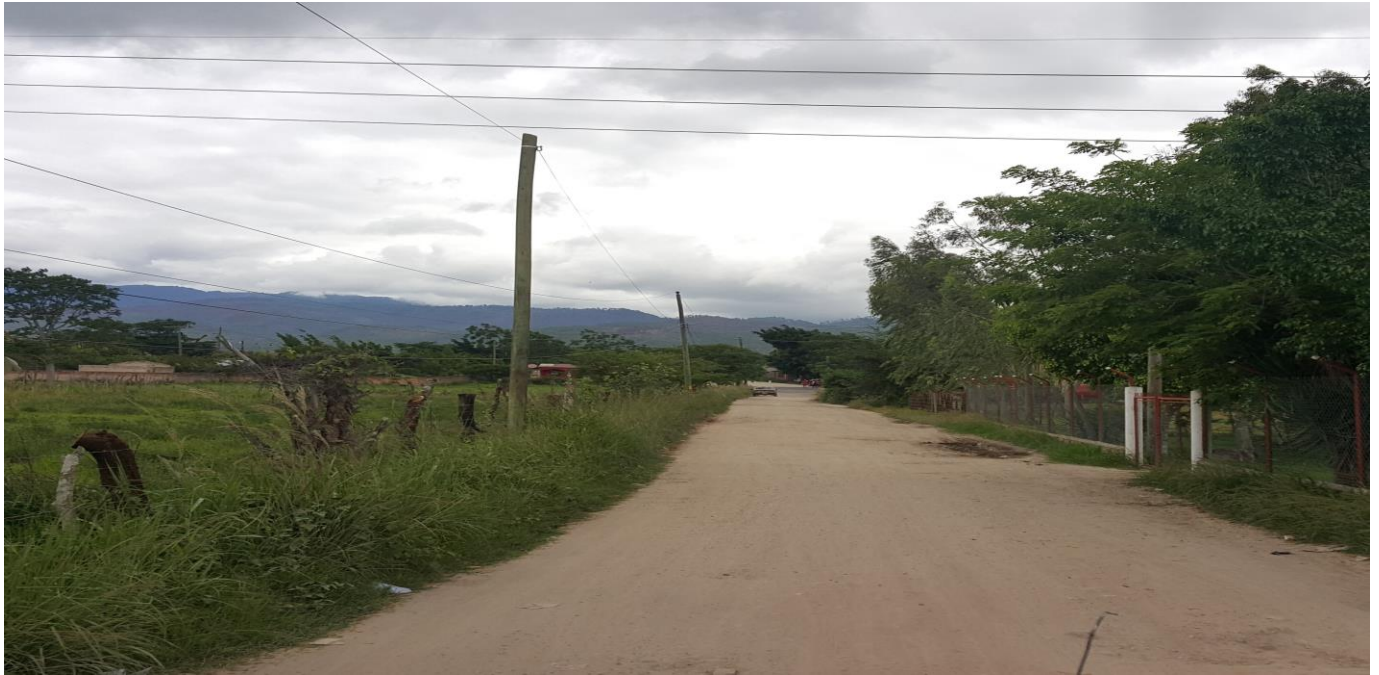
INCIO DE CALLE A CONFORMAR