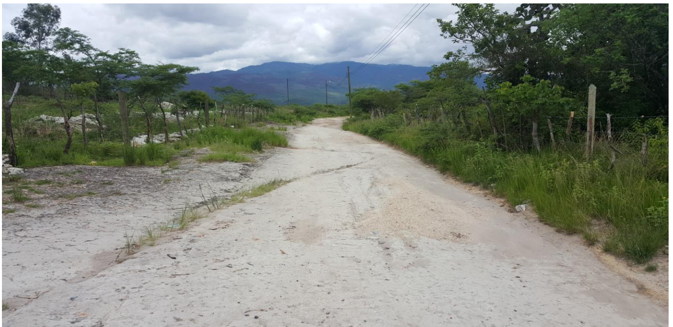
VISTA PANORAMICA DEL TRAMO A REPARAR