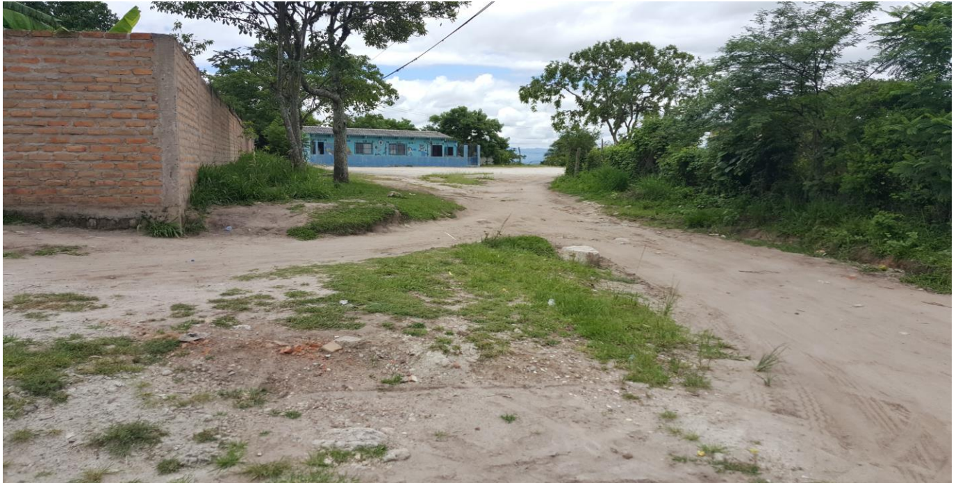
VISTA DE TRAMO HACIA ESCUELA DE ALDEA LA CAÑADA