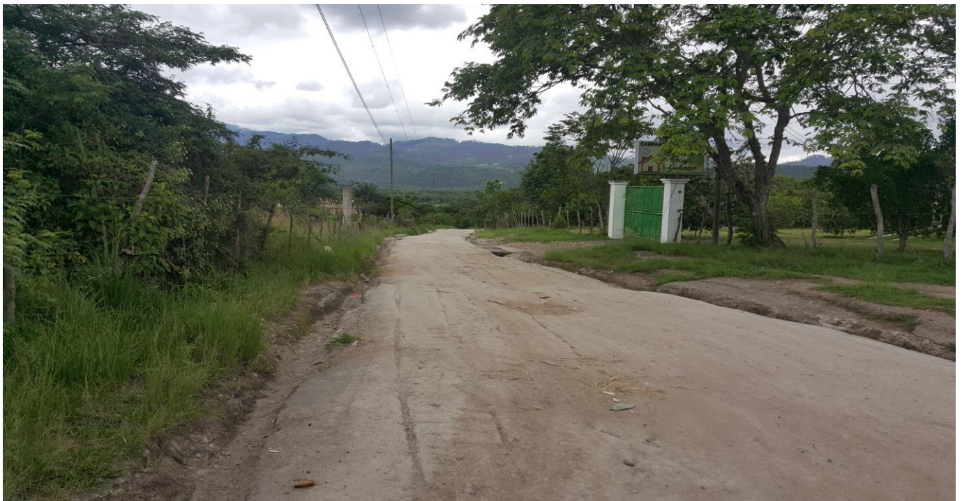
OTRA VISTA DEL TRAMO A REPARAR