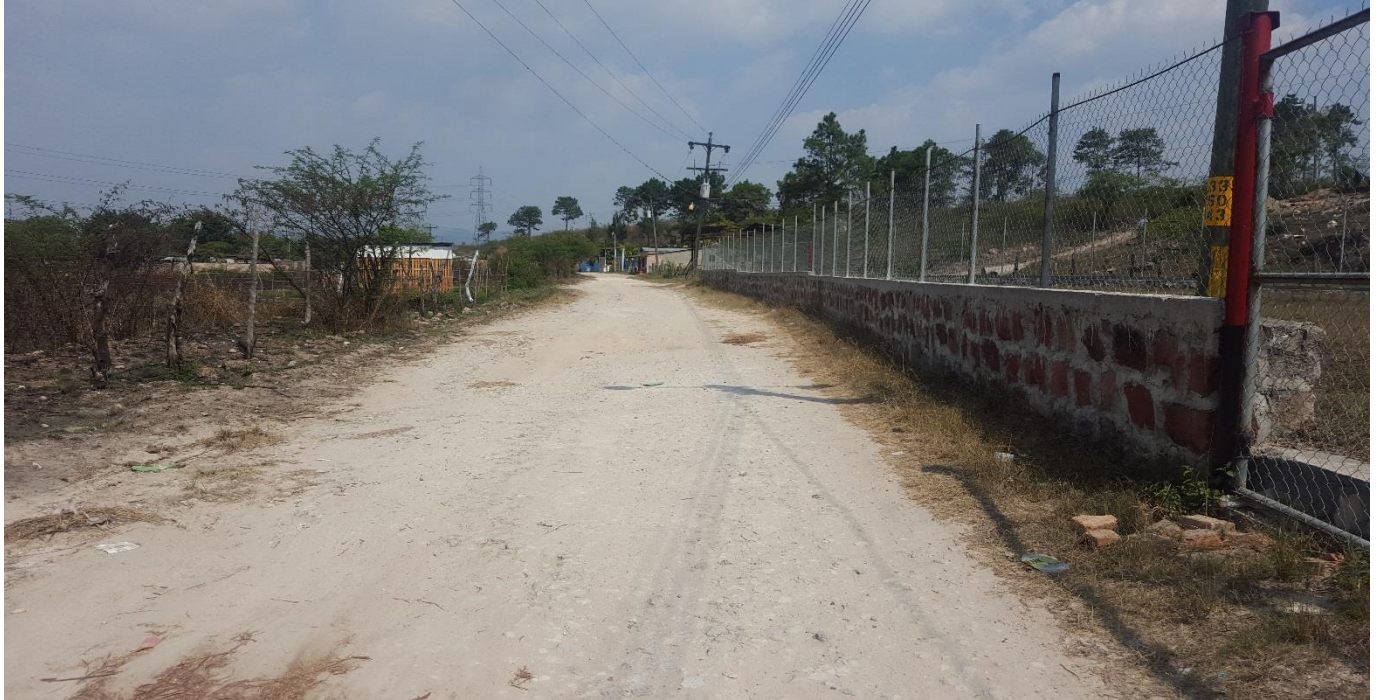
TRAMO A REPARAR EN ACCESO A LA COMUNIDAD STYBYS