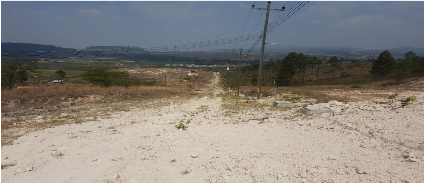
VISTA DEL MAL ESTADO DEL ACCESO A COMUNIDAD STYBYS