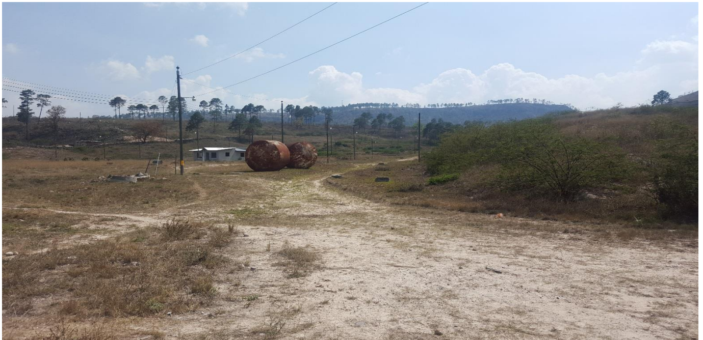
UBICACIÓN DE LA CONSTRUCCION DE HUELLAS VEHICULARES