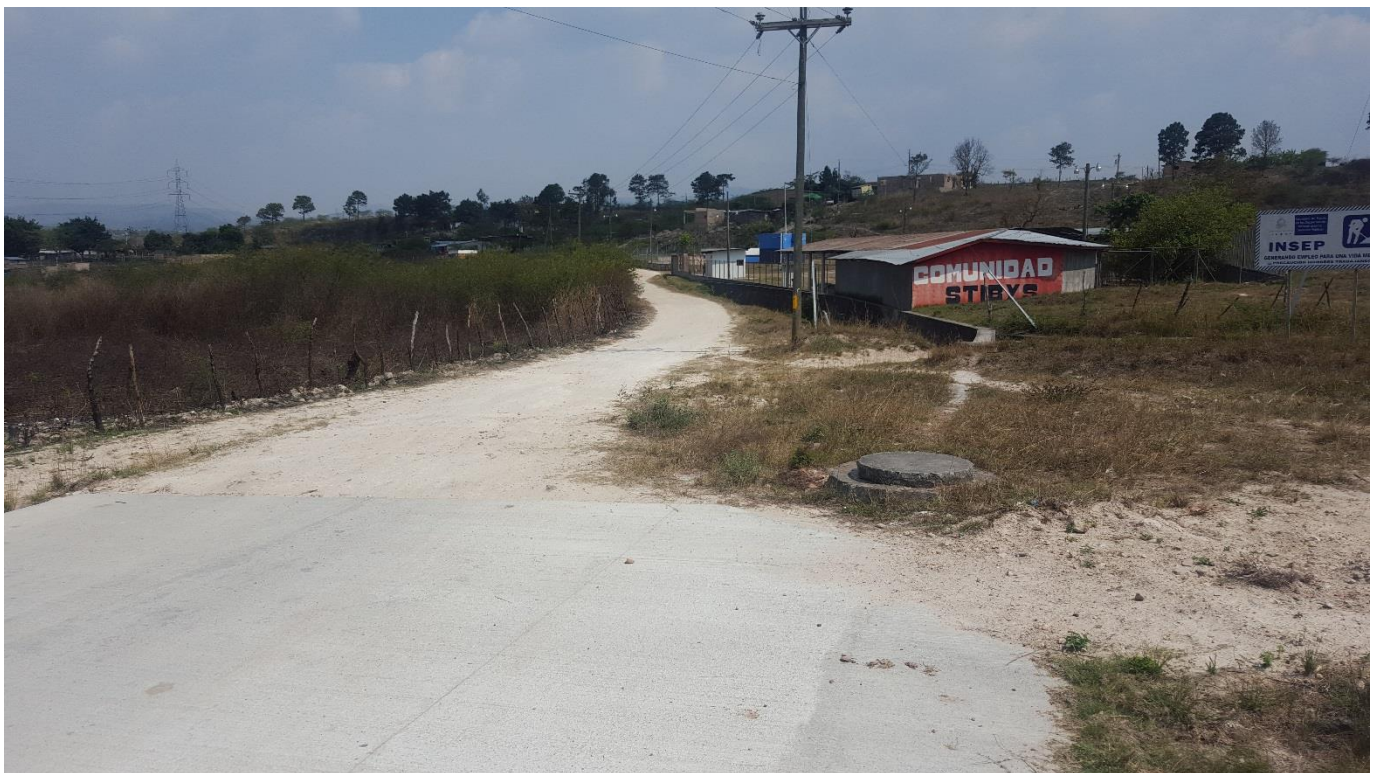
VISTA DEL TRAMO DE INICIO HACIA HOSPITAL SANTA ROSITA