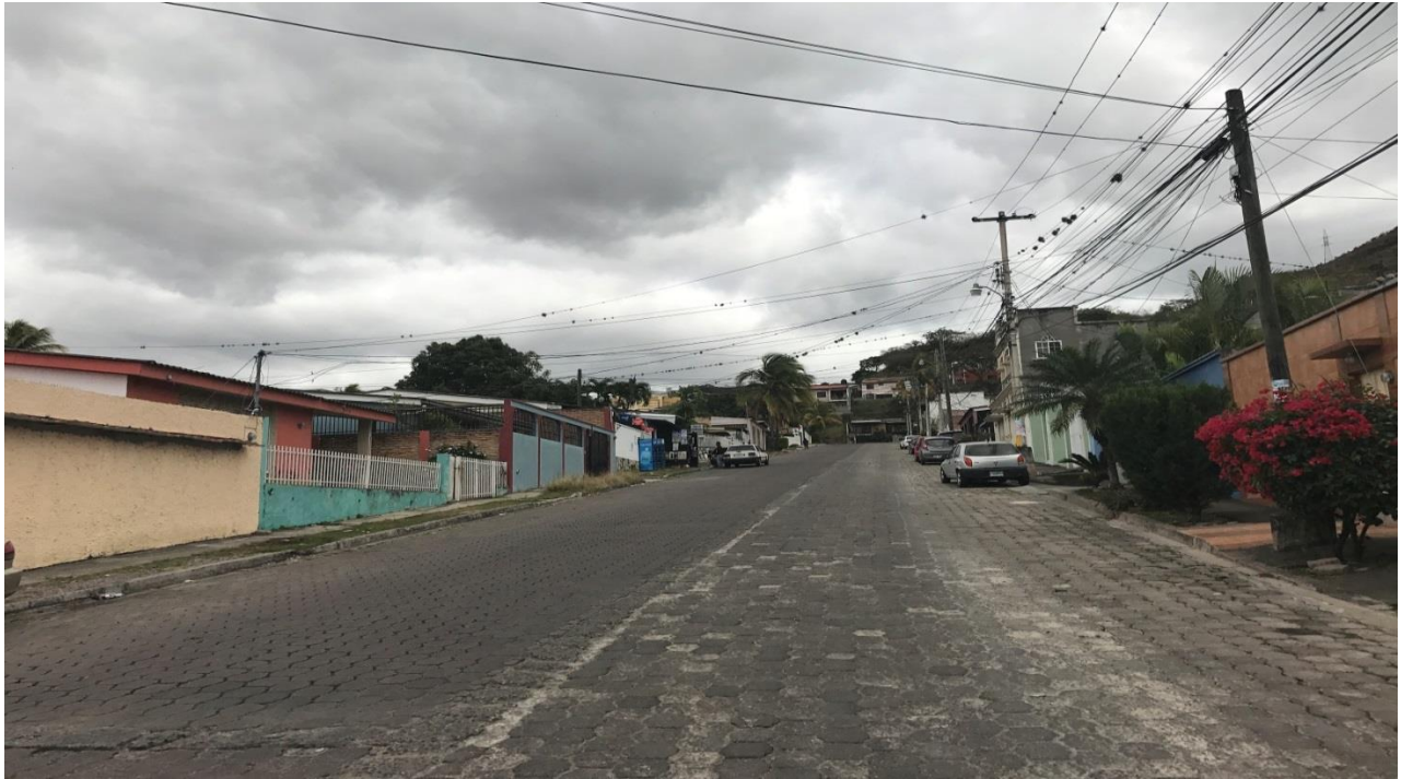
VISTA DE LA CALLE DONDE SE DESMONTARÁ EL ADOQUÍN

Proyecto: Pavimentación de calle con concreto hidráulico, col. Loarque, calle a Inice, salida al sur Código: 1555