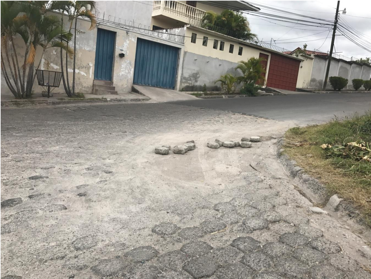
CALLE DONDE SE HARÁ LA DEMOLICIÓN DE LA CARPETA ASFÁLTICA