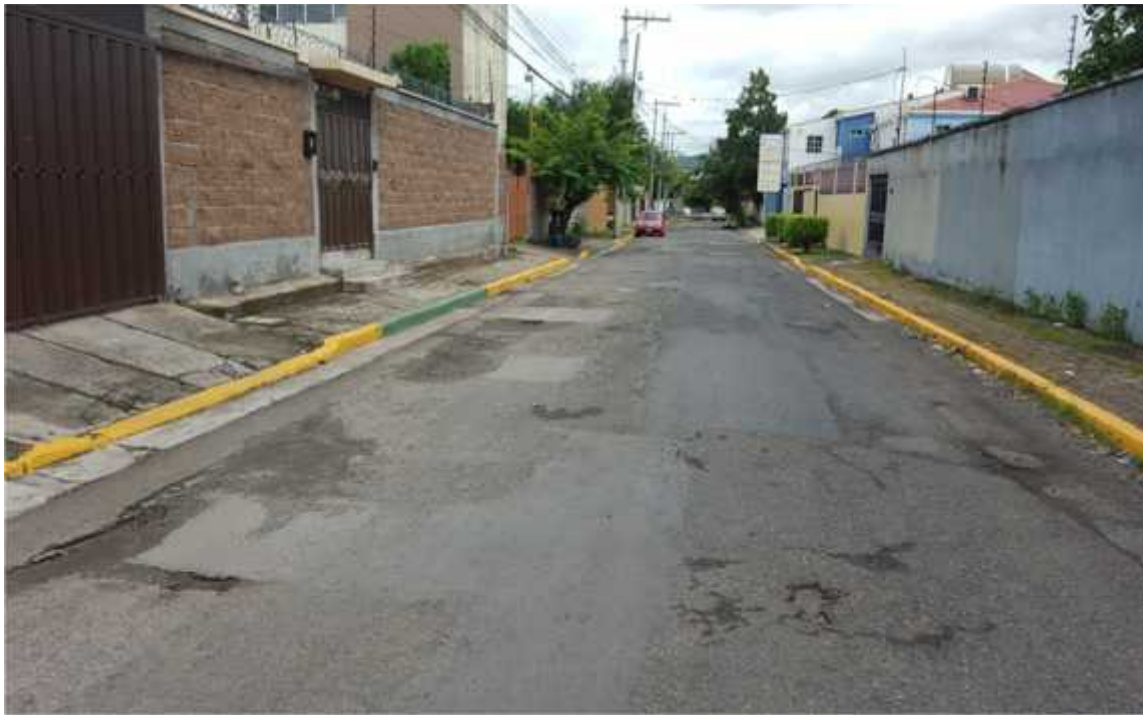
CALLE QUE DIRIGE A HOSPITAL DIME