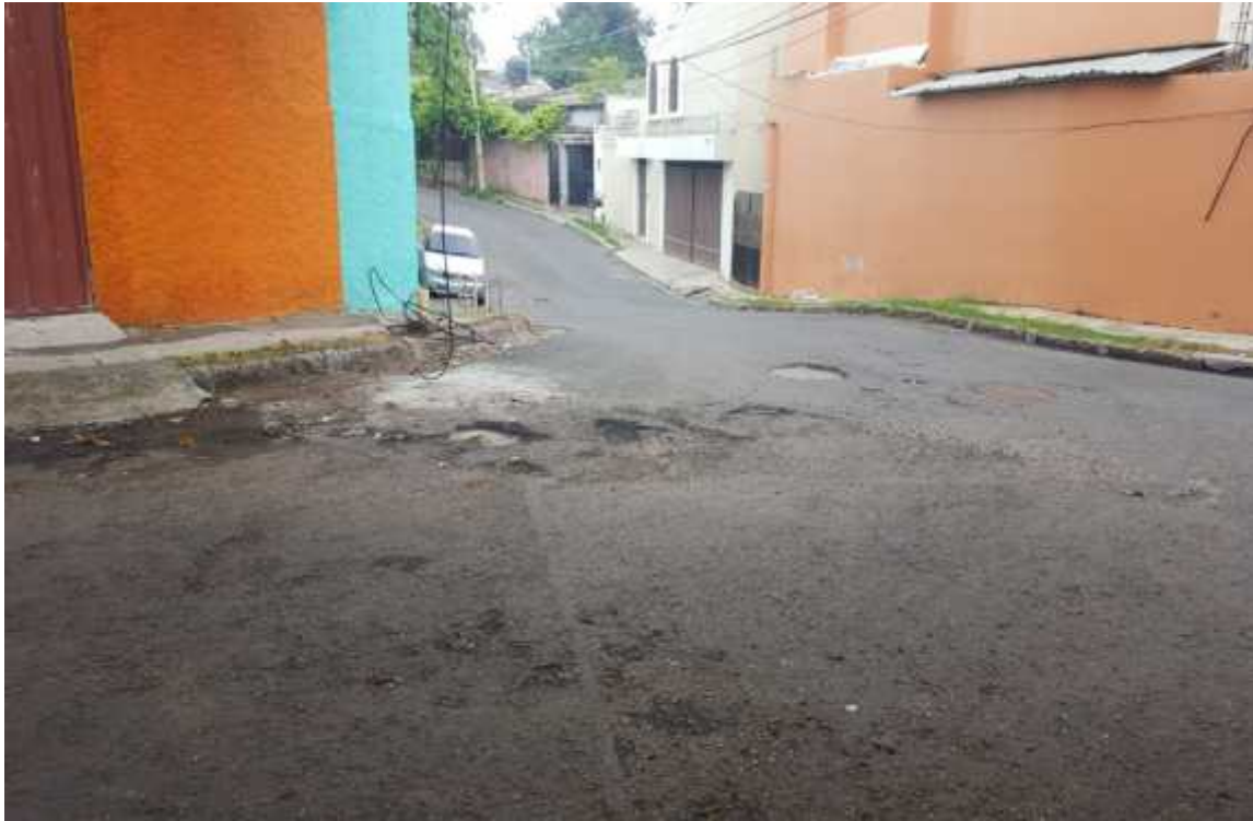
TRAMO EN MAL ESTADO EN COL. MIRAMONTES