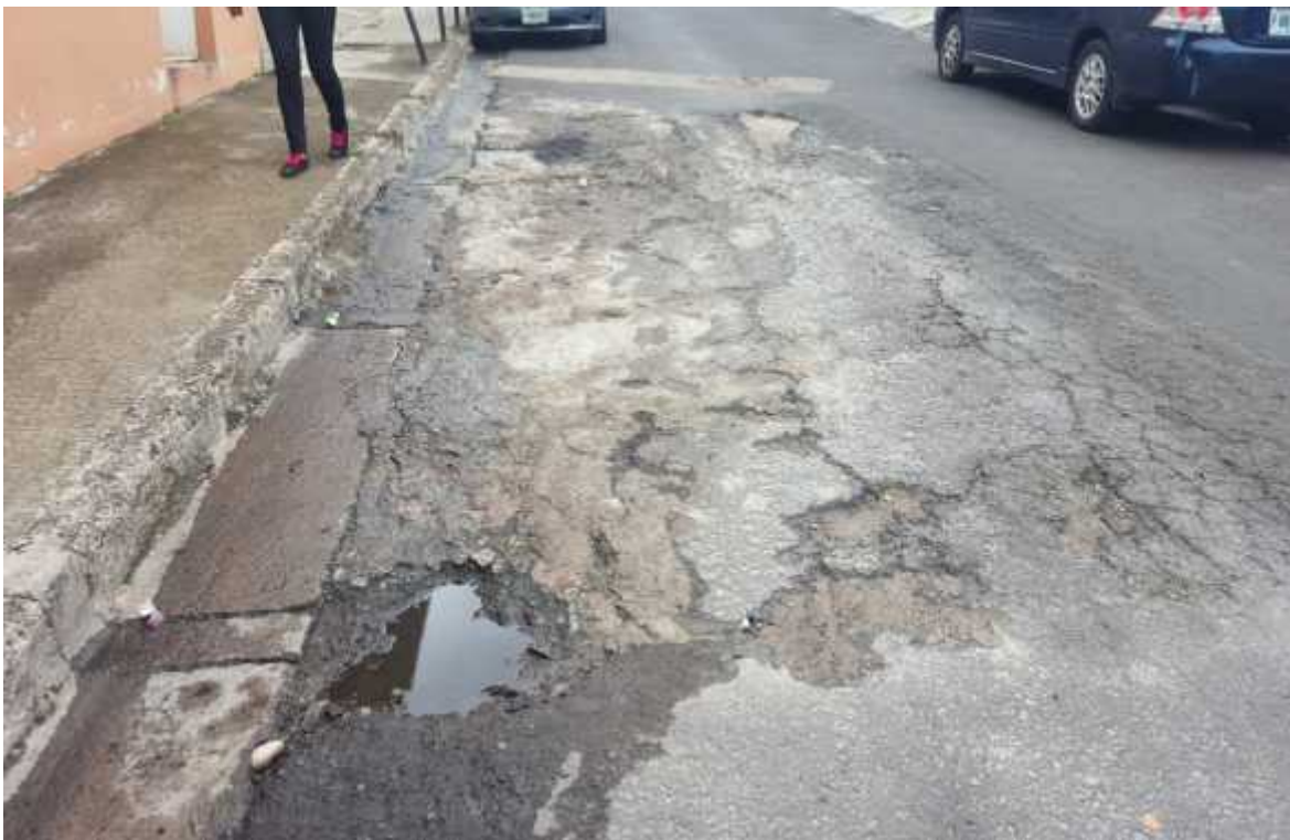
CALLE ATRÁS DE ESCUELA ELVEL SCHOOL