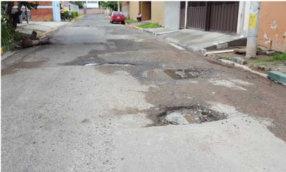
PUNTO EN MAL ESTADO EN COL. HUMUYA