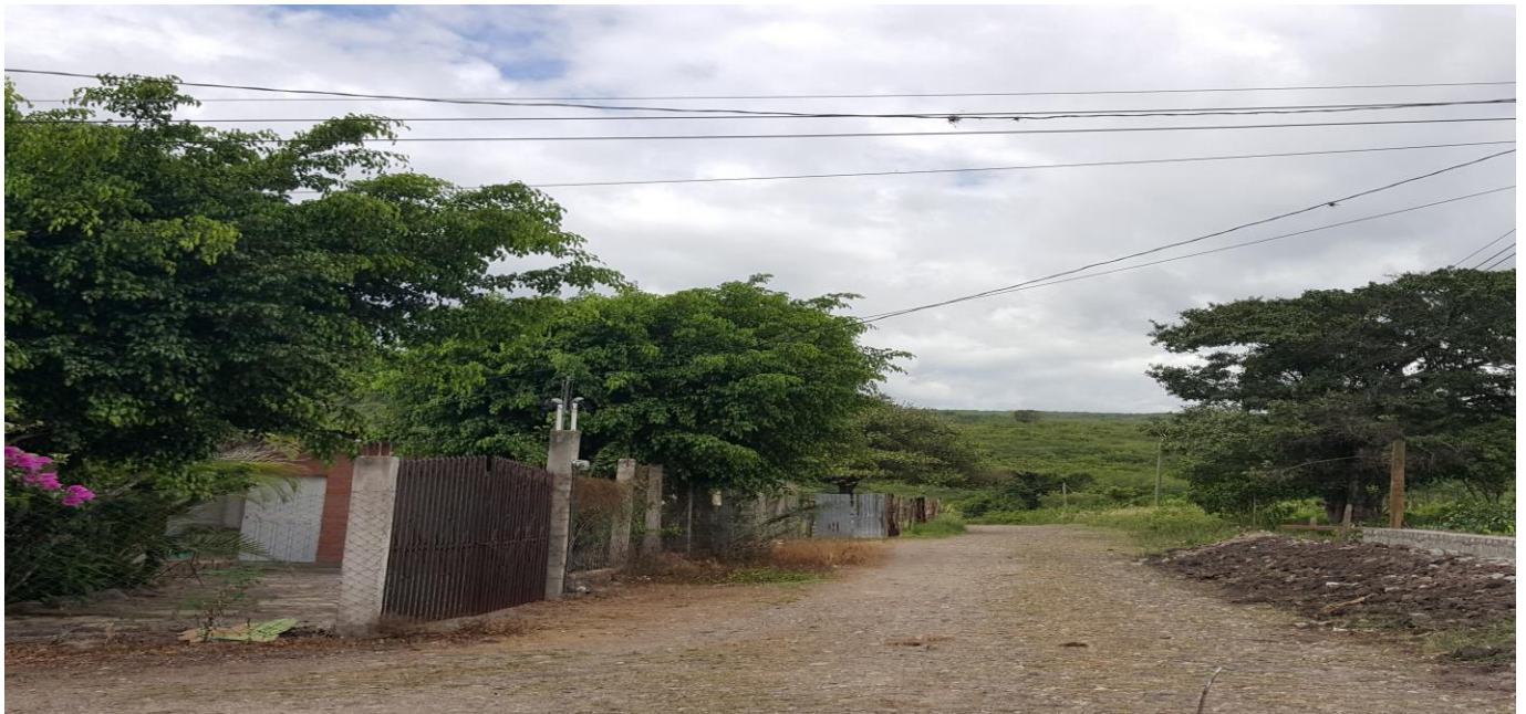
VISTA PANORAMICA DEL TRAMO A REPARAR