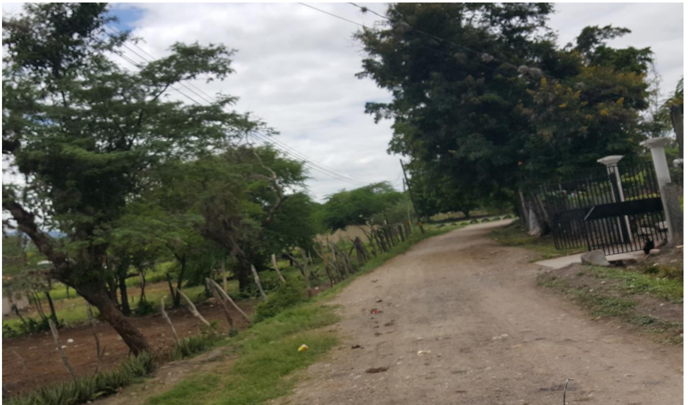
OTRA VISTA DEL TRAMO A REPARAR