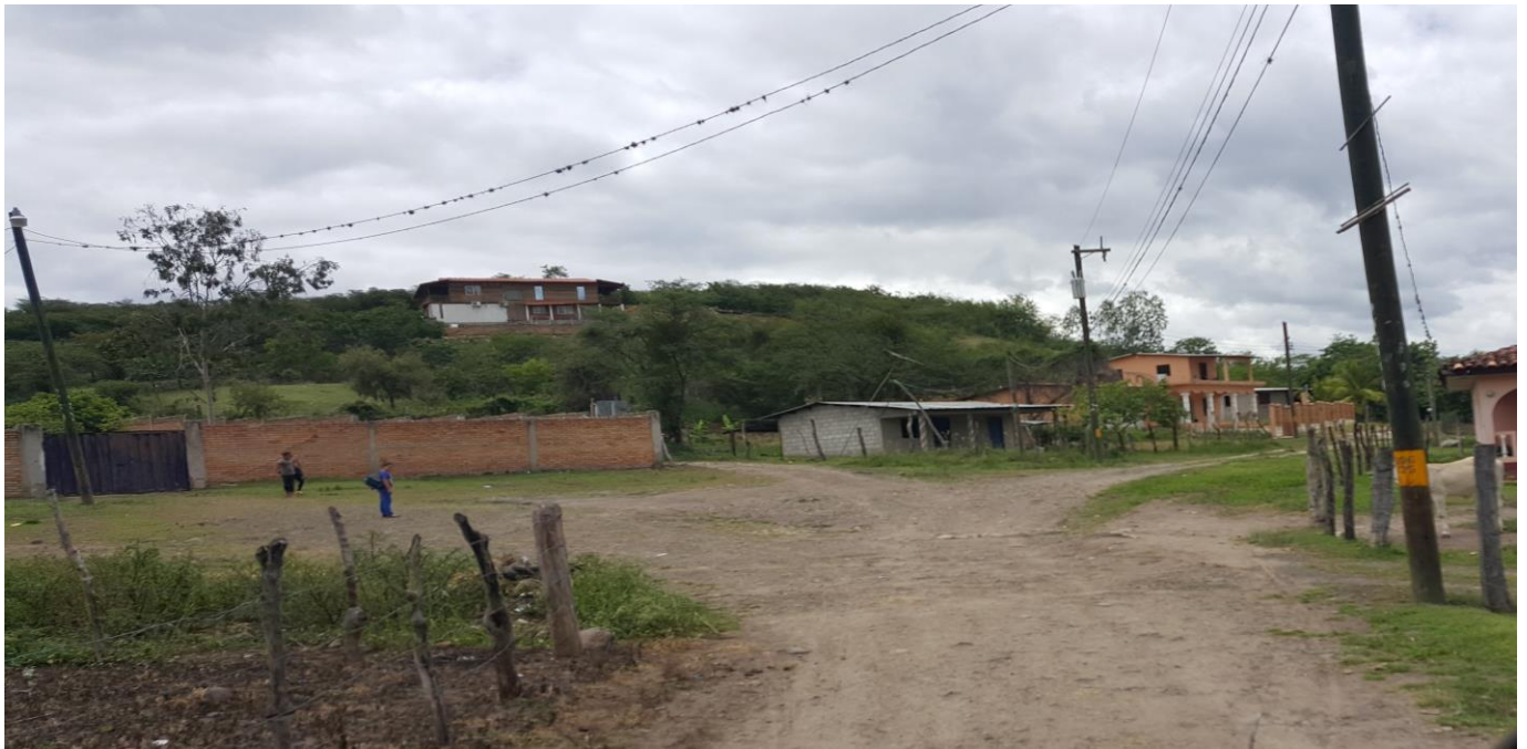
VISTA DEL MAL ESTADO DEL ACCESO A ALDEA LAS FLORES