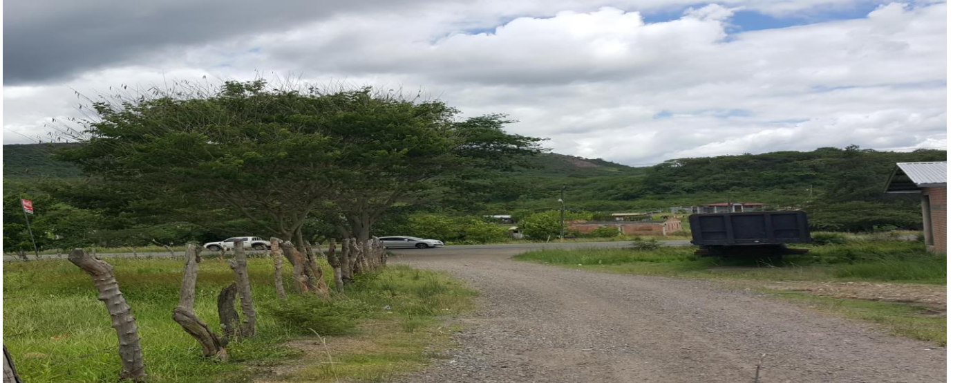
INCIO DE CALLE A CONFORMAR