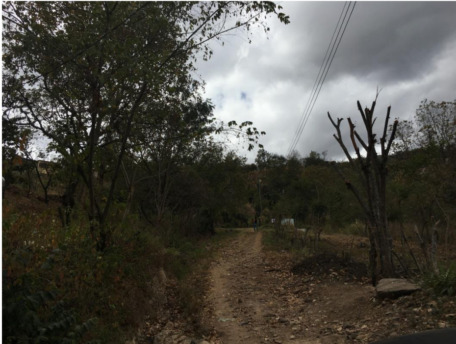
INICIO DE LA OBRA A EJECUTAR