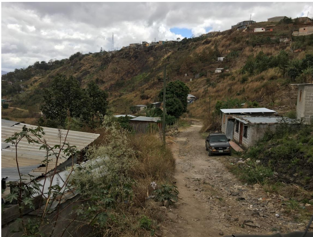
PANORÁMICA DE CALLE EN QUE SE EJECUTARÁ LA OBRA