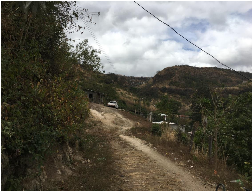
PANORÁMICA DE CALLE EN QUE SE EJECUTARÁ LA OBRA