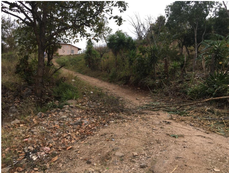
PANORÁMA EN DONDE SE CONSTRUIRÁN LAS HUELLAS VEHICULARES