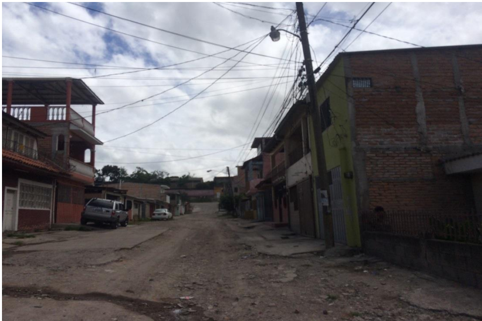
4. VISTA ESTADO ACTUAL DE CALLE A PAVIMENTAR