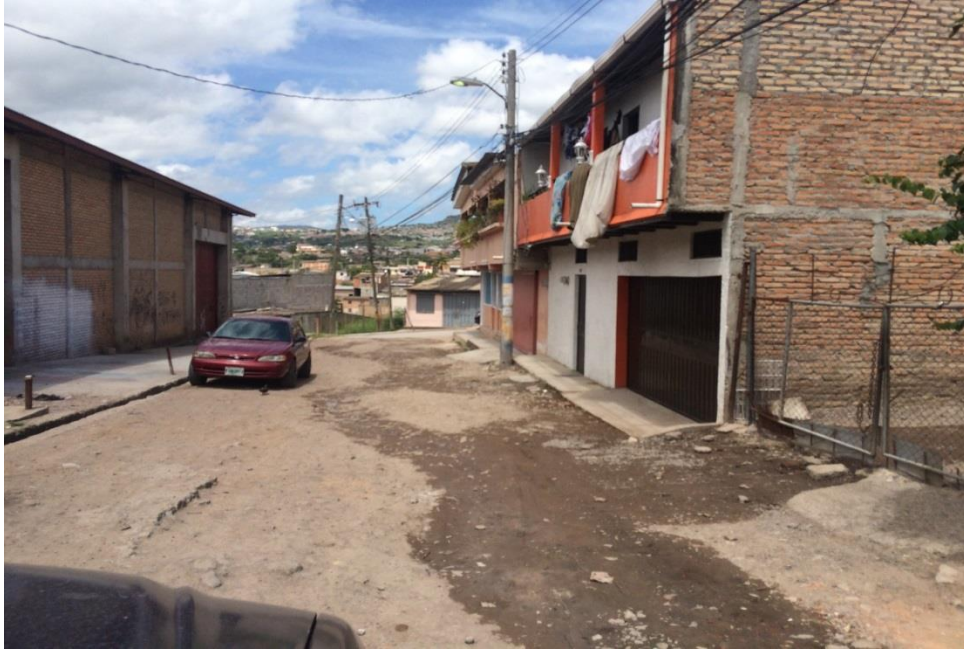
3. VISTA PANORAMICA DE CALLE A PAVIMENTAR