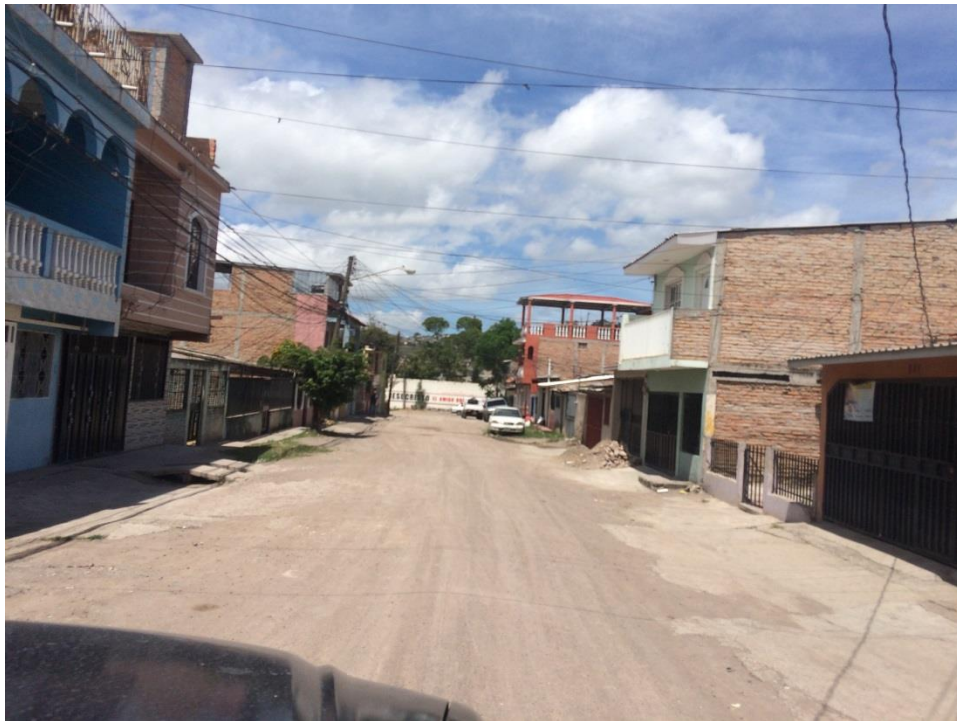
1. VISTA DE ESTADO ACTUAL DE CALLE A PAVIMENTAR

Proyecto: Pavimentación de calle con concreto hidráulico, colonia Santa Fé, calle Soroguara Código: 1291