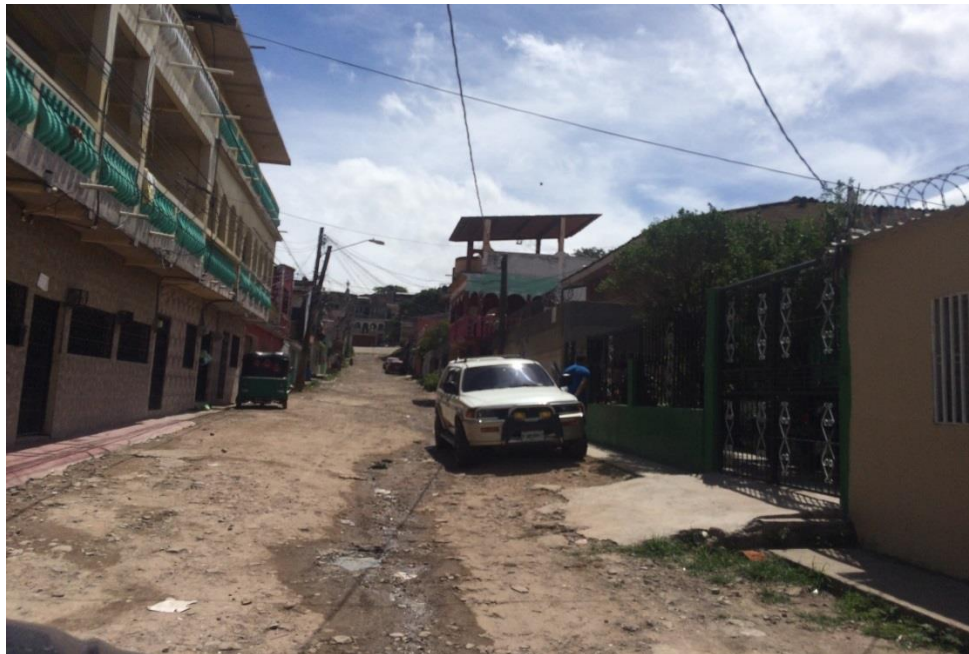
2. VISTA PANORAMICA DE CALLE A PAVIMENTAR