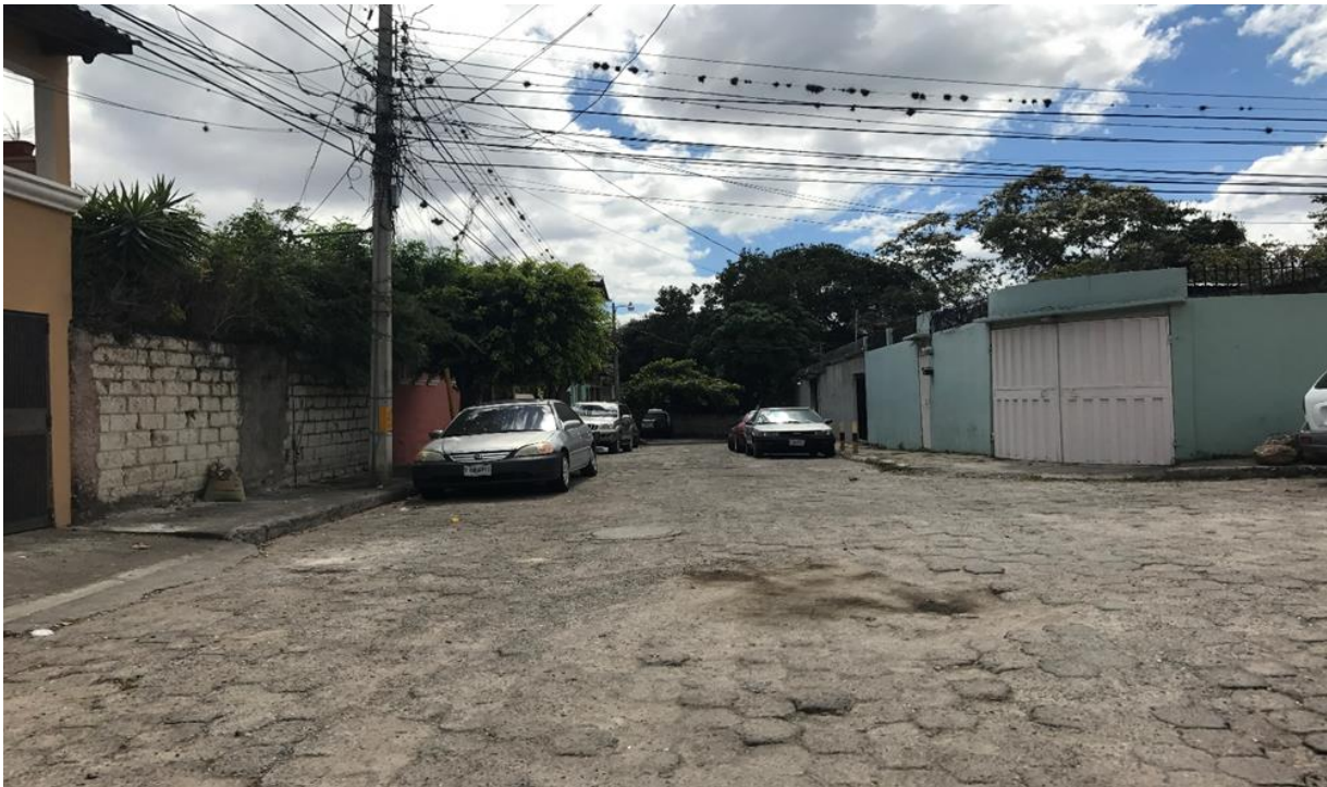
FINAL DE CALLE A PAVIMENTAR CON CONCRETO HIDRAULICO