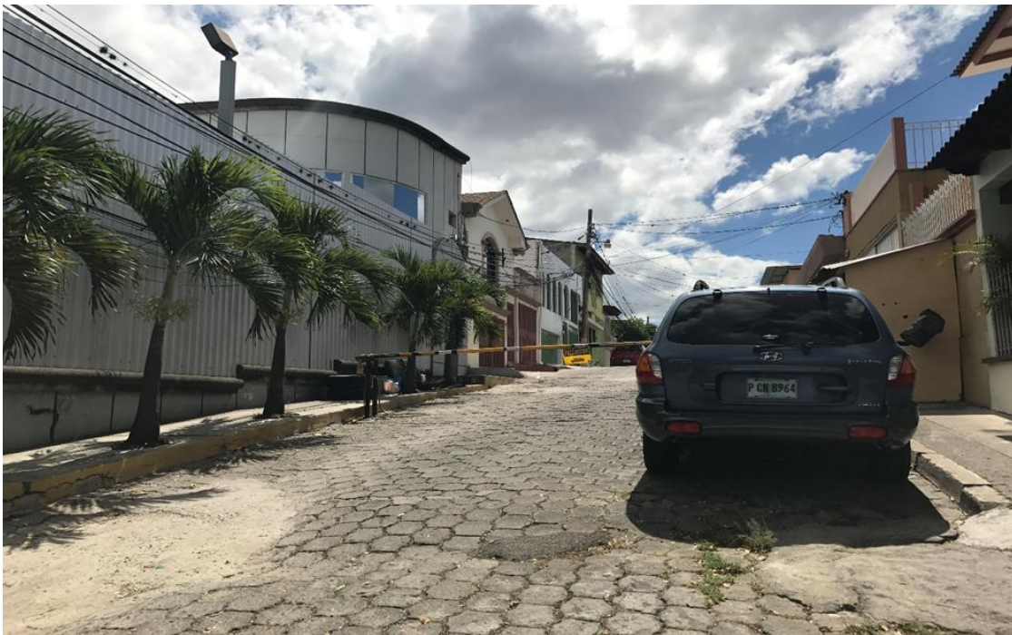
SE OBSERVA EL MAL ESTADO DEL ADOQUINADO