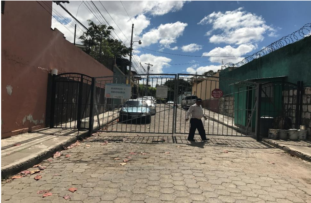
PANORAMA DE LA CALLE A PAVIMENTAR