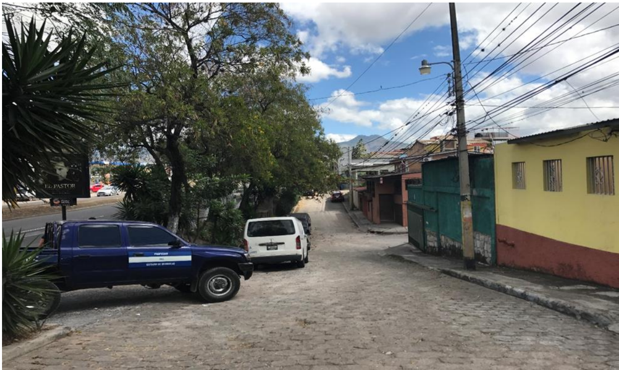
VISTA DE LA CALLE A PAVIMENTAR CON CONCRETO HIDRÁULICO