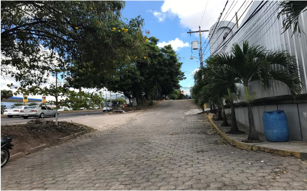
CALLE A PAVIMENTAR CON CONCRETO HIDRAULICO

Proyecto: Pavimentación de calle con concreto hidráulico, col. Miraflores Norte, bloque 75 Código: 1586