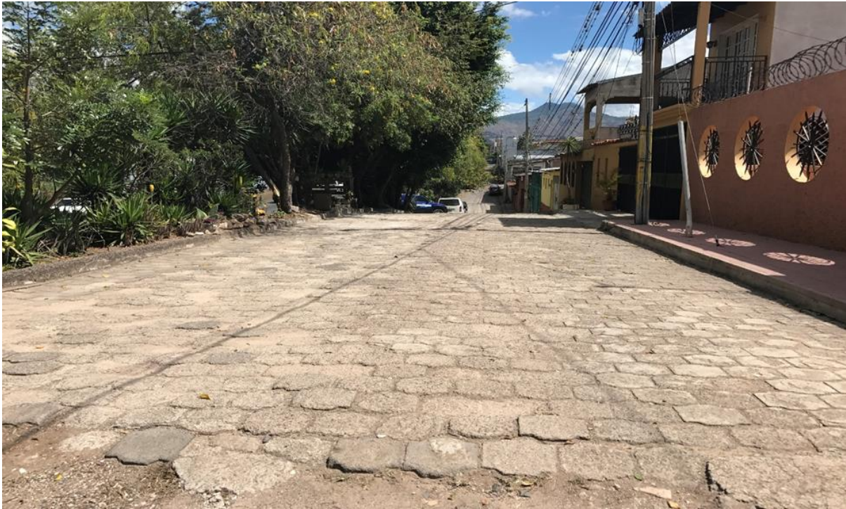
VISTA DE LA CALLE DONDE SE DESMONTARÁ EL ADOQUÍN